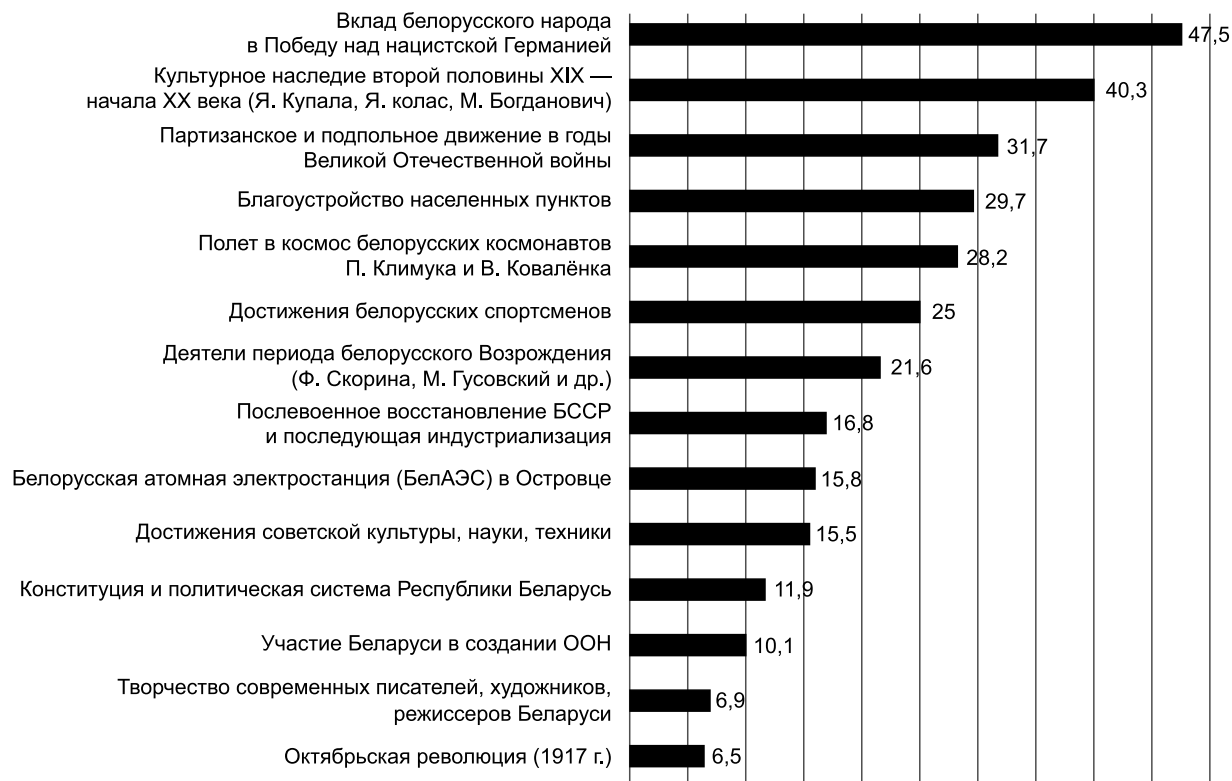
Рис. 1. Исследование «Восприятие исторического прошлого населением Беларуси в контексте формирования национально-государственной идентичности», ГНУ «Институт социологии НАН Беларуси» (2022)