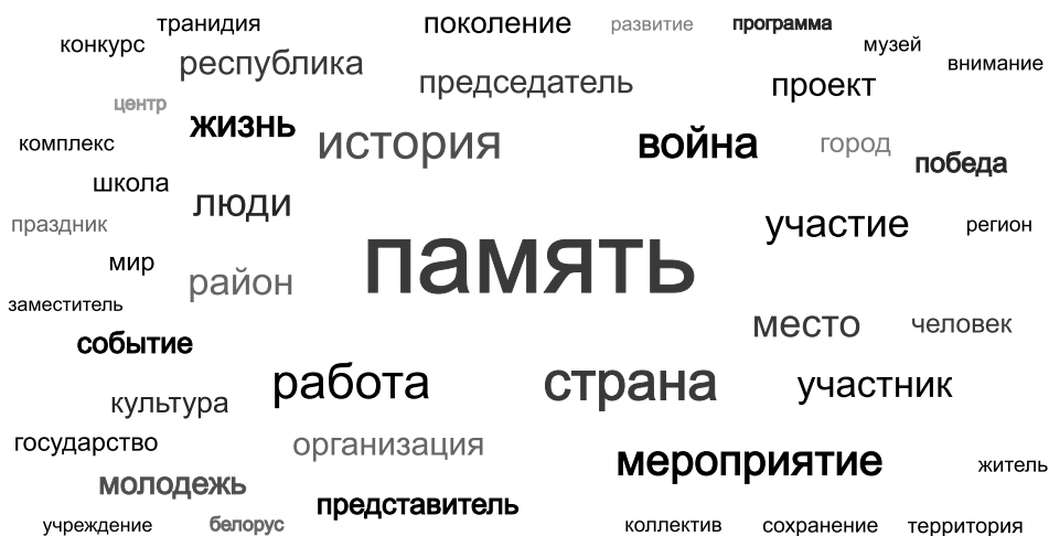
Рис. 2. Облако тегов по теме «Год исторической памяти»