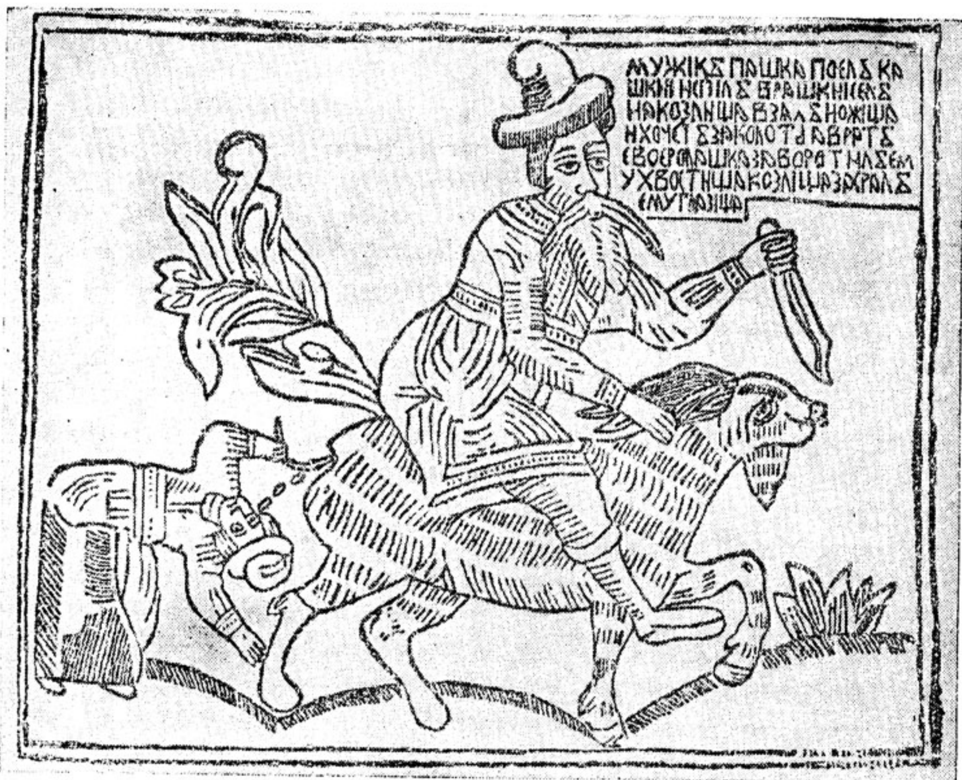
Мужик Пашка и брат его Ермошка. Лубочная картинка XVIII в.

тельности, встречаясь с превращением этого «прямого» мира в мир крошечный, ведет к уничтожению смеховой культуры Древней Руси.