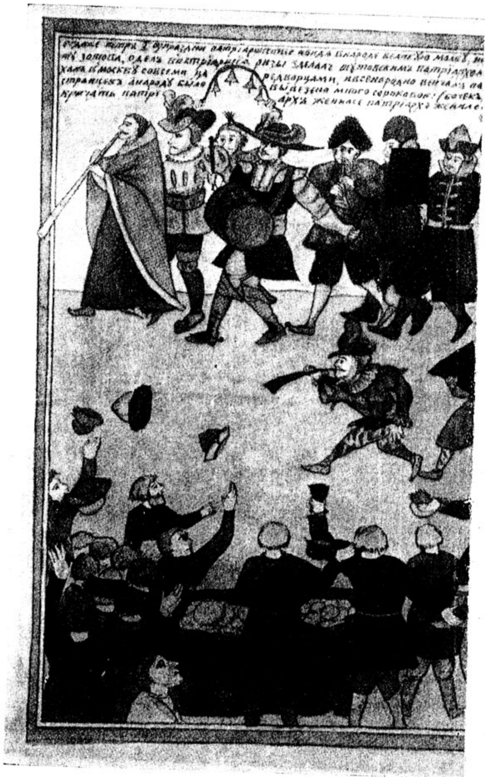
Шутовская свадьба князь-папы Никиты Зотова. Старообрядческий настенный лист (акварель) конца XVII.