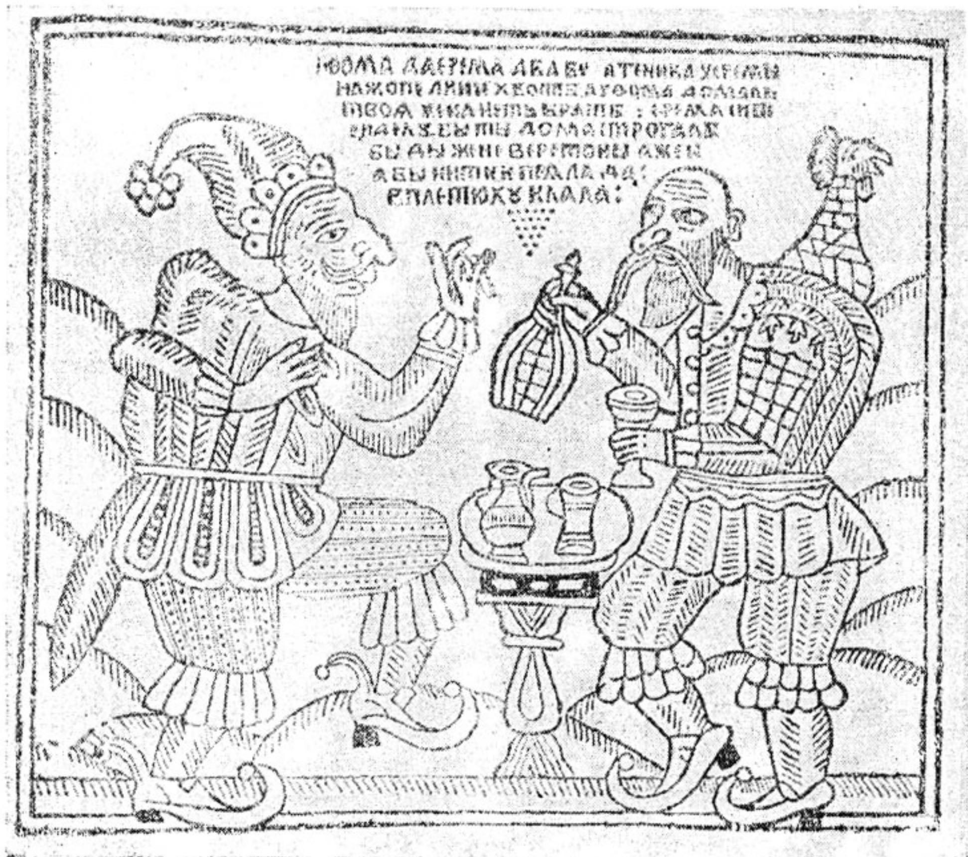
Фома да Ерема. Лубочная картинка XVIII в.