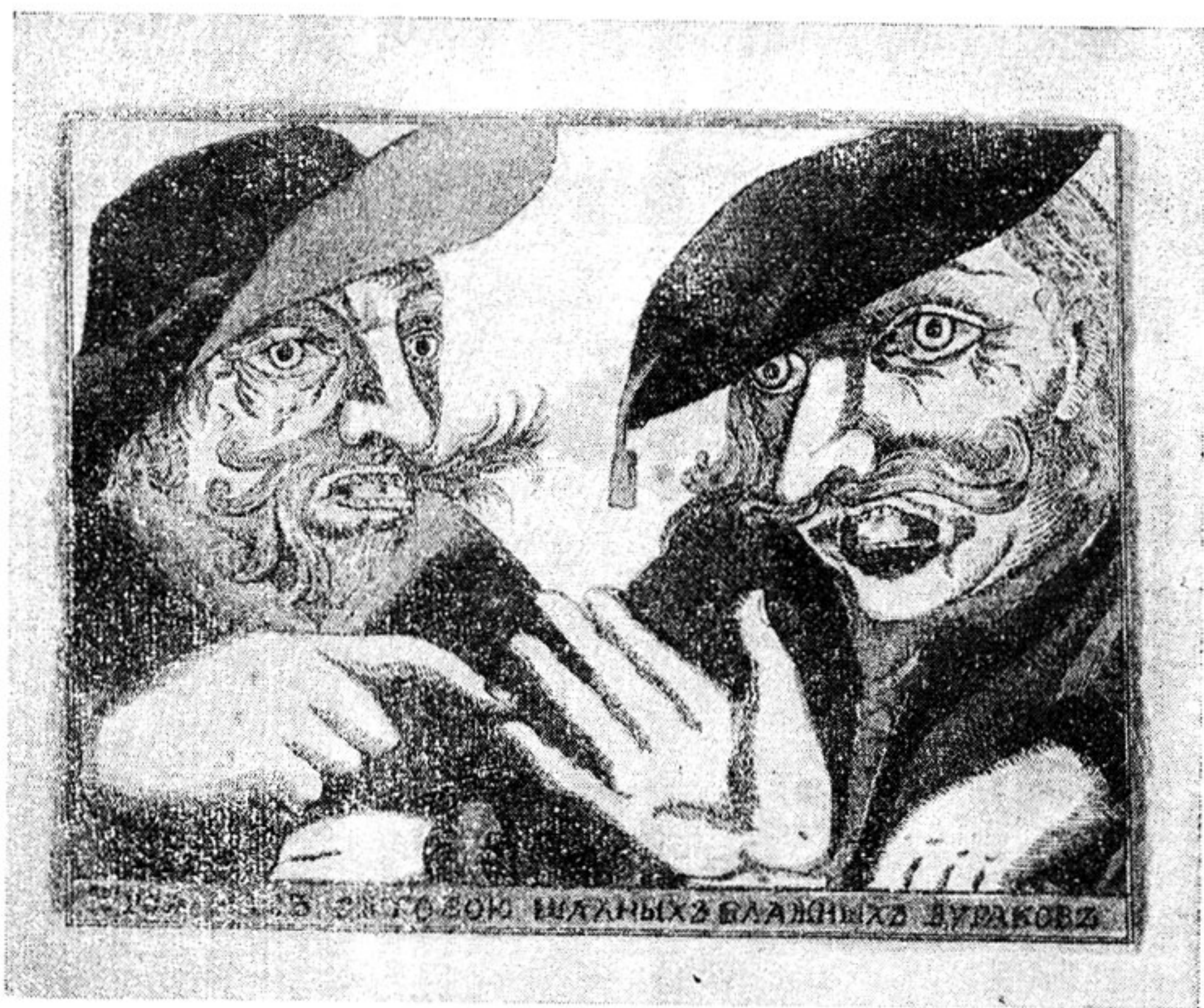
Два дурака втроем. Лубочная картинка XVIII в.

«Преступя страх» является смеховым соответствием к «возвах» и «призвах».