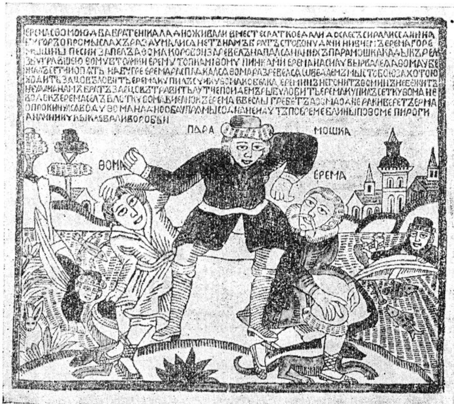
Фома, Ерема и Парамонка. Лубочная картинка XVIII в.

Это сказывается в двойном построении фраз, в разбивке каждого стиха как бы на две половины: