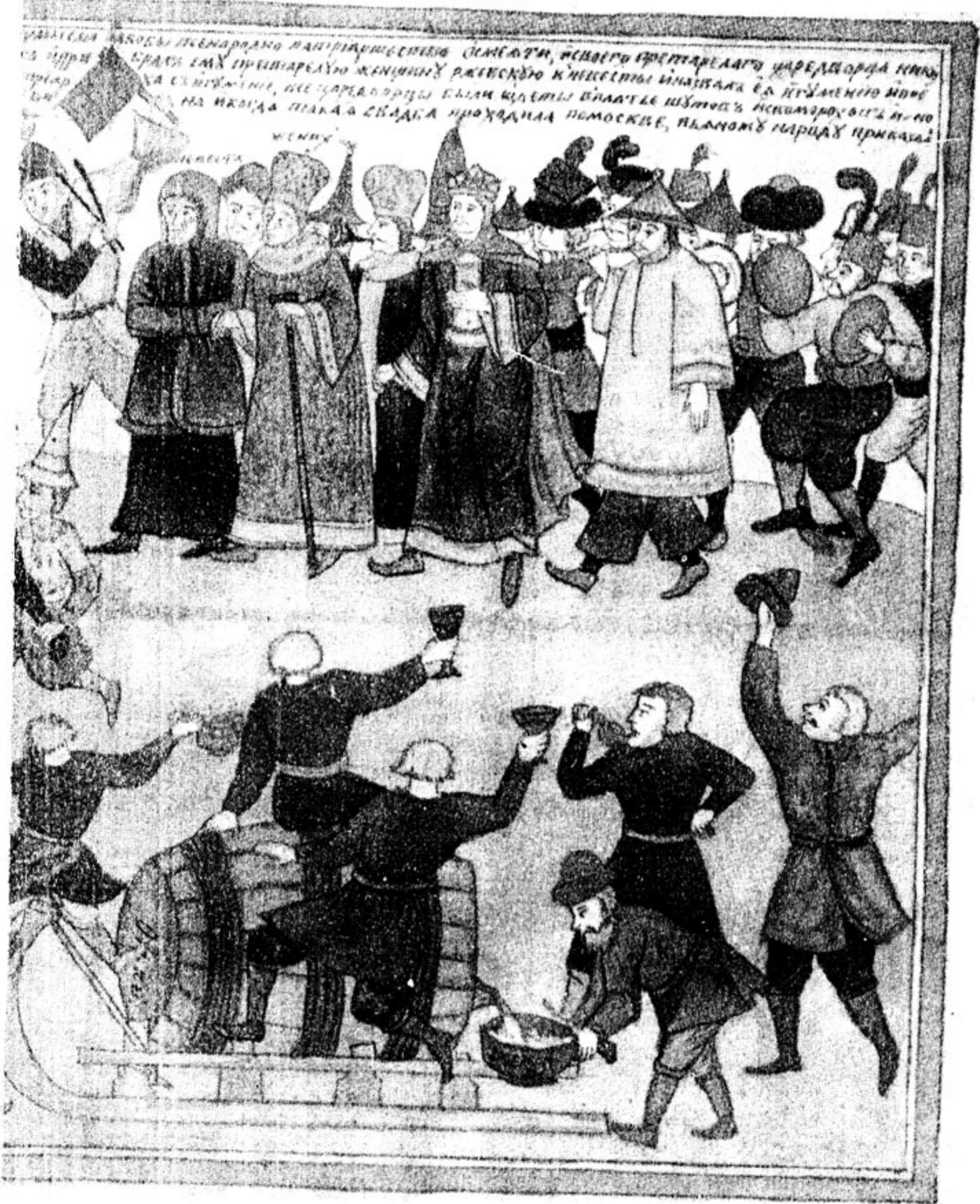
в. ИРЛИ, Древлехранилище, оп. 23, № 28.