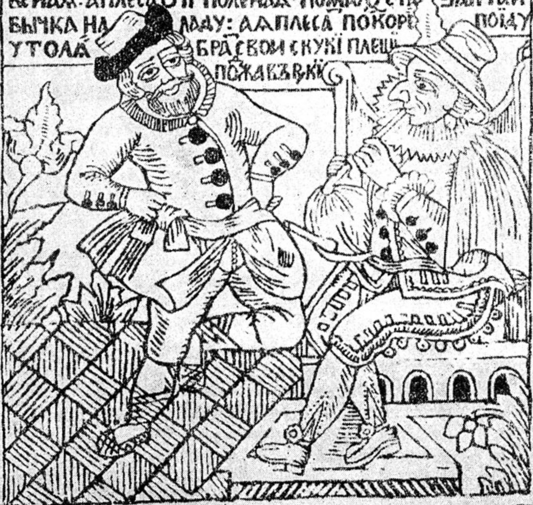
Плясун и скоморох. Лубочная картинка XVIII в.

ПЛЕШІ БРА АЕТНІКА: НАДУЛА МОА ВОЛЫНА. РАГІНБА ТОМА СВОІ НОШКІ: ВІАН ПІЩА ТРУБЫ АКО КОШКИ. ВОСЬМО ТУ ХВАКУ. ХВАТ БРА ВПРІСАКУ. А ПОТ ВОЕ ОХОТЕ: ІГРАЮ І НЕ ПОНОТЕ. АНА ПРЕИРАНАА МЪЗЫКА: САБА ВА ОЧІ БЕЛІКА. ЕЖЕЛІБЫ КНЕ РЫЛЕ БЫЛІ: ТОБЪ НЕТА РАВЕСЕЛІАН ☉ СПАСІБА СТА ЧТО МЕНА ОБЕСЕЛАШІ НАВАЛЫКЕ ПАЧЕ ОРГАНО ІГРАЕ. МОА ІГРАСІА ЛЮ БЕИДА: А ПЛЕСА ОЧІ ПОЛЕНАА ПОЖАЛУСТА ЗАІГРАЙ БЫЧКА НА ЛАДУ: А ПЛЕСА ПОКОРЕ ПОІДУ УТОЛА БРА СВОМ СКУКІ ПЛЕЩІ