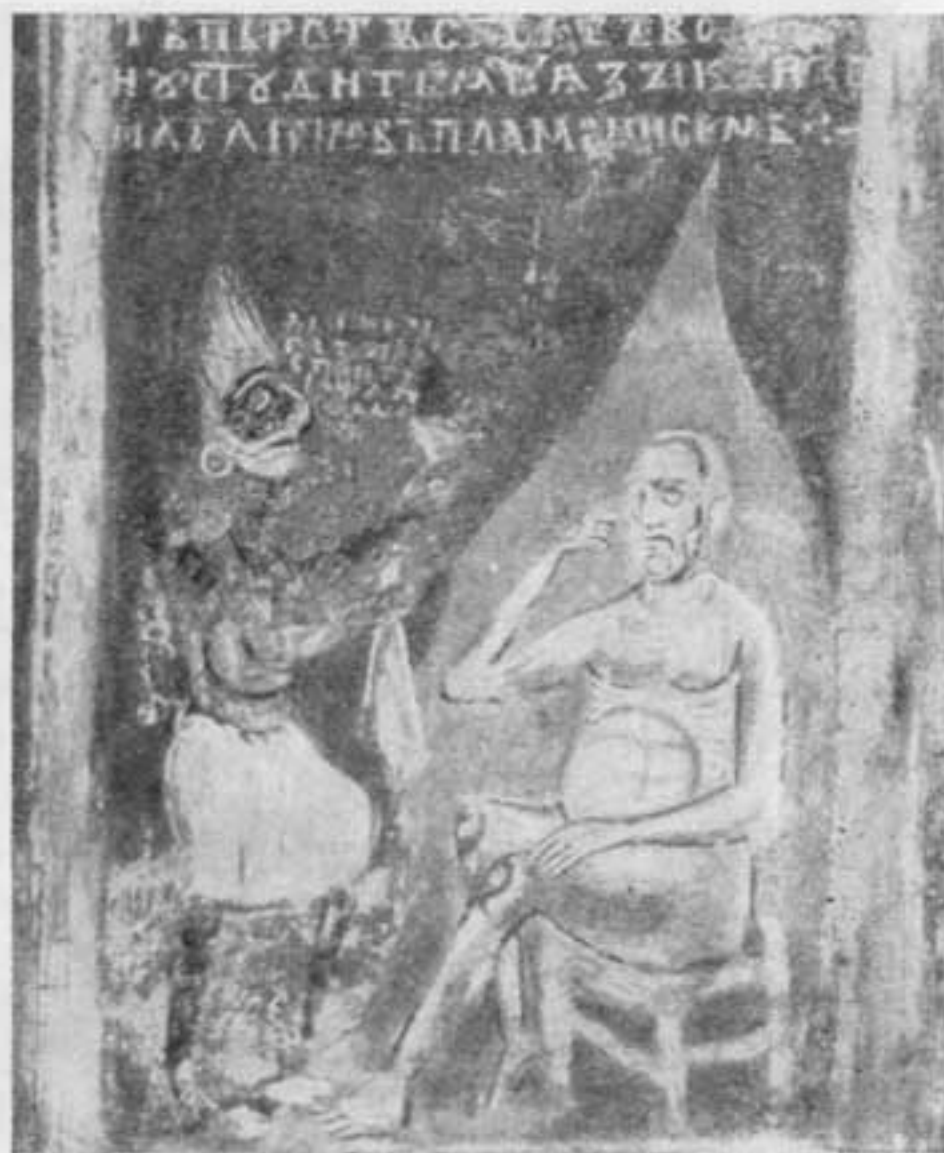
Притча о богатом и бедном Лазаре. Деталь фрески церкви Спаса на Нередице в Новгороде. XII в.

ве» — Всеволода Большое Гнездо с наследником среди коленопреклоненных подданных 1 .