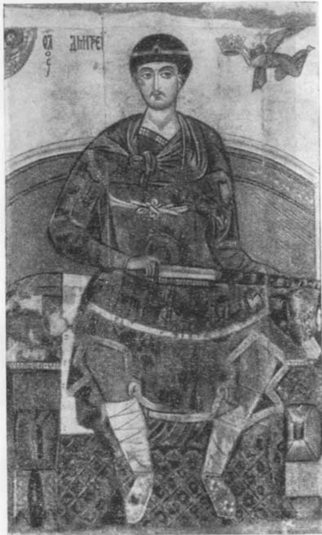
Дмитрий Солунский. Икона из Дмитриевского собора во Владимире. Вторая половина XII — начало XIII в.

Летопись дает нам представление о существовании в Галиче в середине XII в. целой группы дворцовых построек, близких по типу к замку Андрея Боголюбского: здесь были дворец, лестница с сенями, дворцовый храм и переходы к нему из дворца. Галицкие