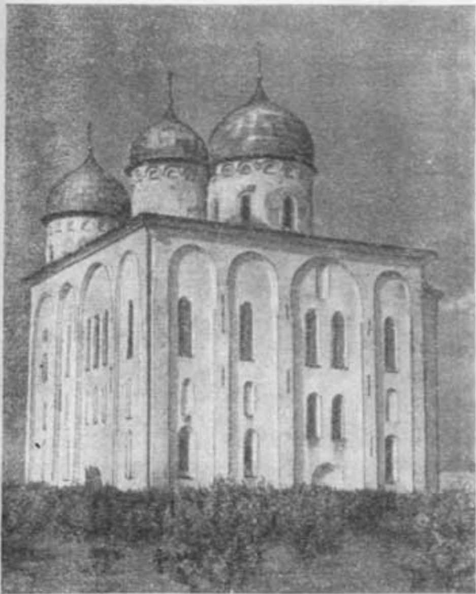
Собор Георгия Юрьева монастыря в Новгороде. Начало XII в.