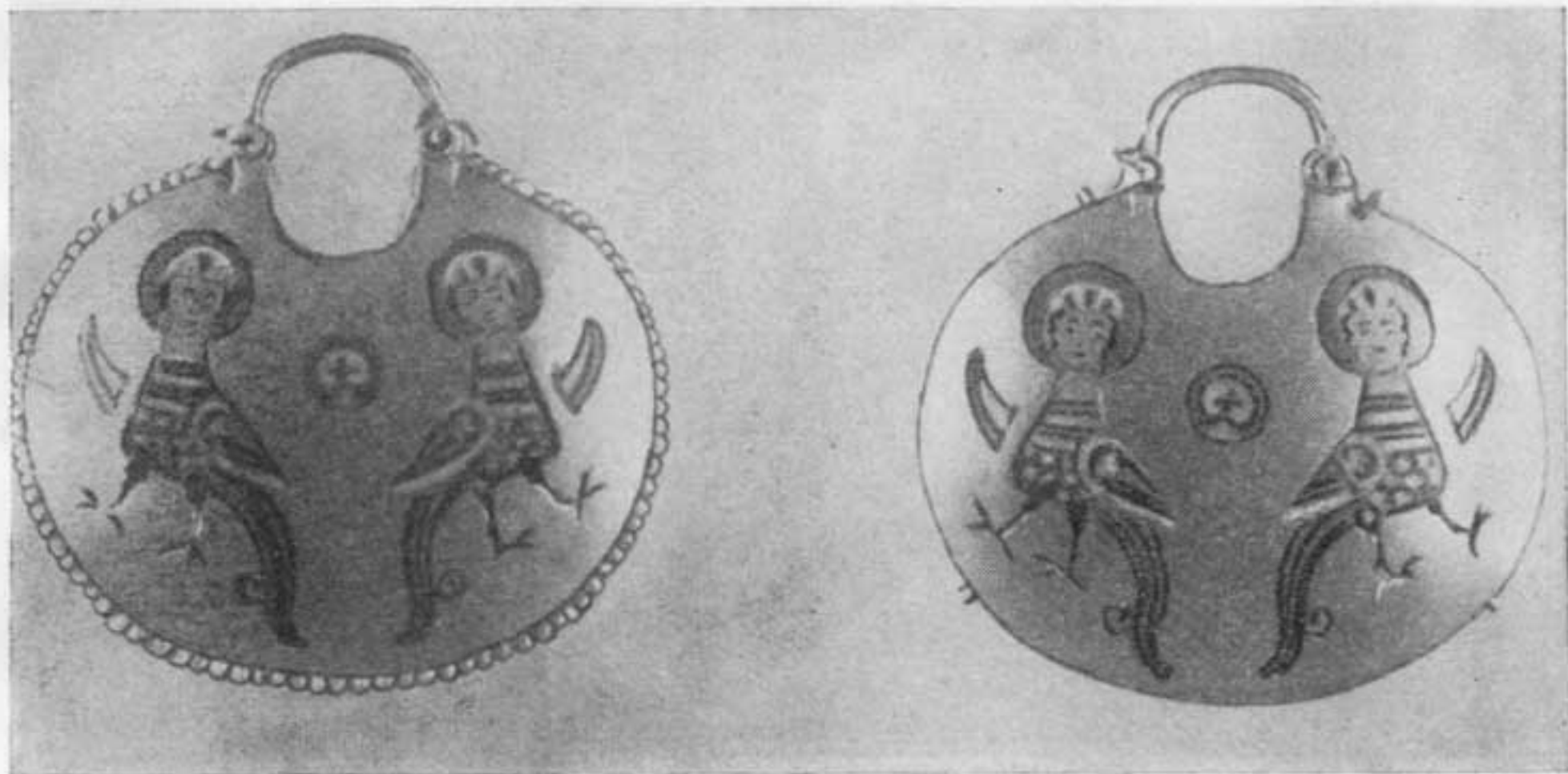
Золотые подвески с эмалью. XII в.

Установление нового политического порядка в Новгороде сказалось не только на изменении общего характера новгородского искусства, но и в письменности. Резко меняется летописание, которое отныне приобретает черты простоты, лаконизма, интереса к быту и известного демократизма стиля и языка, ставших обычными в новгородском летописании вплоть до XV в.