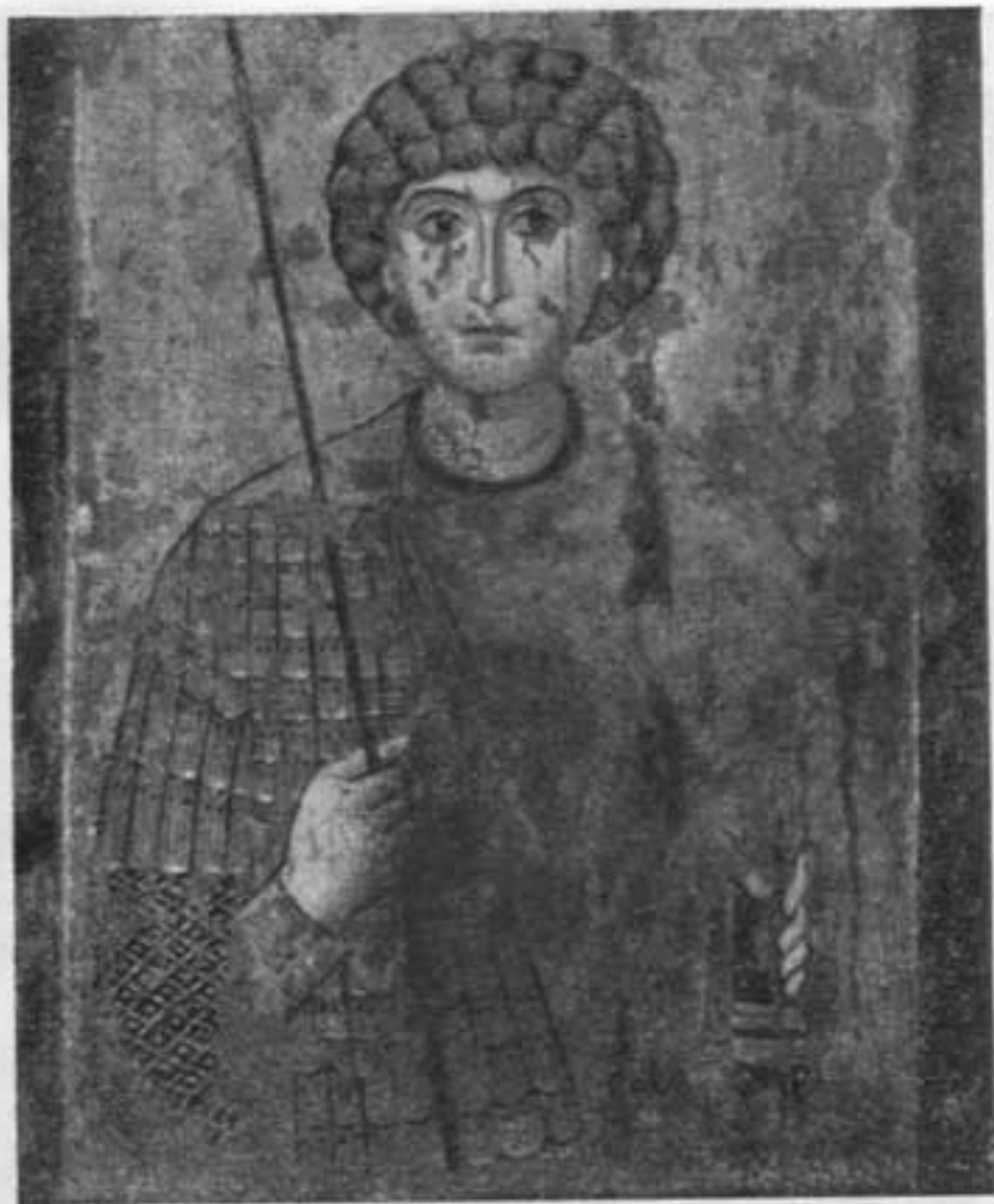
Георгий. Икона Успенского собора Московского Кремля. XI — начало XIII в.

О богатстве внешнего убранства галицко-волынских храмов дает представление описание церкви Ивана в Холме, помещенное в Ипатьевской летописи под 1259 г. В этой церкви, «красной и лепой», своды опирались на капители в виде человеческих голов, изваянных «от некоего хитреца», в окна были вставлены витражи, верх церкви был украшен «звездами златыми на лазуре». Пол церкви был «слит от меди и от олова чиста, ярко блестяся яко зеркалу». Две двери были «украшены камением галичным белым и зеленым холмьским, тесаным, изрытым некимь хытрецемь Авдьемь».