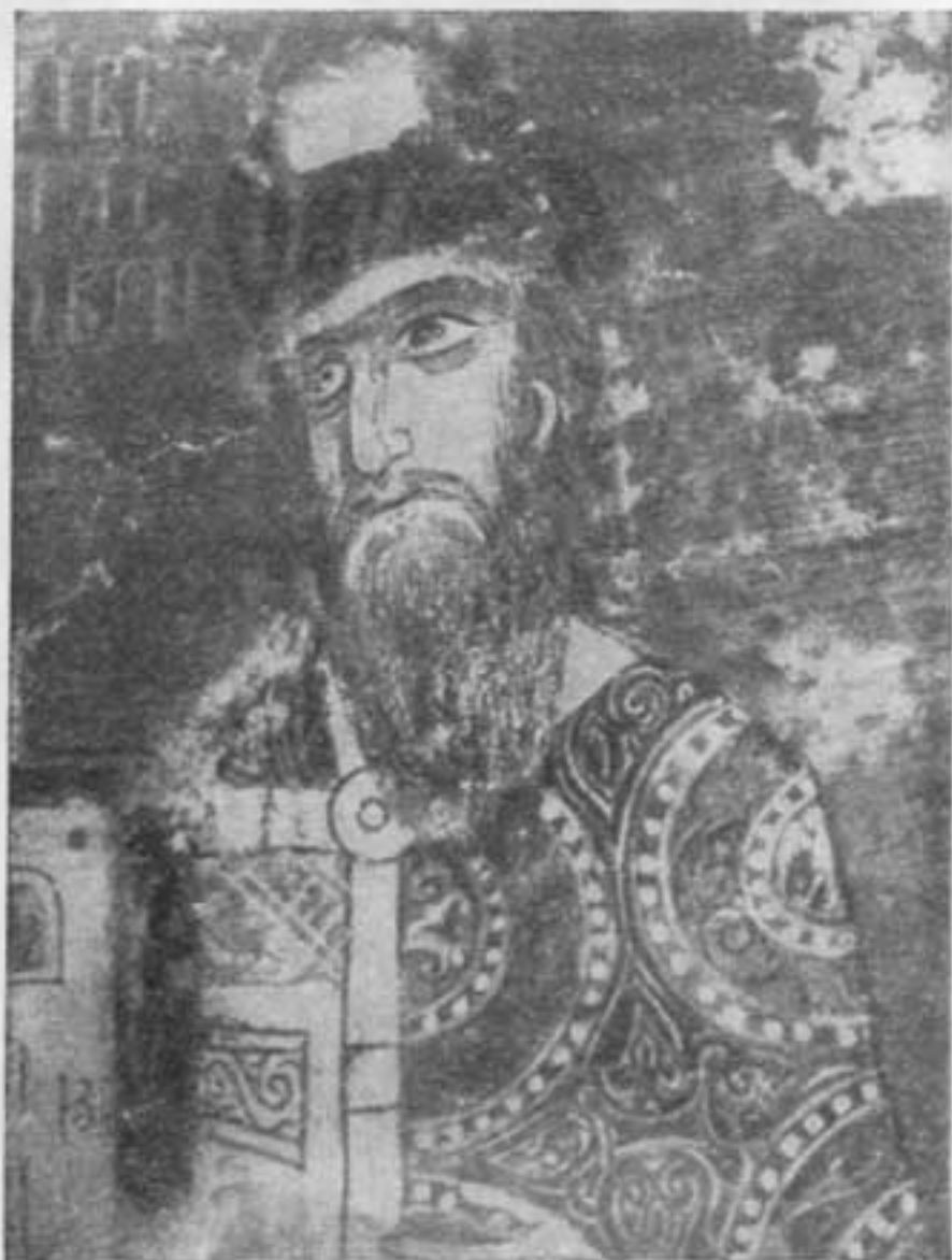
Ярослав Всеволодович — отец Александра Невского. Деталь фрески церкви Спаса на Нередице в Новгороде. XIII в.