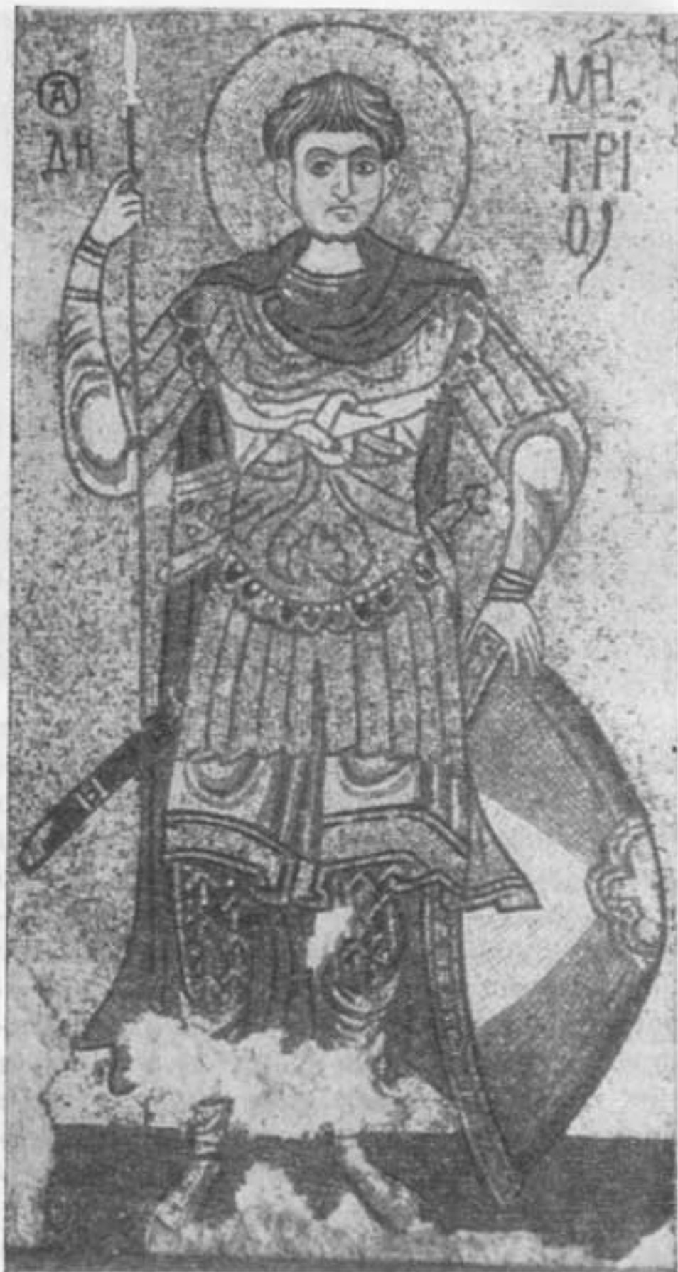
Дмитрий Солунский. Деталь мозаики Михайловского Златоверхого монастыря в Киеве. 1111—1113 гг.

Заметно иные, более демократические формы приобретает живопись и в особенности архитектура. Боярско-купеческое строительство второй половины XII в. вырабатывает новый тип четырехстолпного, квадратного в плане, укороченного