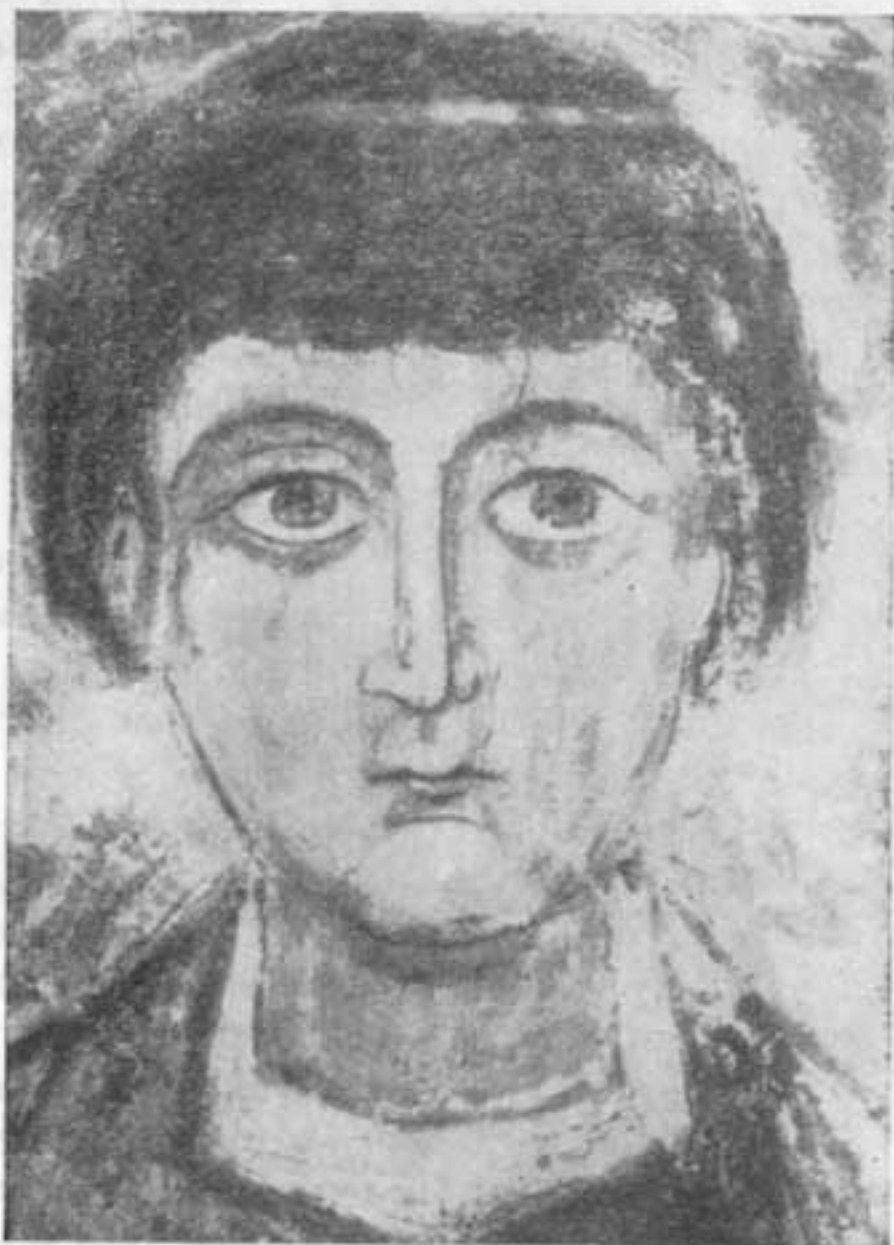
Василий Великий. Деталь мозаики Софийского собора в Киеве. XI в.