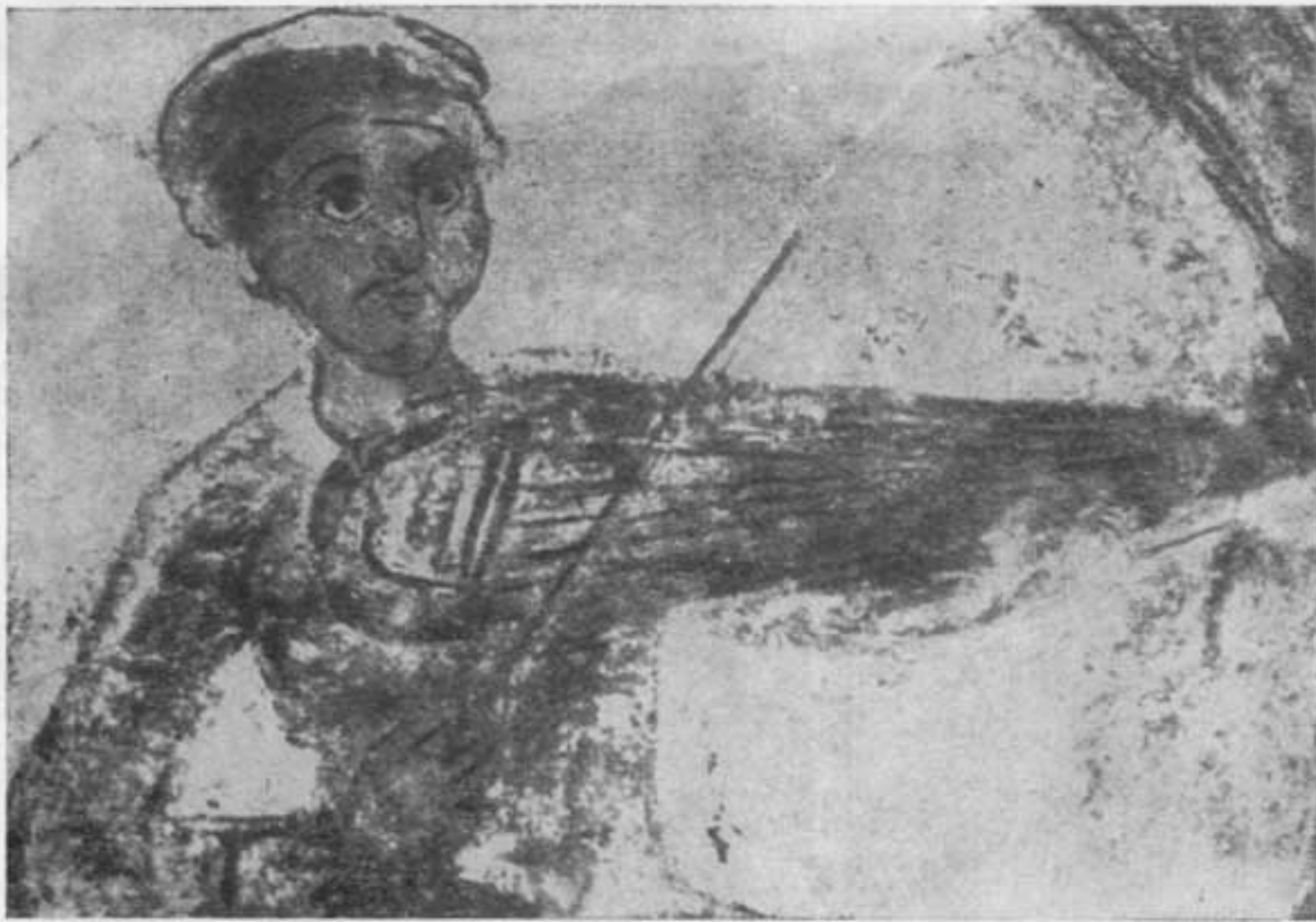
Музыкант. Деталь фрески Софийского собора в Киеве. XI в.

смерти, монашеские постриги, переменны княжения тем или иным князем и изредка походы.