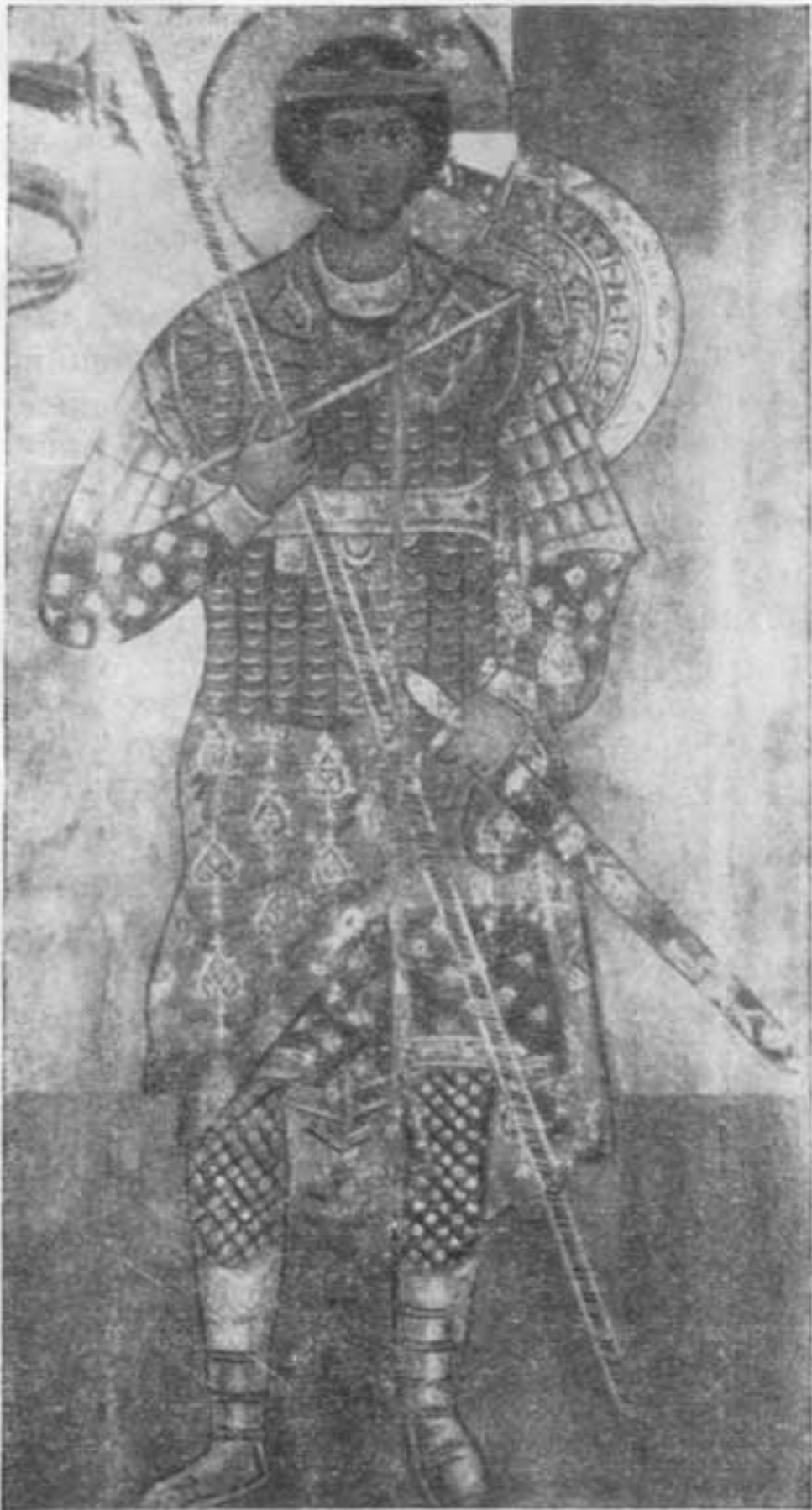
Георгий Победоносец. Икона из Георгиевского собора Юрьева монастыря в Новгороде. XII в.

ской княжбѣ летописи, идеологически обосновывавшей реальные притязания владимирских князей.