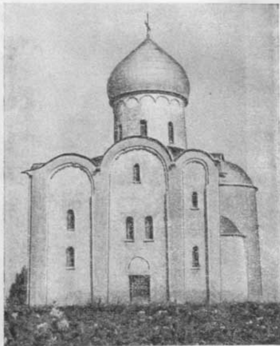
Церковь Спаса на Нередице в Новгороде. 1198 г.

туры. Ее пропорции отличаются гармоничностью и стройностью. Внутри церковь была богато расписана фресками, а снаружи украшена каменной резьбой, декоративной скульптурой. На стенах церкви Покрова можно увидеть изображение библейского царя Давида, играющего на струнном инструменте — «псалтири», женские маски, львов, голубей, грифонов 1 , терзающих ягненка, барсов.