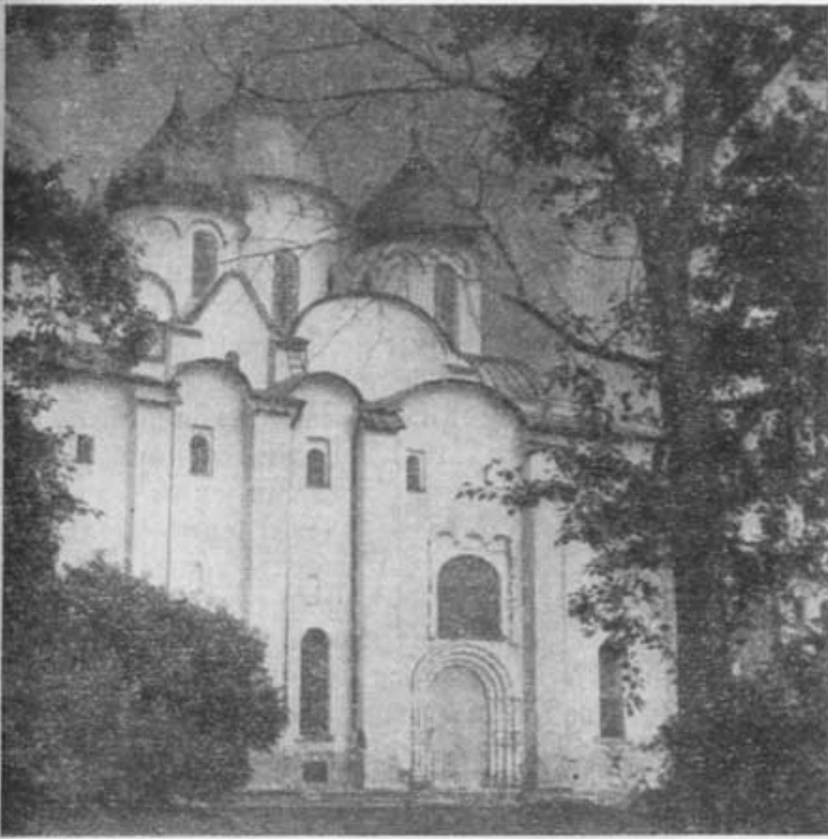
Софийский собор в Новгороде. XI в.