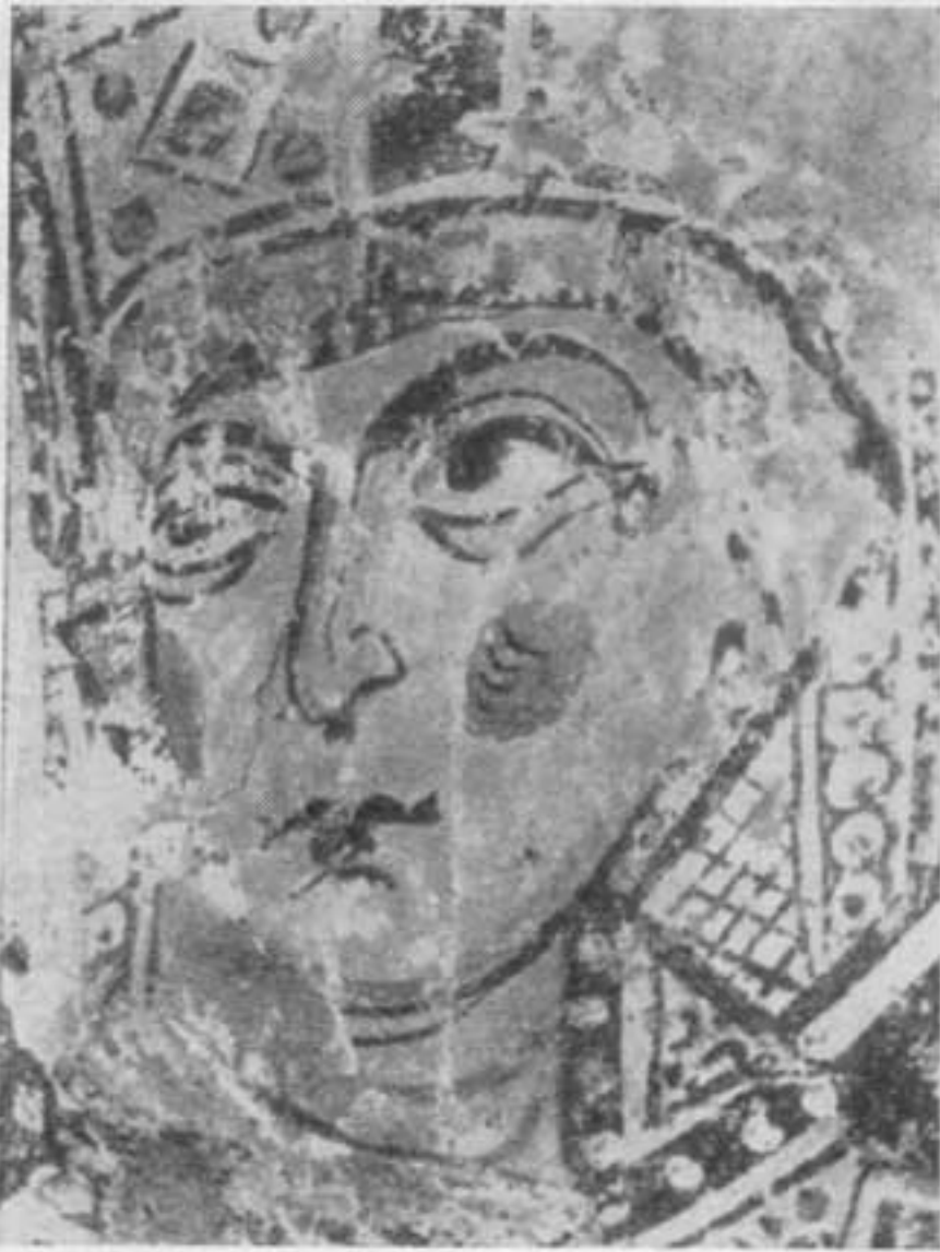
Святая Елена. Деталь фрески Софийского собора в Новгороде. XIII в.

самбля. Это был небольшой храм с одной вызолоченной главой, с полуцилиндрическими покрытиями прямо по сводам. Его фасады членились на три доли сложными пилястрами и были опоясаны на середине высоты аркатурно-колончатым поясом. Стены были украшены резными камнями.