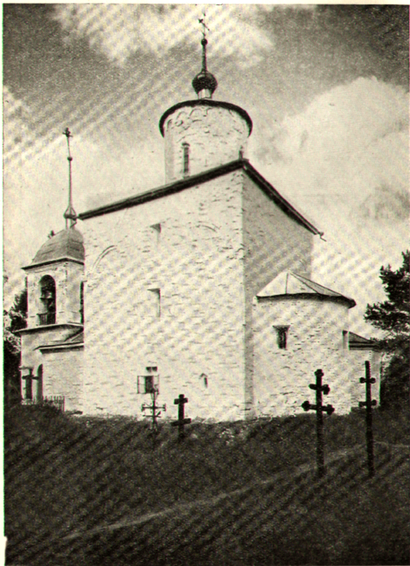
11. Церковь Успения в Волокове, 1352 г.