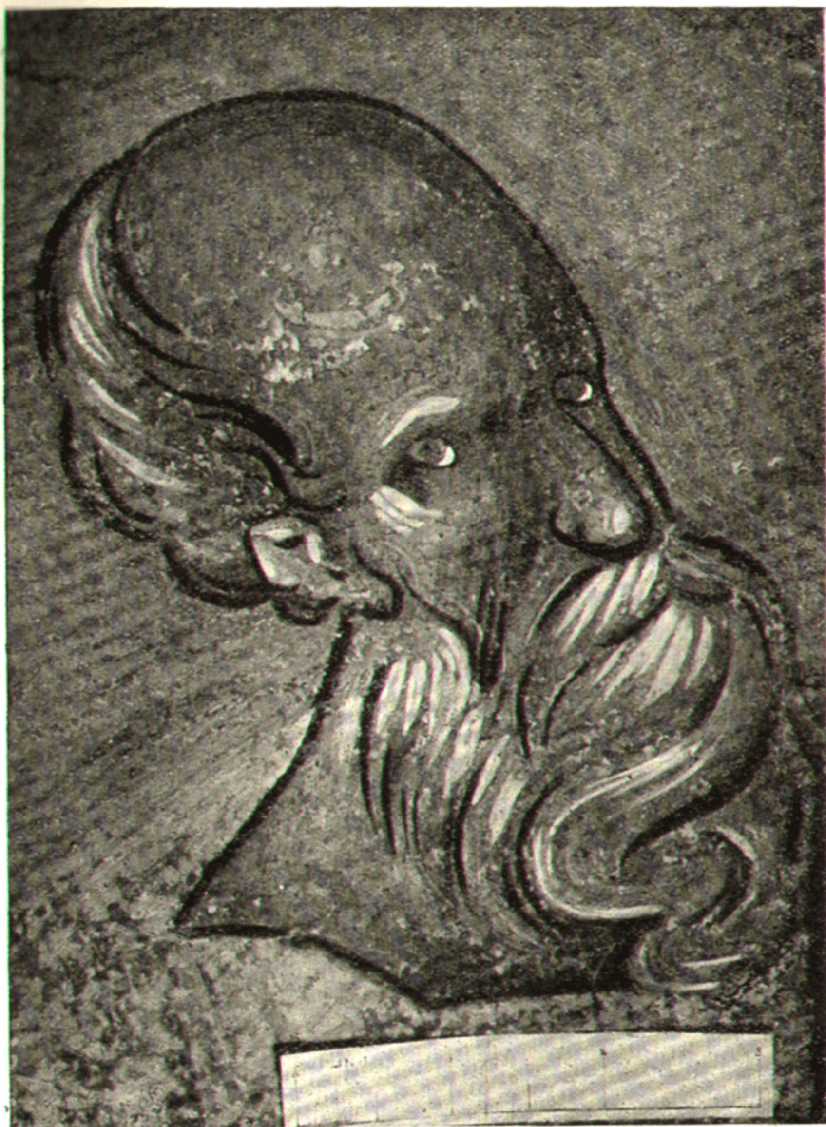
14. Вологово. Голова евангелиста Иоанна (1363 г.) Фреска.