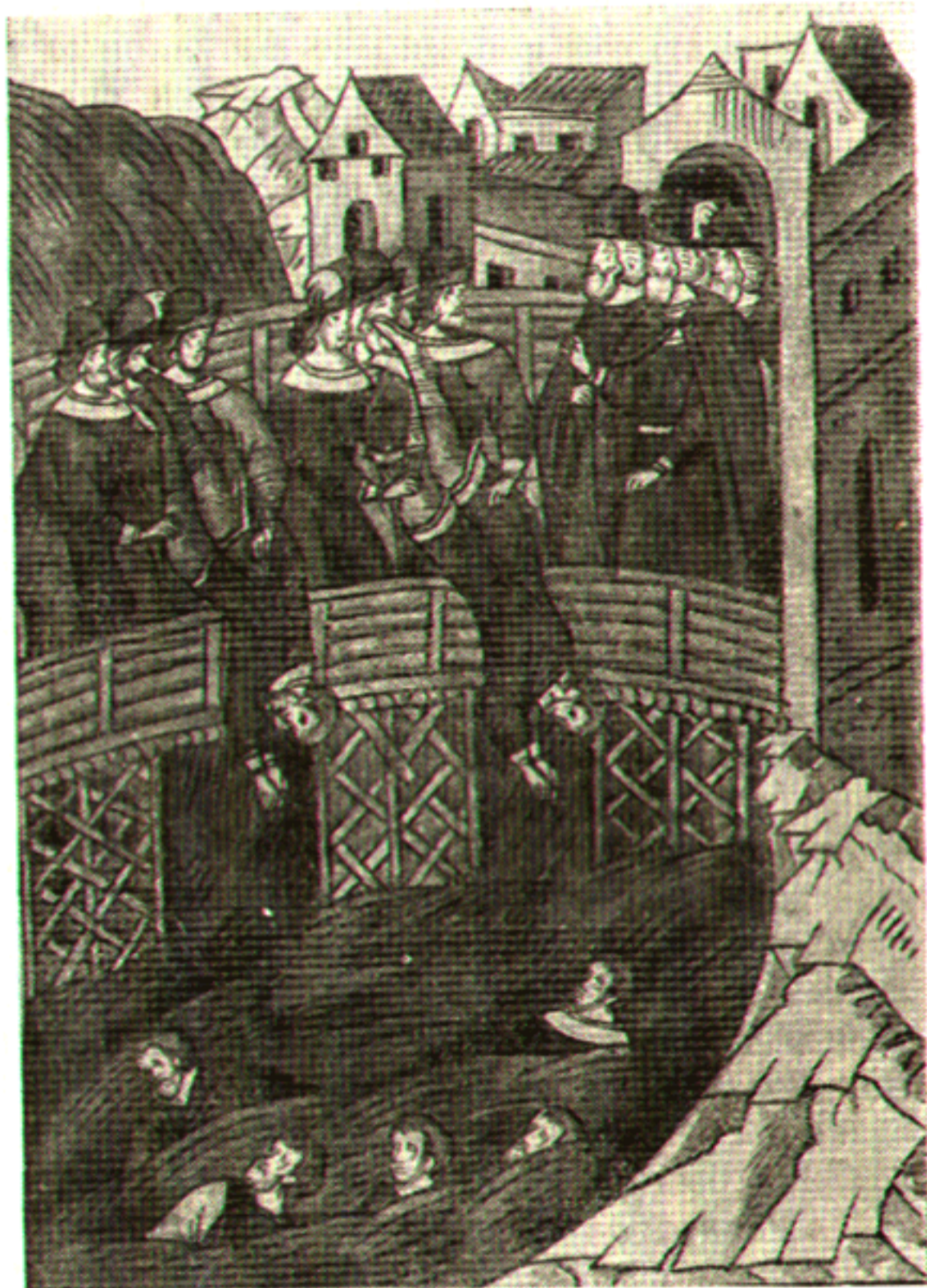
Стригольников бросают с моста в Новгороде. Лицевой летописный свод. Остермановский том I, л. 692 об.

Указанием на ранние связи севернорусских областей с славянским Югом может служить сохранившаяся с псковскими добавлениями XIV в. Саввина книга евангельских чтений. Западное влияние сказывалось преж-