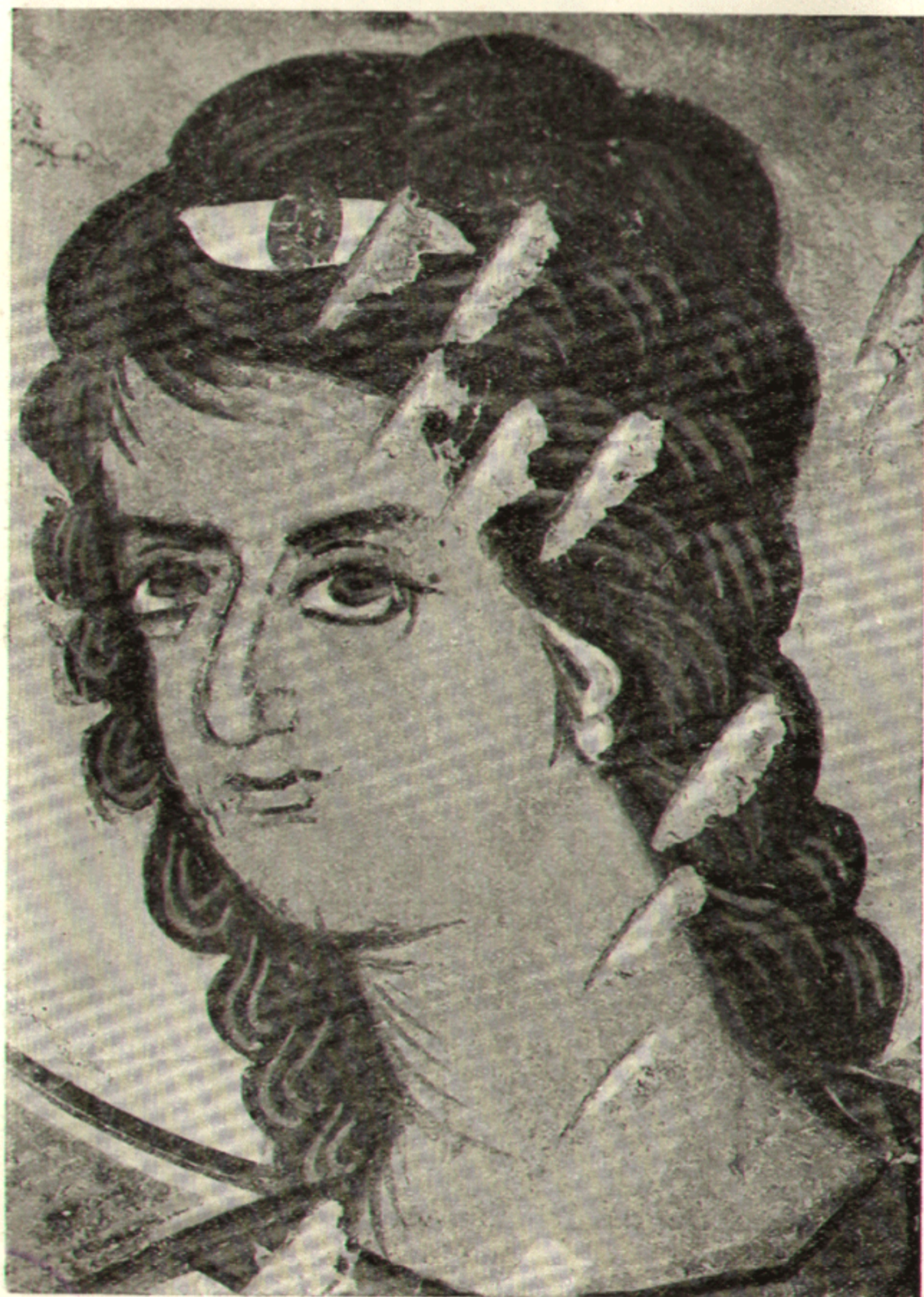
15. Вологово. Голова ангела, 1363 г. Фреска.