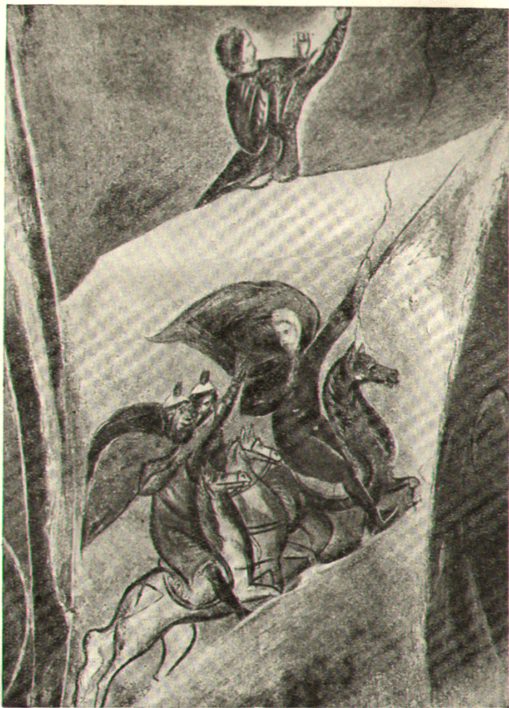
13. Волоотово. Деталь композиции Рождества Христова, 1363 г. Фреска.