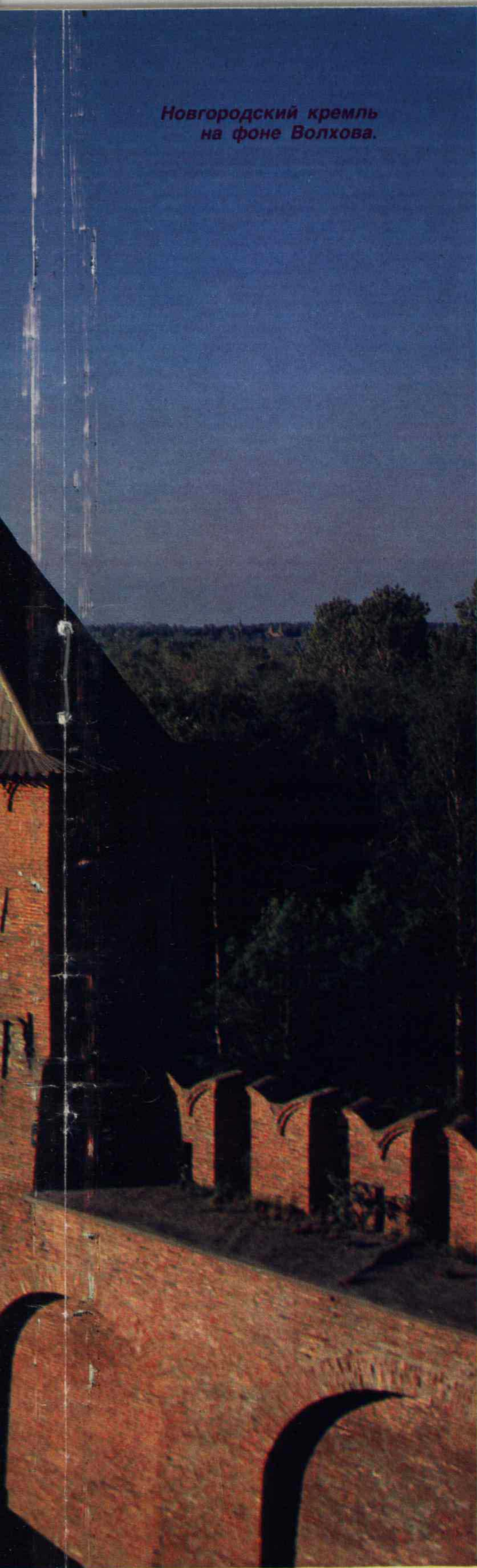
Новгородский кремль на фоне Волхова.