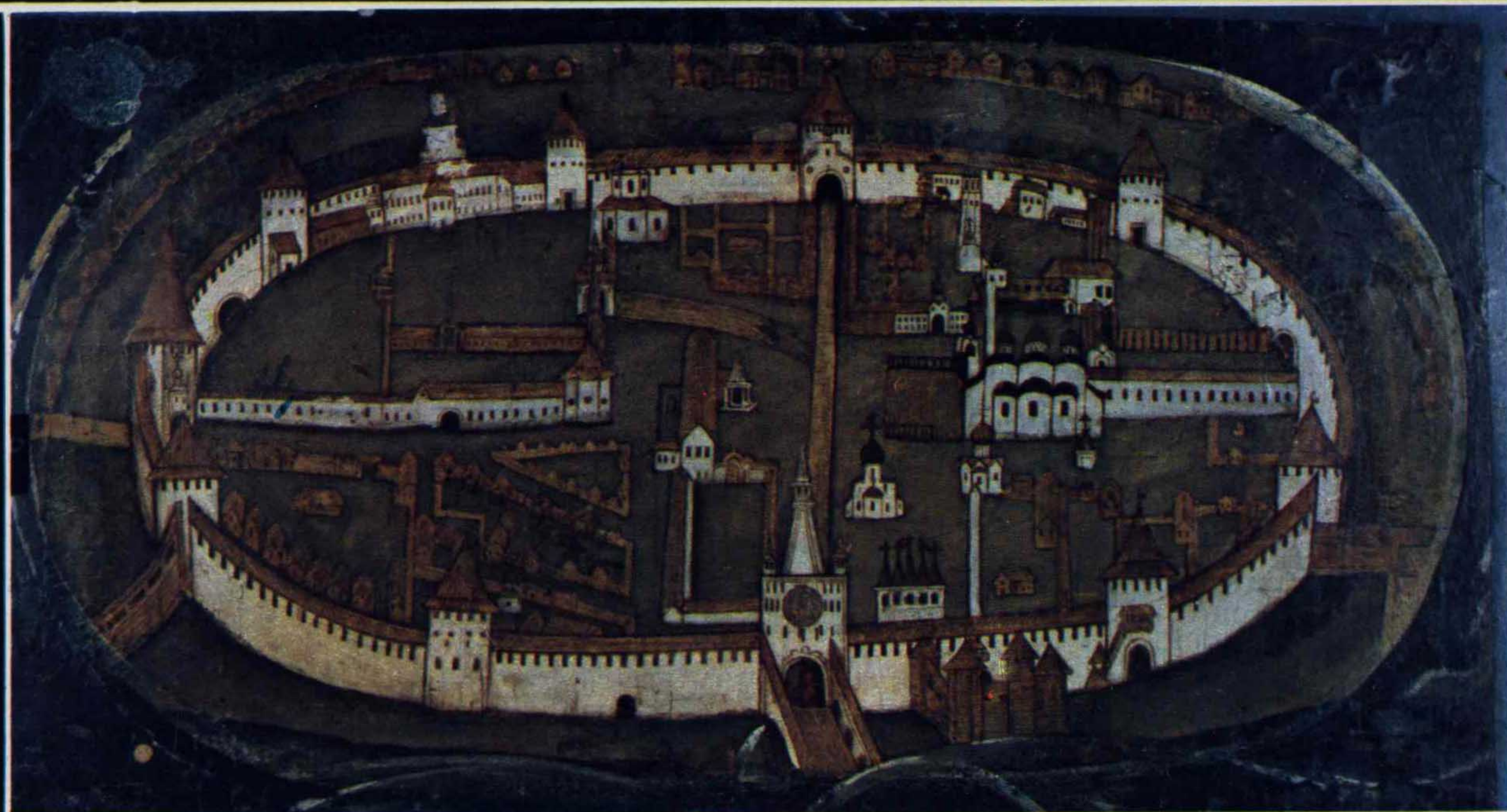
Фрагмент иконы. План древнего кремля.

МЫ ВОЗМУЩАЕМСЯ ТЕМ, ЧТО ПРОИЗОШЛО С НАШИМИ ГОРОДАМИ, С НАШИМИ ИСТОРИЧЕСКИМИ ПАМЯТНИКАМИ. НО ВОЗМУЩАЕМСЯ МЫ КАК-ТО КУСТАРНО. НУЖНО НАЧАТЬ НАУЧНОЕ ИЗУЧЕНИЕ ПОТЕРЬ, ПОДНЯТЬ АРХИВЫ, ВЫЯСНИТЬ, ЧТО ПРОИЗОШЛО? КАК ЭТО ПРОИСХОДИЛО? КТО УНИЧТОЖАЛ КУЛЬТУРУ НАРОДА? ЭТО НАУЧНАЯ ЗАДАЧА, А НЕ ПУБЛИЦИСТИЧЕСКАЯ.