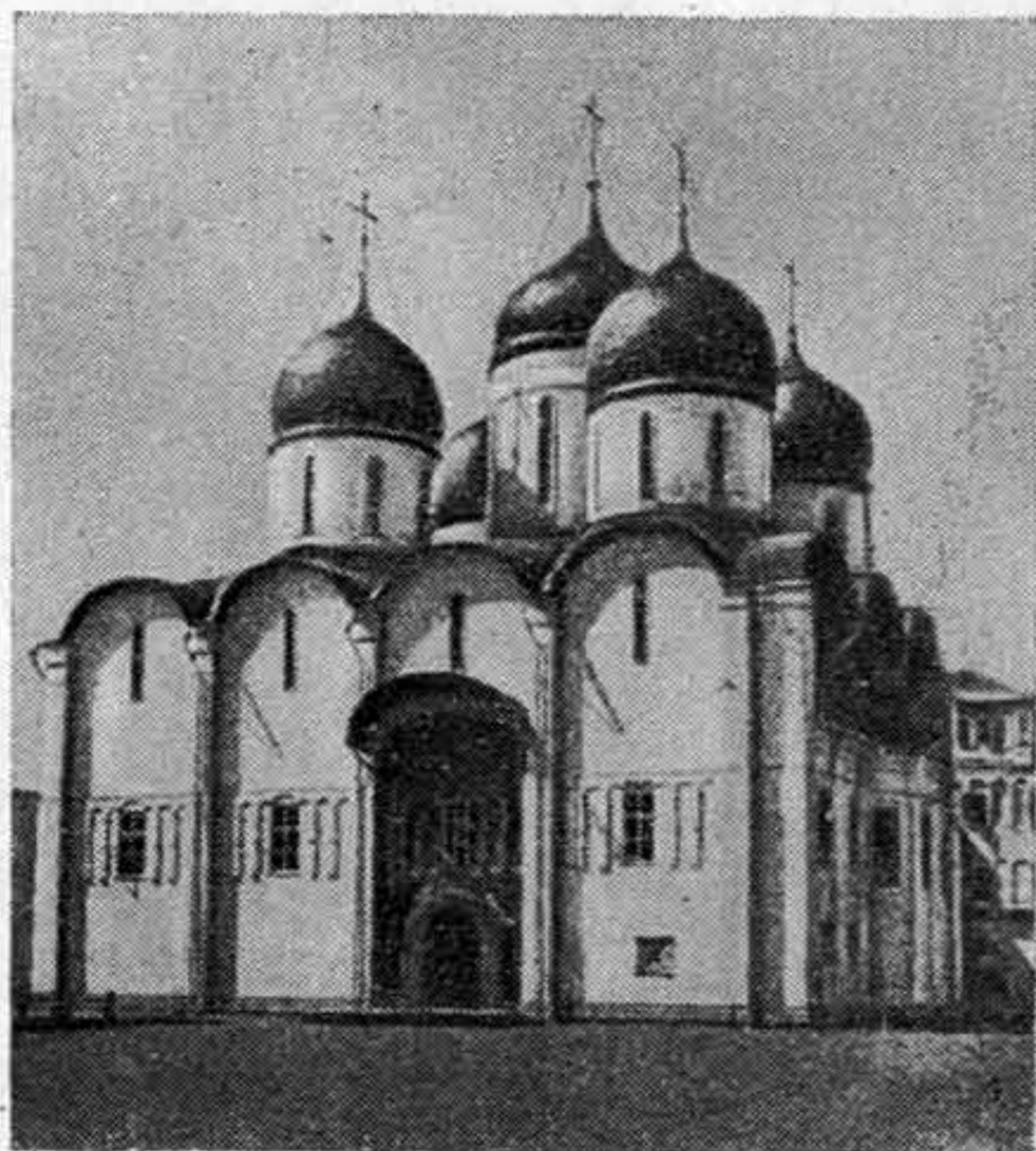
Успенский собор в Москве. 1475—1479 годы.

укреплений Дмитрия Донского. Стены были построены по последнему слову фортификационного искусства, сделавшего в XV веке большой шаг вперед в связи с развитием огнестрельного оружия. Были устроены рвы, пруды для воды, тайники, двойные и тройные стены, подъемные мосты. Вооружение состояло из многочисленной артиллерии, в которой имелись и громадные бомбарды, не уступавшие отлитой в 1488 году «царь-пушке». В XV веке Московский кремль был сильнейшей крепостью Европы, уступая лишь Миланскому замку, законченному постройкой в 1459 году. Замечательно при этом, что Московский кремль стал образцом для крепостного строительства русских городов. Черты Московского кремля отразились в стенах Нижегородского кремля, в укреплениях Серпухова, Тулы, Зарайска и многих других. Москва не только объединила в себе строительные традиции отдельных областей, но в свою очередь оказала обратное воздействие на искусство периферии.