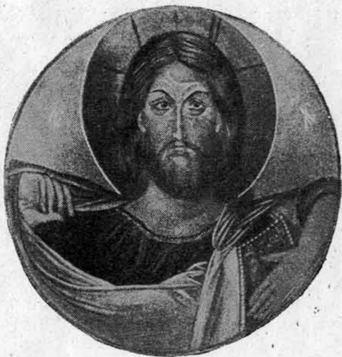
Пантократор XI века в куполе новгородской Софии, с которым связана легенда, появившаяся в XV веке, о судьбе Новгорода.

конца новгородской независимости. В Новгороде в атмосфере обреченности, усугублявшейся еще ожиданием конца мира в 7000 (1492) году, в период новгородских походов Ивана III, множились грозные «знамения». С падением Новгорода многие из таких «знамений» задним числом истолковывались как предвестники поражения новгородцев на Шелони и конца новгородской независимости. Так например к известию 1435 года о падении только что отстроенной церкви позднейший летописец дал такое примечание: «И се знамение покажется, яко хощет власть Новгородских посадник и тысяцких и всех бояр и всея земли новгородские разрушиться» 1 . Постепенно эти мелкие «знамения» превращались в многочисленные и пространные легенды, связанные с концом новгородской воли. «В нашей истории, — говорит В. Ключевский, — не много эпох, которые были бы окружены таким роем поэтических сказаний, как падение новгородской вольности. Кажалось, «господин Великий Новгород», чувствуя, что слабеет его жизненный пульс, перенес свои думы с Ярославова двора, где замолкал его голос, на св. Софию и другие местные святыни, вызывая из них предания старины» 2 .