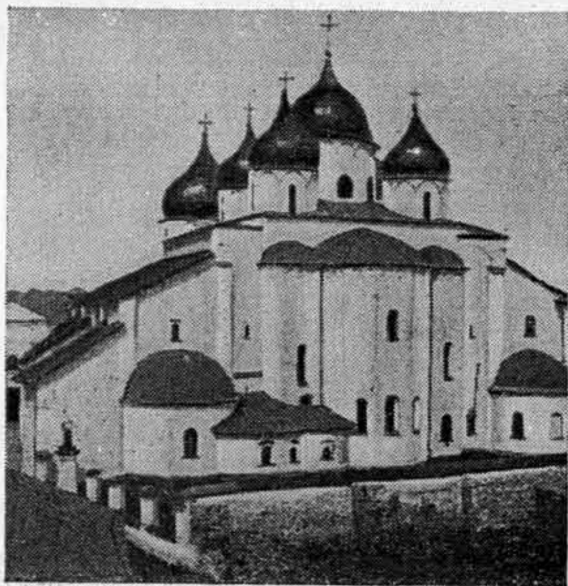
София новгородская. 1045—1052 годы.

Итак, рассматривая легенды о конце Новгорода, нельзя не заметить, что некоторые из них сочувственно, а другие