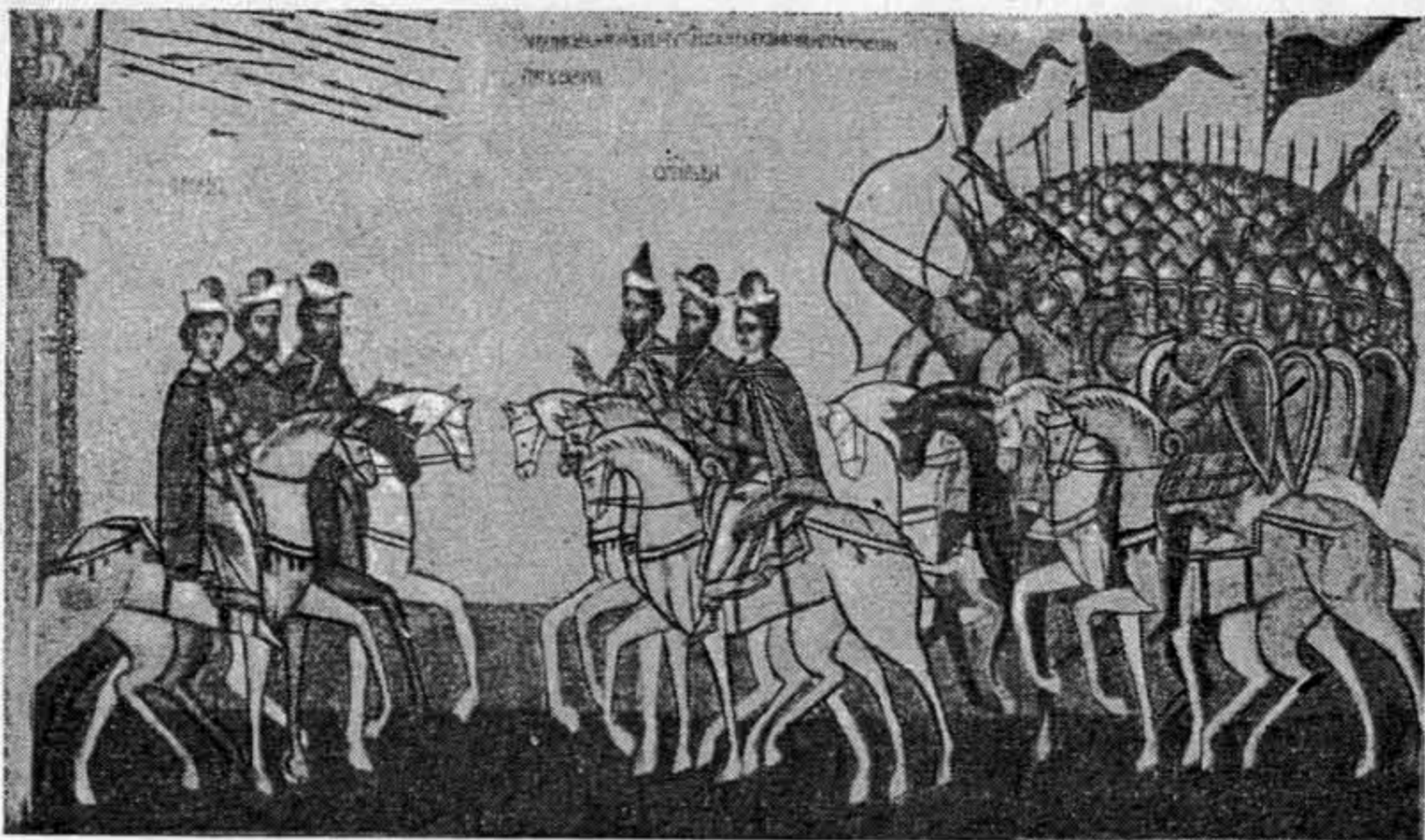
Деталь иконы XV века «Битва суздальцев с новгородцами», иллюстрирующей легенду о «чудесном» спасении Новгорода.

«Софийский Временник», который должен был дать новую историческую концепцию, поставив в центр русской истории историю Великого Новгорода. Однако вскоре после составления «Софийского Временника» в Новгороде стал ясен и его основной недостаток, не позволявший ему конкурировать с обширными московскими летописными сводами начала XV века. В то время как московское летописание было в подлинном смысле этого слова общерусским, объединяло в своем составе известия самых разнообразных областей и освещало историю всего русского народа в целом, новгородский «Софийский Временник» по составу своих известий оставался все же летописью узко новгородской. Поэтому при том же Евфимии II в 1448 году в Новгороде было предпринято составление нового летописного свода.