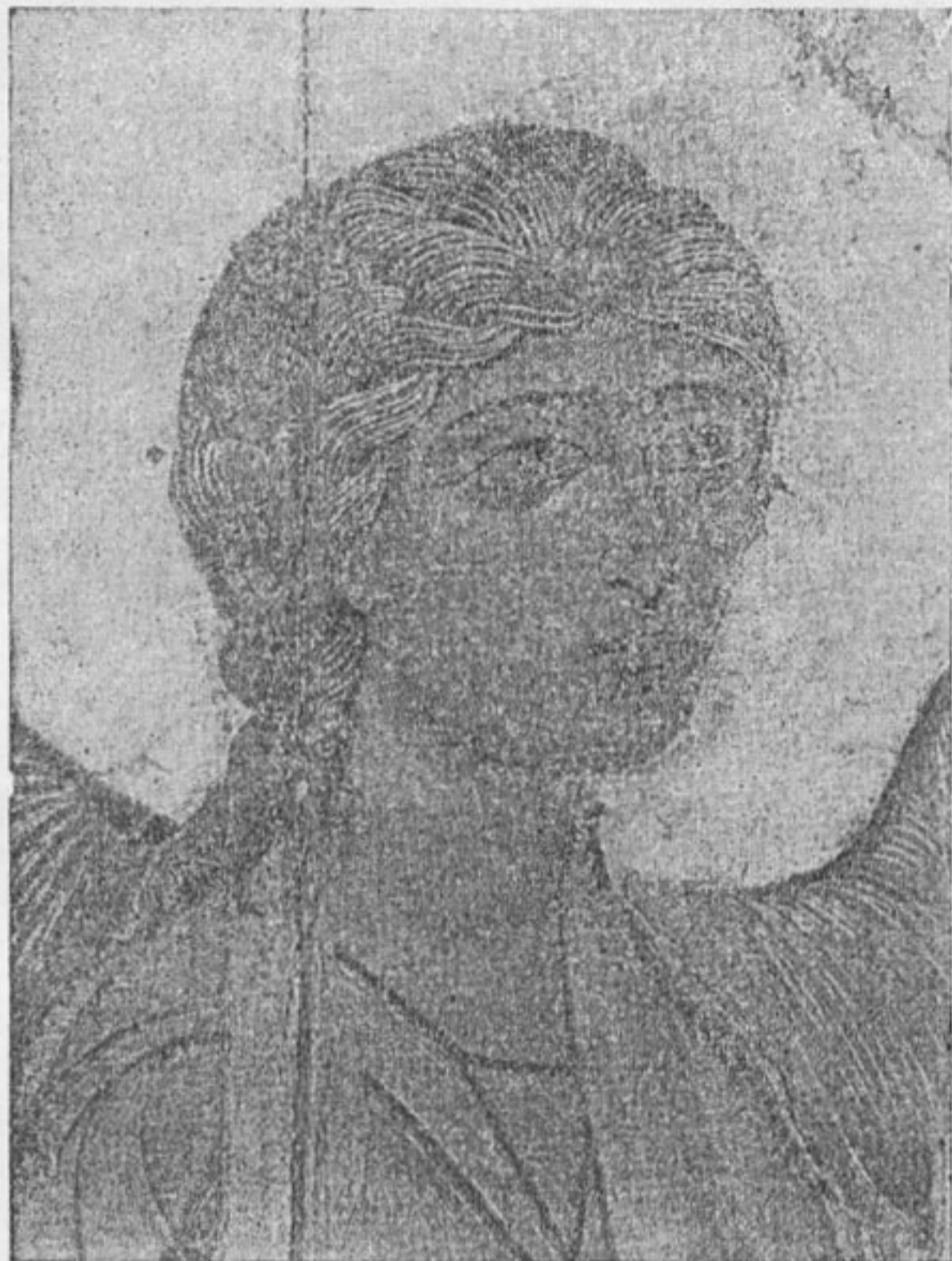
Архангел из иконы Устюжского благовещения, XII—XIII вв. Деталь.