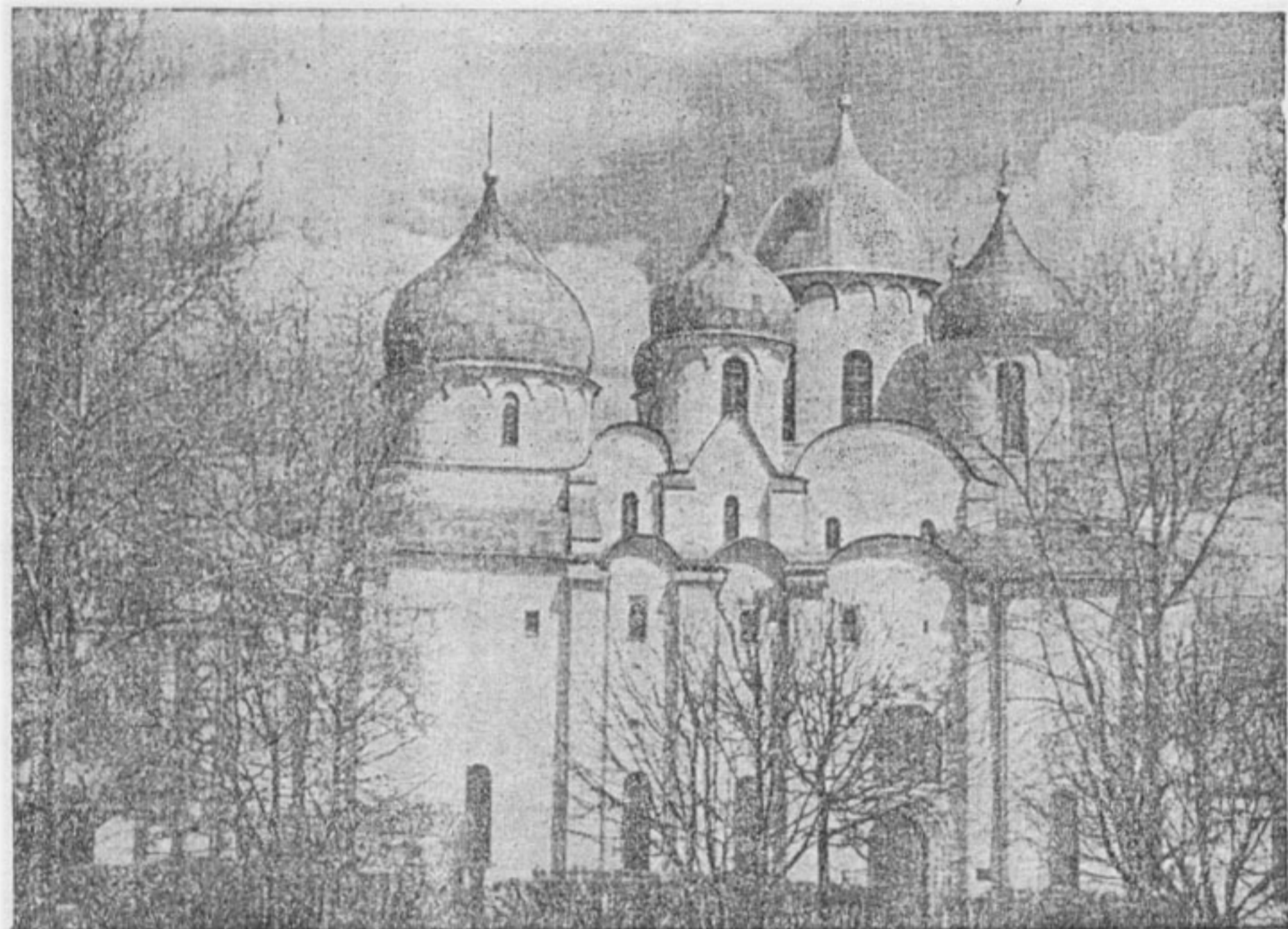
Софийский собор Новгородского кремля, XI в.

Эти первые русские строители, воздвигая храмы и дворцы в сложных византийских традициях, вносили в свои создания местные технические усовершенствования, стремились отразить свои местные вкусы, приспособляли здания к местным условиям.