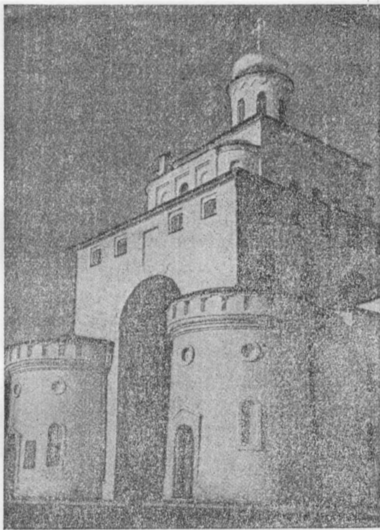
Золотые ворота во Владимире, 1164 г.

Мудрого — сохранился черниговский собор Спаса (1036 г.), выстроенный братом Ярослава — Мстиславом, знаменитый храм Софии в Киеве (1037 г.), храм Софии в Новгороде (1045—1050 гг.). Во второй половине XI в. строится собор Софии в Полоцке, храм Михаила в Выдубицком монастыре под Киевом и некоторые др. Все эти сохранившиеся до наших дней храмы свидетельствуют о богатой строительной технике, которой обладала Русь уже в XI в. Мозаики, фрески, наборные полы Софии в Киеве и Софии в Новгороде дают ясное представление о богатстве их внутреннего убранства. Помимо храмов, в Киеве сохранились остатки каменных Золотых ворот; археологи нашли фундаменты княжеских дворцов и крепостных стен. По остаткам земляных валов времени Владимира и Ярослава мы можем судить о быстром росте Киева, а восстанавливая его планировку — о великолепии парадных въездов в Киев, о его площадях и торжищах. По сведениям летописи, на Бабином торжке в Киеве стояли «четыре коне медяны» (медная