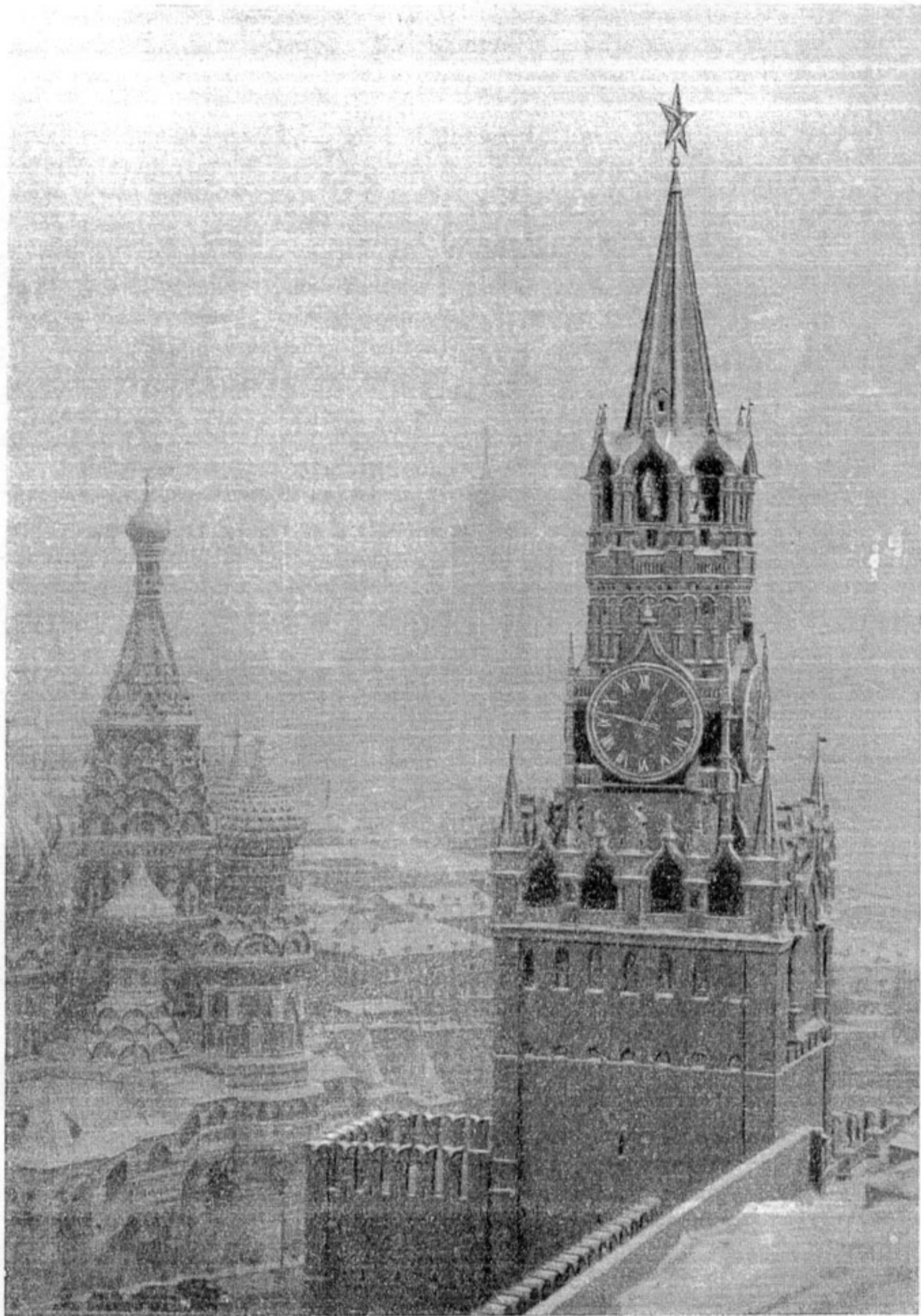
150. Московский Кремль