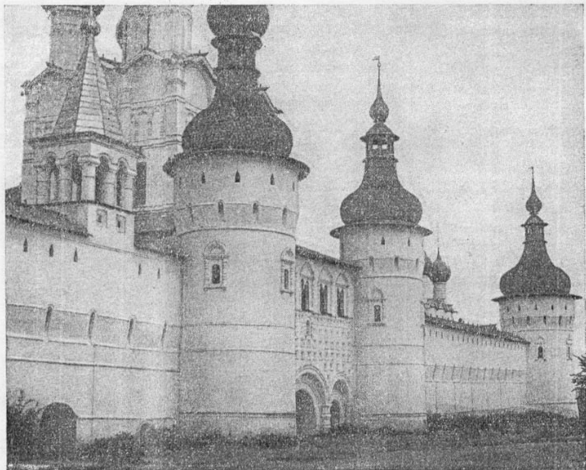
Ансамбль Ростовского кремля. Вторая половина XVII в.

XVII в. принадлежит к лучшим произведениям русской архитектуры и пользуется всемирной известностью: церковь Ильи Пророка (1647—1650 гг.), Иоанна Златоуста в Коровниках (1649—1654 гг.), Иоанна Предтечи в Толчкове (1671—1687 гг.). Наряду с другими волжскими церквями ярославские постройки XVII в. замечательны соединением монументальности с жизнерадостным разнообразием декоративного убранства. Многоцветные росписи их внутри сочетаются с многокрасочной отделкой снаружи.