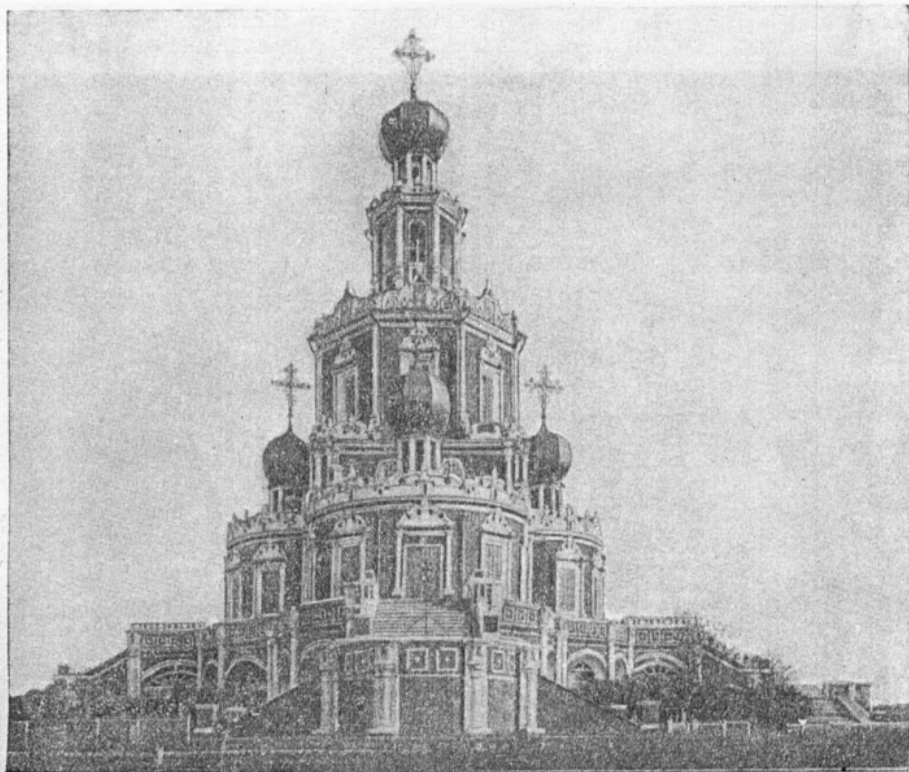
Церковь Покрова в Филях под Москвой, 1693 г.

Аналогичные противоречия мешали дальнейшему развитию и живописи. Трудная, негибкая техника иконописи, хорошо отвечавшая потребностям условного средневекового искусства, не могла отвечать новым требованиям, предъявляемым к живописи во второй половине XVII в. Между тем жизнь толкала русских иконописцев к реальной передаче внешнего мира. Перенесение в иконопись линейной и воздушной перспективы, светотени, введение