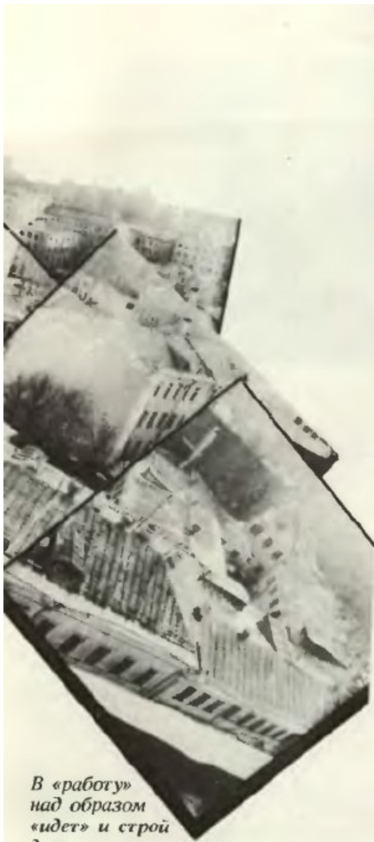
В «работу» над образом «идет» и строй домов, и скат крыши, и проем окна, и лепнина фасада, и дерево в сквере.