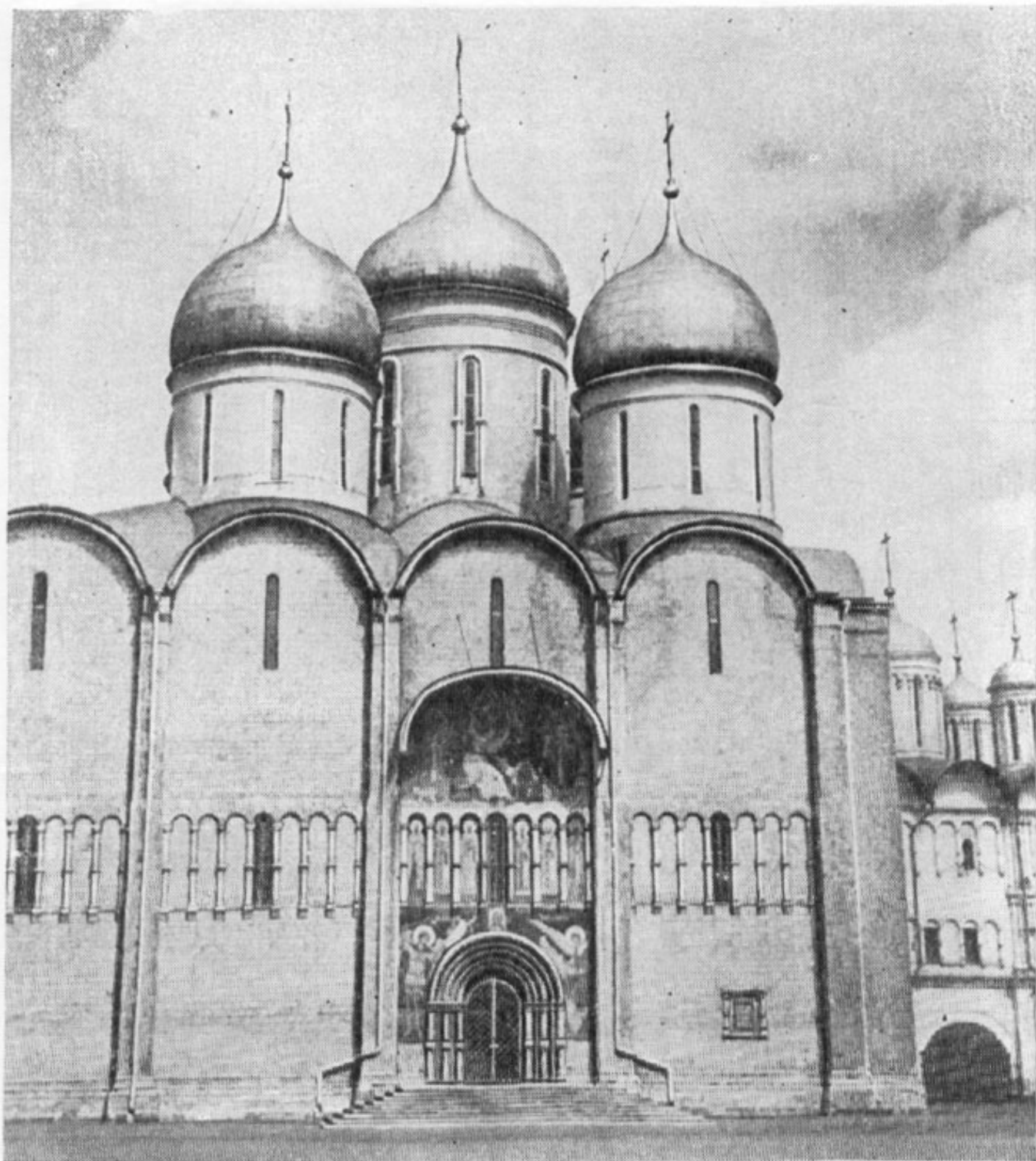
Успенский собор в Московском Кремле, 1475—1478 гг.

главого русского храма и другие чисто русские архитектурные черты. Это был храм-«усыпальница». Сюда перенесли гробницы всех великих князей начиная с Ивана Калиты, и здесь хоронили всех русских царей до Петра I.