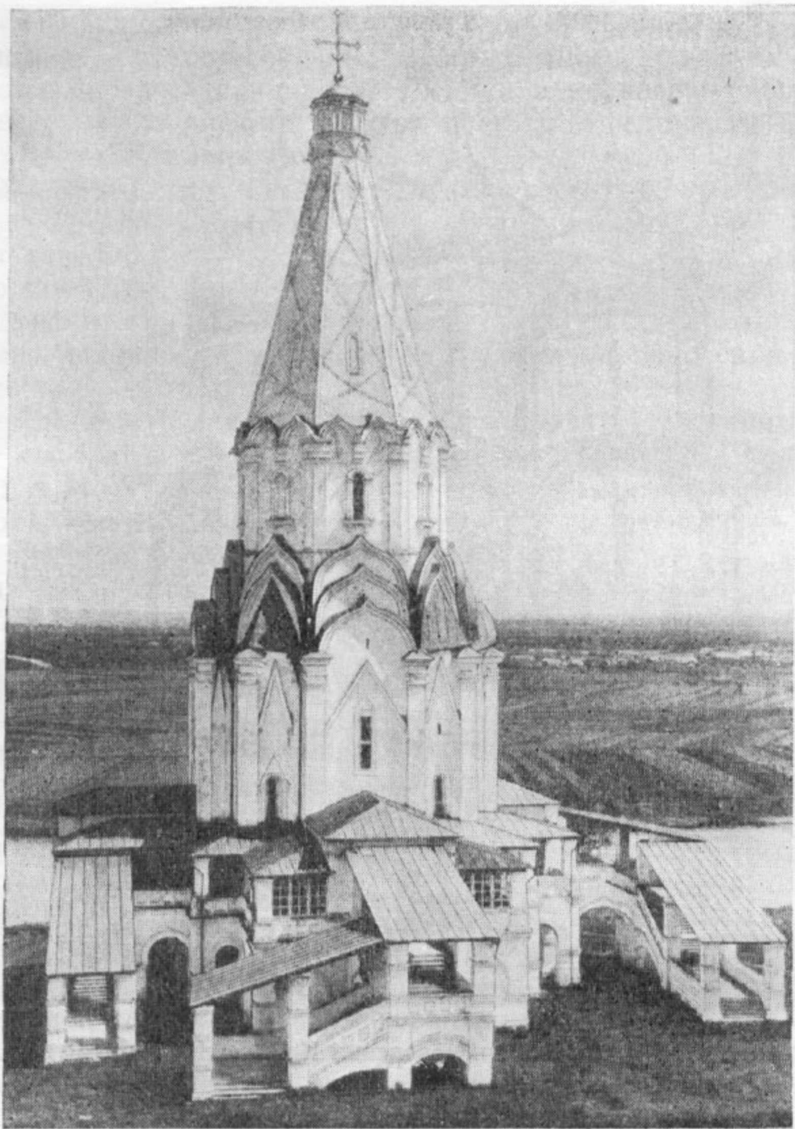
Церковь Вознесения в с. Коломенском под Москвой, 1532 г.

разнородных частей в одно целое. Между тем для русского архитектурного ансамбля характерно именно последнее. Это не система чистых пропорций, а живописное сочетание архитектурных объемов. Кремль тесно связан с его местоположением: высокий холм, плавно огибаемый реками Неглинной и Москвой, по берегам которых протянулись его мощные укрепления. Из-за суровых стен Кремля вздымались кверху жизнерадостные русские золотые купола, пестрые маковки, затейливые и разнообразные кровли кремлевских теремов. Русский архитектурный ансамбль легко включает и подчиняет себе резко противоположные формы. Вот почему кремлевский ансамбль продолжал органически развиваться и после своего создания — в XVI, XVII вв. К итальянским стенам