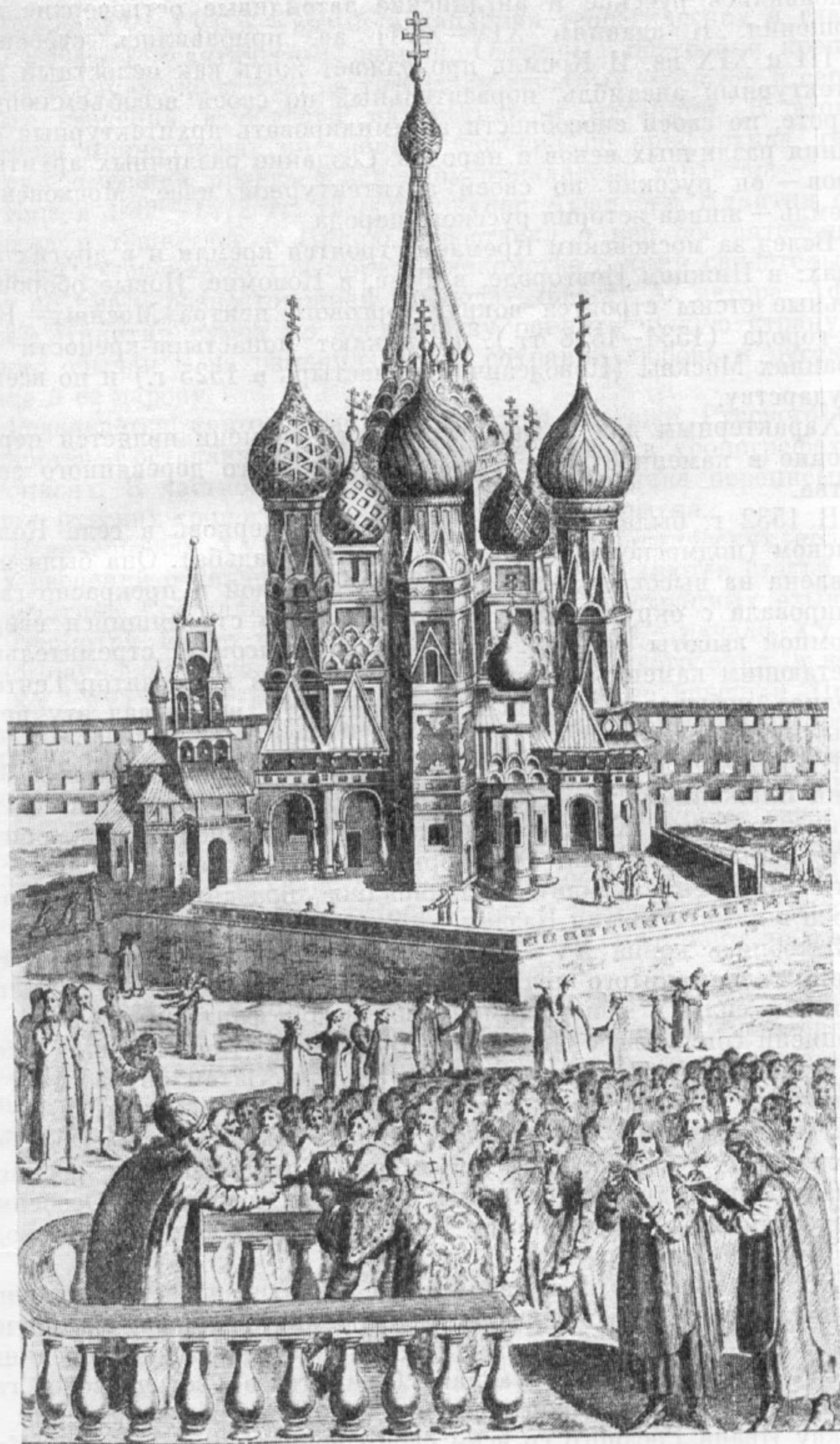
Собор Василия Блаженного, 1555—1560 гг. Гравюра начала XVIII в.