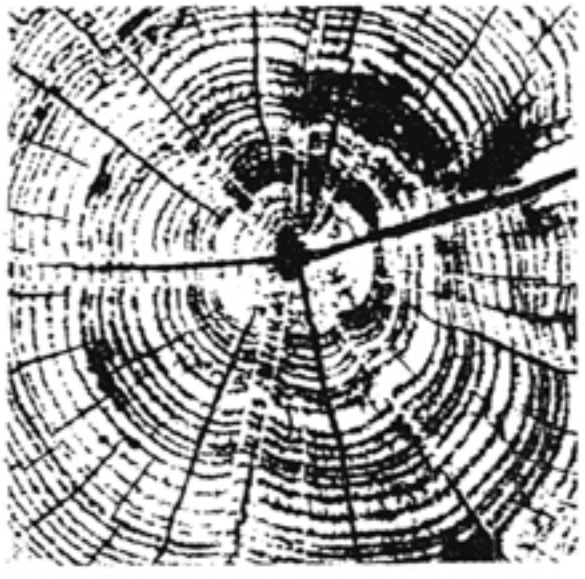
Д. Лихачев, академик