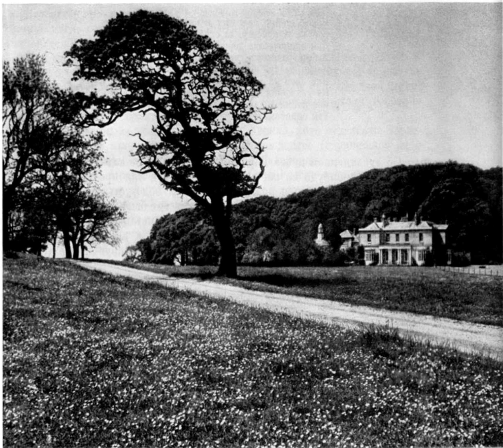
Старое дерево в парке Шерингам Холла, конструировавшемся Хамфри Рептоном.

вершине «парнаса» (здесь оно было даже обязательно) — романтической формы эрмитажа, среди поляны, на берегу вод (тут играло свою роль и его отражение) или, если дерево было старым, то в тесном окружении молодых деревьев, особенно ценилось в эпоху Романтизма.