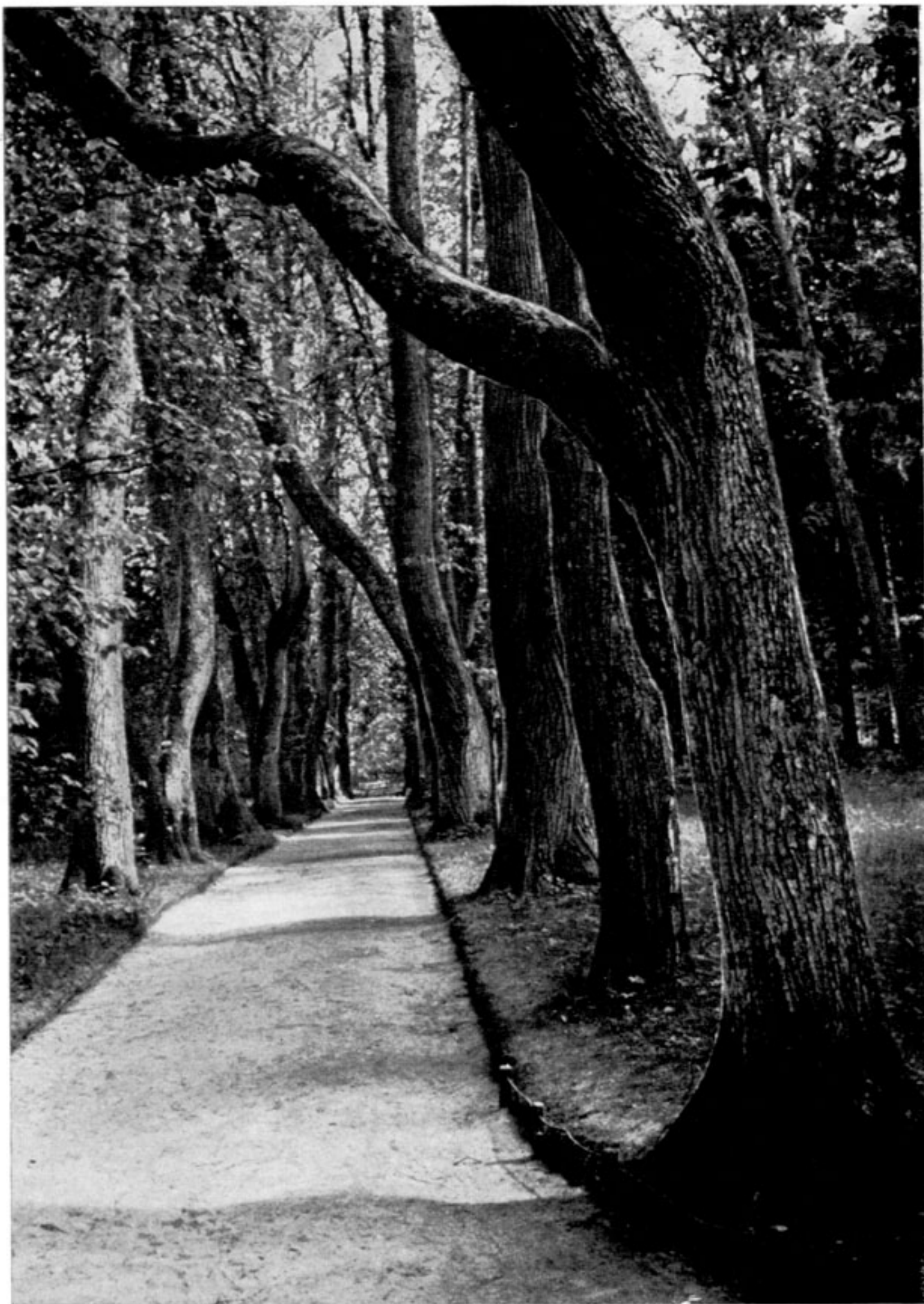
«Аллея Керн» в селе Михайловском Пушкинского заповедника. Современный вид.