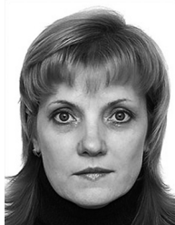
© Рыжова Наталья Ивановна Ryzhova N. I.

НОУ ВПО «Санкт-Петербургский гуманитарный университет профсоюзов». Россия, 192238, Санкт-Петербург, ул. Фучика, 15. E-mail: nata-rizhova@mail.ru