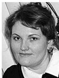
© Ставцева Ольга Ивановна Stavtseva O. I.

НОУ ВПО «Санкт-Петербургский гуманитарный университет профсоюзов». Россия, 192238, Санкт-Петербург, ул. Фучика, 15. E-mail: nata-rizhova@mail.ru