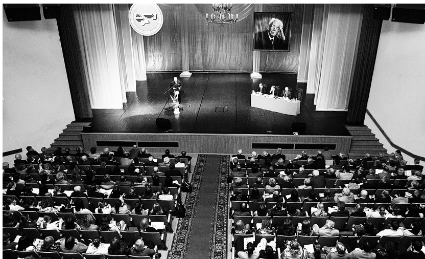
Открытие XIII Международных Лихачёвских научных чтений

В этих условиях как никогда становится актуальной необходимость межкультурного диалога между государствами и поиск способов формирования единого культурного пространства, интеграции культур народов, проживающих как в России, так и за рубежом, в том числе, и в странах СНГ. Плодотворно способствовать этому процессу может реализация в социокультурных сферах жизнедеятельности современного общества научных идей академика Дмитрия Сергеевича Лихачёва. Ведь именно творческое наследие Д. С. Лихачёва сегодня, по мнению научной общественности, является тем концептуальным ресурсом, задействуя который, можно интегрировать достижения представителей самых различных областей науки и современного гуманитарного знания, культуры, политики в целях осмысления процессов, происходящих в современном обществе.