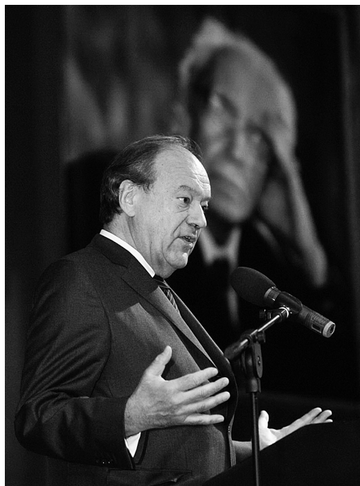
Пленарное заседание. Выступает президент Европейской академии наук и искусств Ф. Унгер (г. Зальцбург, Австрия)

с герменевтическим кругом Х.-Г. Гадамера, немецкий ученый выявляет взаимозависимость цивилизаций в диалоге культур, т.к. последний является условием мира и стабильности, что и делает возможным сам диалог. Реализовать себя цивилизация может только во взаимодействии с другой культурой, т. е. цивилизации в диалоге культур взаимозависимы. В основе диалога культур должны лежать универсальные метанормы, которые являются формальными и определяют диалог, но одновременно представляют собой ценности. Таковы принципы толерантности и взаимного уважения. Культурное и цивилизационное сознание является частью сообщества, в которое включаются различные культуры на основе равенства и взаимного уважения. Таким образом, диалог культур, подчеркивающий своеобразие и уникальность каждой культуры, ее право на развитие согласно собственной культурной логике, все-таки является культурным проектом, т.к. утверждает глобальность как систему открытого взаимодействия культур. Важно видеть, подчеркнул Г. Кехлер, что глобаль-