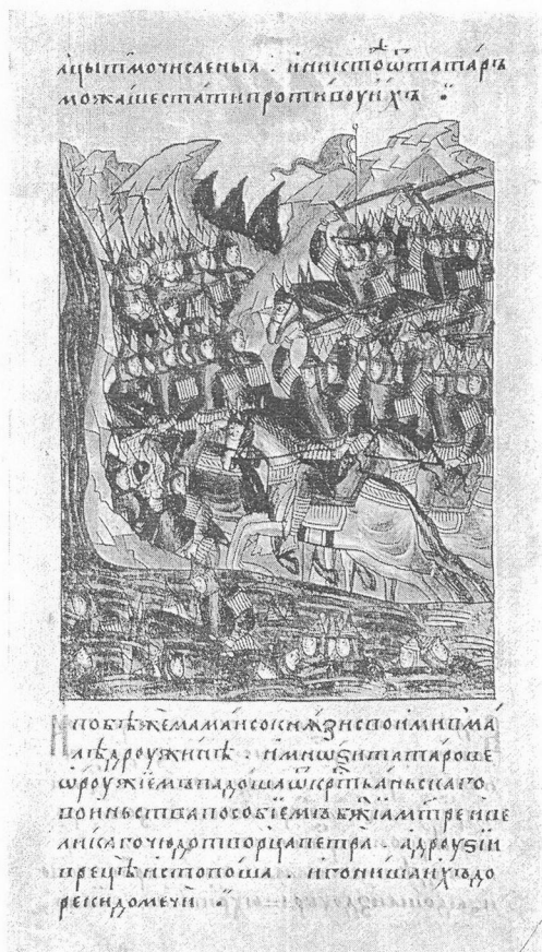
Победа над Мамаем

Победа на Куликовом поле еще более подняла значение