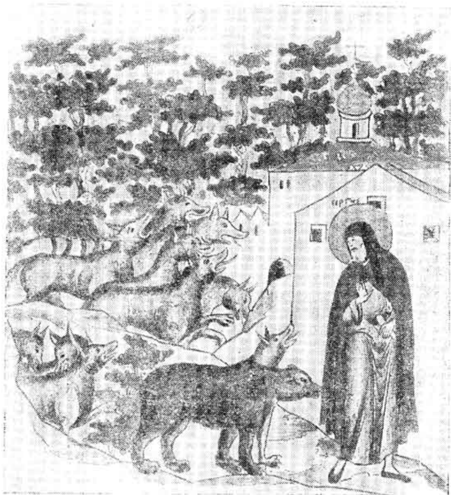
Келья Сергия в лесу Миниатюра из жития Сергия

Сами святые обычно в XIV и следующих столетиях изо-