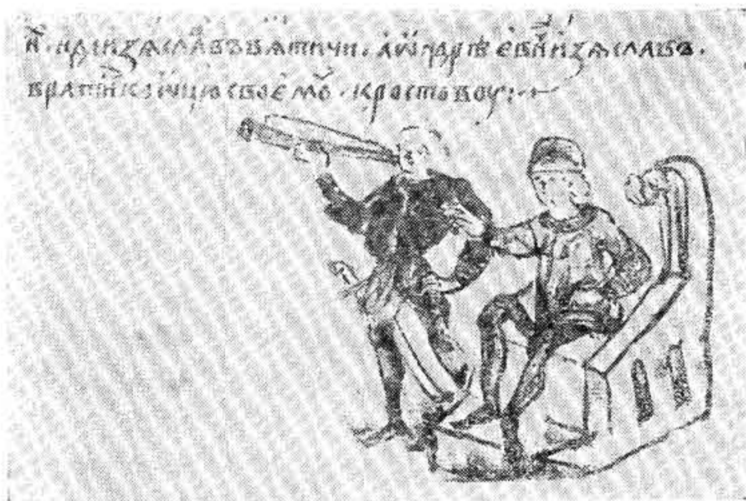
Князь и трубач Деталь миниатюры Радзивилловской летописи

Вот любопытное сатирическое изображение московского щёголя начала XVI в. в одном из поучений митрополита