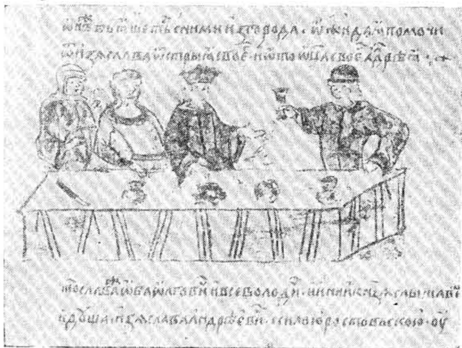
Пир Миниатюра Радзивилловской летописи

Женитьба, рождение ребёнка, крестины и пр. не рассматривались только как события личной, замкнутой жизни. Обыкновение жить широкой семьёй приводило к объединению различных семейных празднований: братья и близкие родичи справляли вместе крестины, свадьбы и т. д. Так, например, московская летопись рассказывает под 1345 г.: «Того же лета князь великий Семен женился