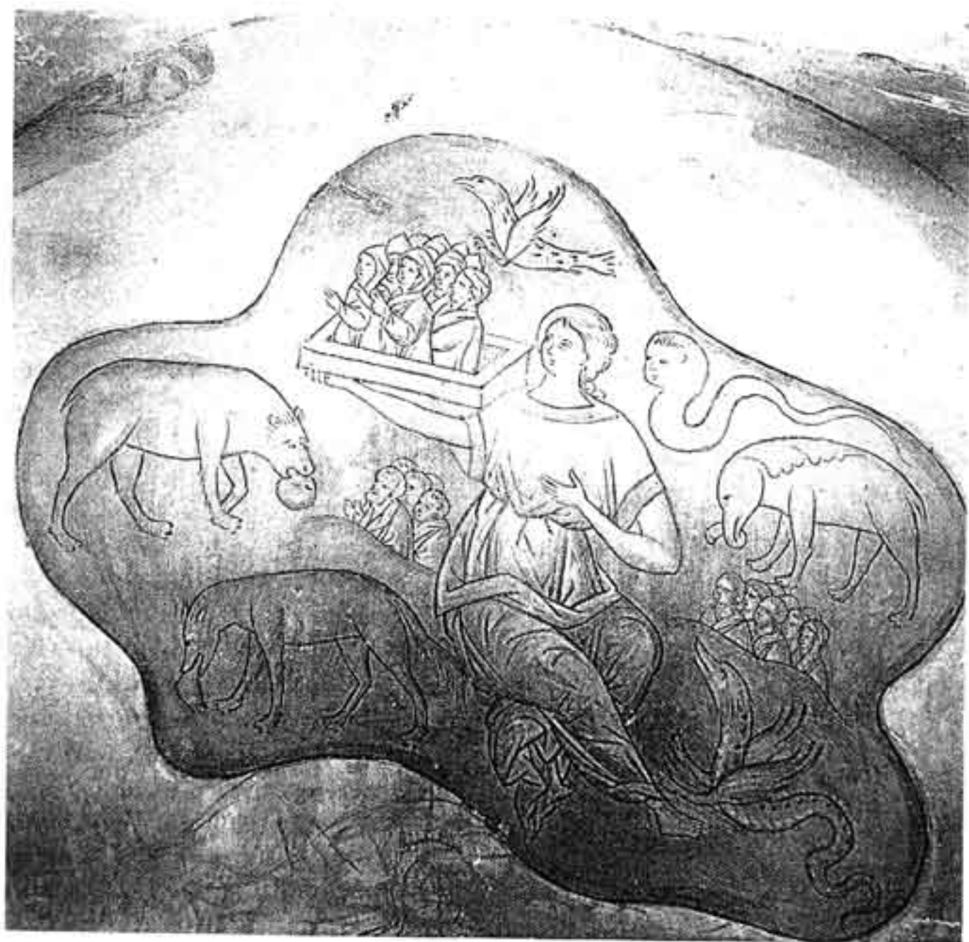
Земля и животные приносят тела умерших на Страшный суд. Фрагмент фрески Рождественского собора Феропонтова монастыря. 1502

степенях свободы человека. Поэтому-то Бог открывается только тем, у кого вера в него достигает уверенности знания, т. е. только святым.