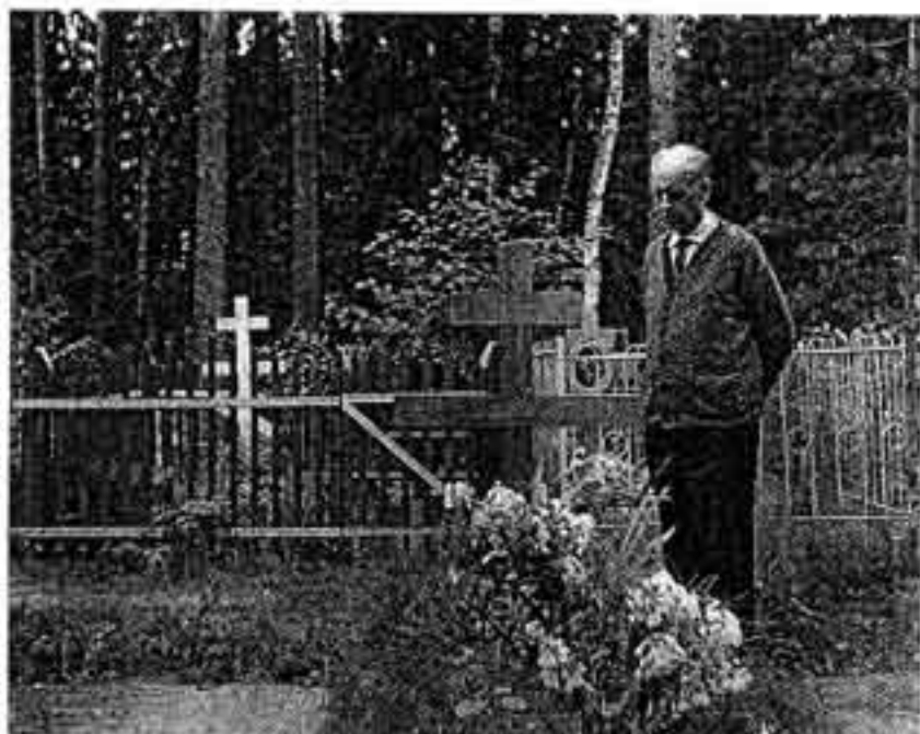
Д. С. Лихачев в Комарове у могилы А. А. Ахматовой. 1967

ственные требования, – она и наиболее верная. Но при этом необходимо учитывать и национальные традиции, национальные уклады, так как гайка охватывает болт.