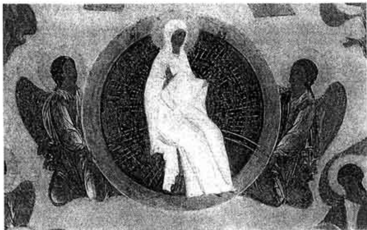
Дионисий. Фрагмент иконы "Успение Богоматери". Нач. XVI в. Музей им. Андрея Рублева

Как это возможно? И что значат слова Апокалипсиса: "Времени больше не будет"?