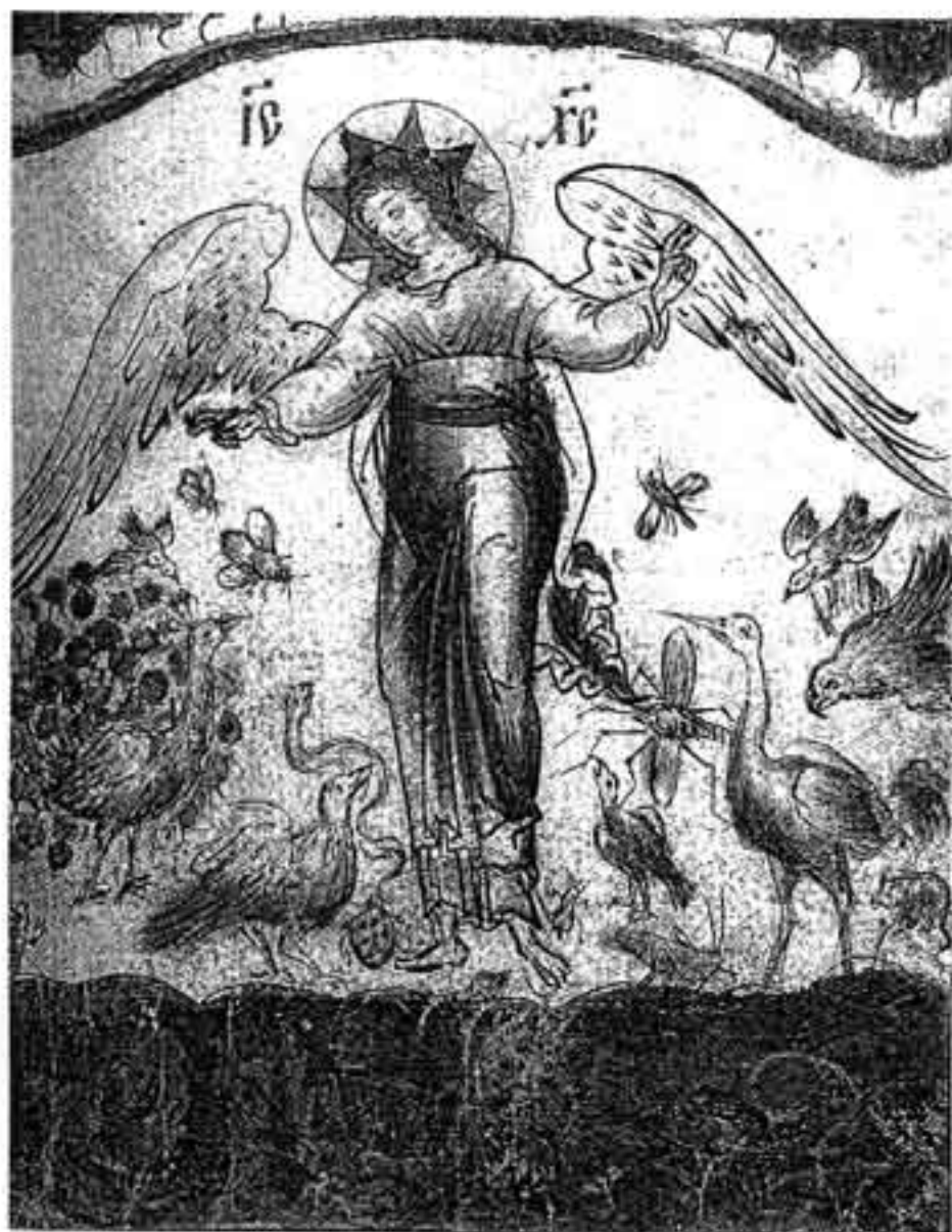
Пятый день творения. Миниатюра из сборника Древлехранилища Пушкинского Дома. XVII в.

В романах Достоевского действует другая человеческая психология, обнажен нравственный мир и пр. Особая роль принадлежит поэзии, вводящей нас в особый ассоциативный мир.