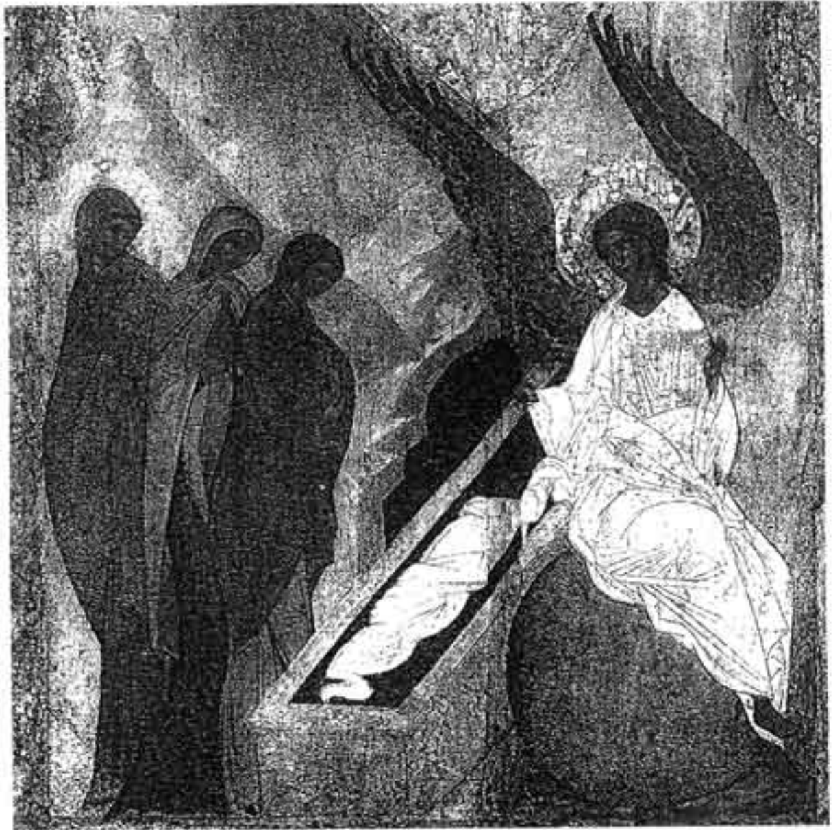
Андрей Рублев. Явление ангела женам-мироносицам. Икона Троицкого собора Троице-Сергиева монастыря. XV в.

конец которой приходит, но еще не наступил, может разрушить мир. И хочет это разрушение приблизить. Своего рода “воля к самоубийству”. Бог не хочет этого и приоткрывает завесу над проблемой Своего существования. Явление свое в науке, в Туринской плащанице, изучаемой учеными, т. е. явившейся именно сейчас ученым, науке в первую очередь, – это последняя попытка вернуть людей и мир к жизни, спасти его от самоубийства, сделать людей еще более ответственными за свои ужасные поступки. Да будет Воля Твоя!