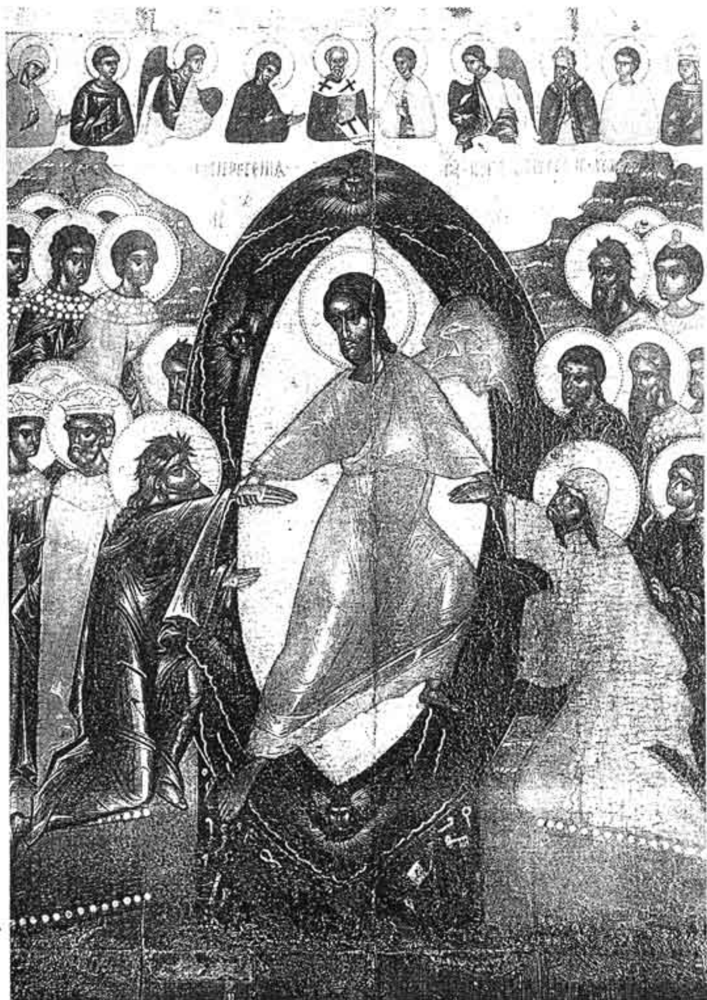
Сошествие во ад. Икона. Псков, XIV в. Государственный Русский музей