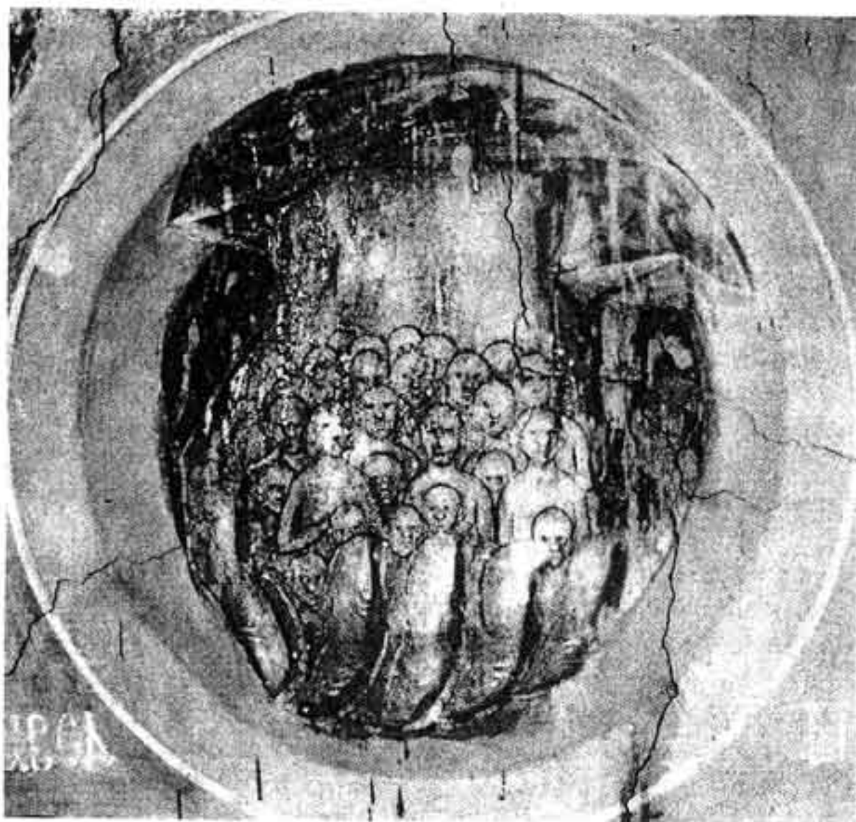
“Души праведных в руце Божьей”. Фреска церкви Успения на Волотовом поле в Новгороде. Ок. 1380 г.

повелевающую песню меди, и каждому хотелось бы поближе к волшебному пробиться трубачу. Из тех резных ворот, открытых настежь, выходят люди весело и шумно, но в их толпе меня теперь уж нет. Зачем не можем мы одновременно быть там и здесь, всегда и всюду, где клокочет жизнь могуче и бескрайно? Мы непреодолимо умираем, вседневно умираем, исчезая оттуда и отсюда – отовсюду, пока совсем не сгинем наконец.