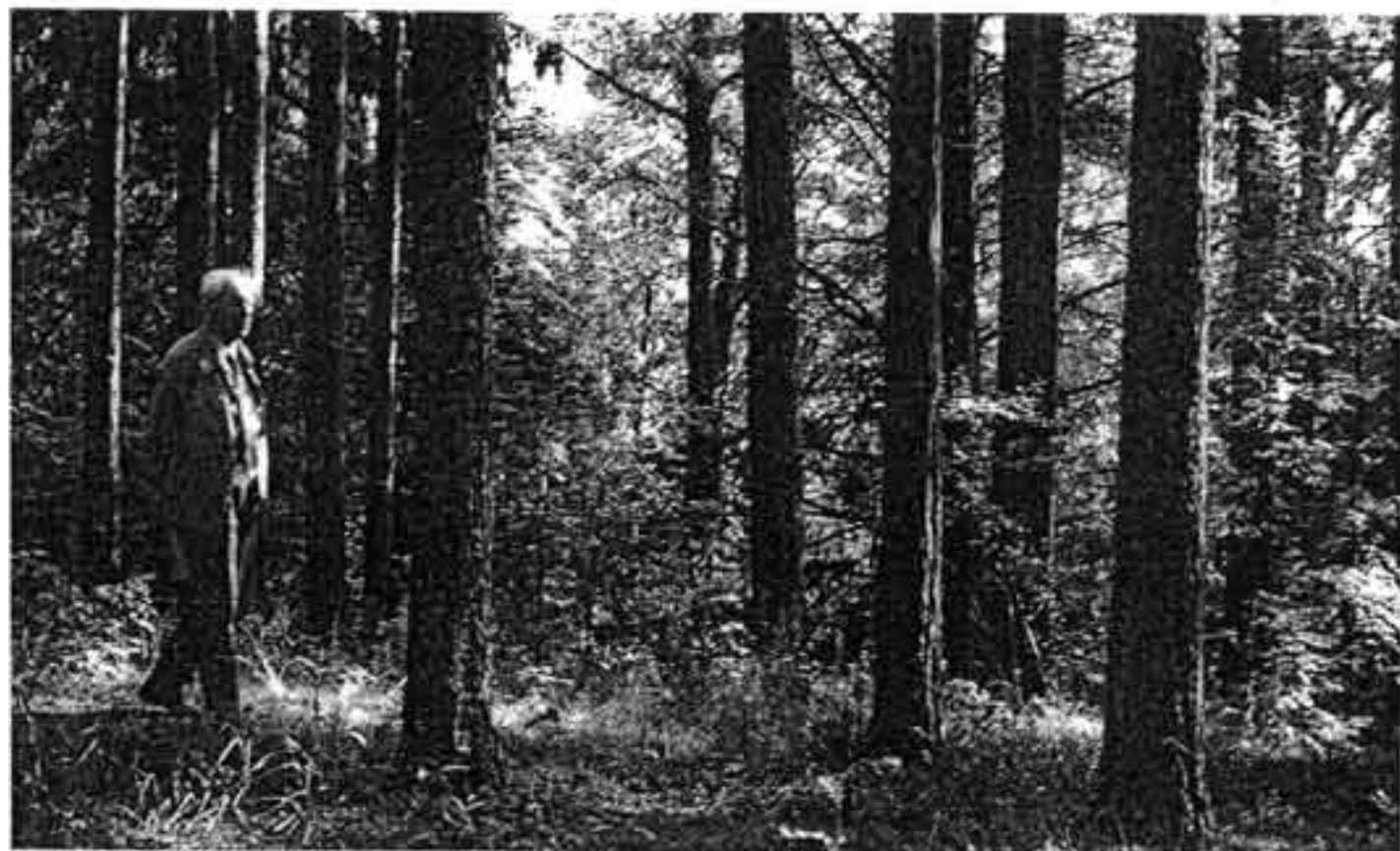
Д. С. Лихачев в Комарове. 1980-е гг.

Ранним утром 26 марта (четверг) 1998 года я услышал ясно: “Скоро пойдём дальше!” Голос был громкий, как бы внутри меня. Я был в полусне . Я не сразу понял, что это значит, потом догадался.