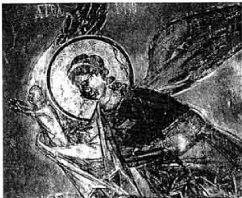
Ангел несет душу умершего к душам праведных. Фреска церкви Успения на Волотовом поле. Ок. 1380 г.