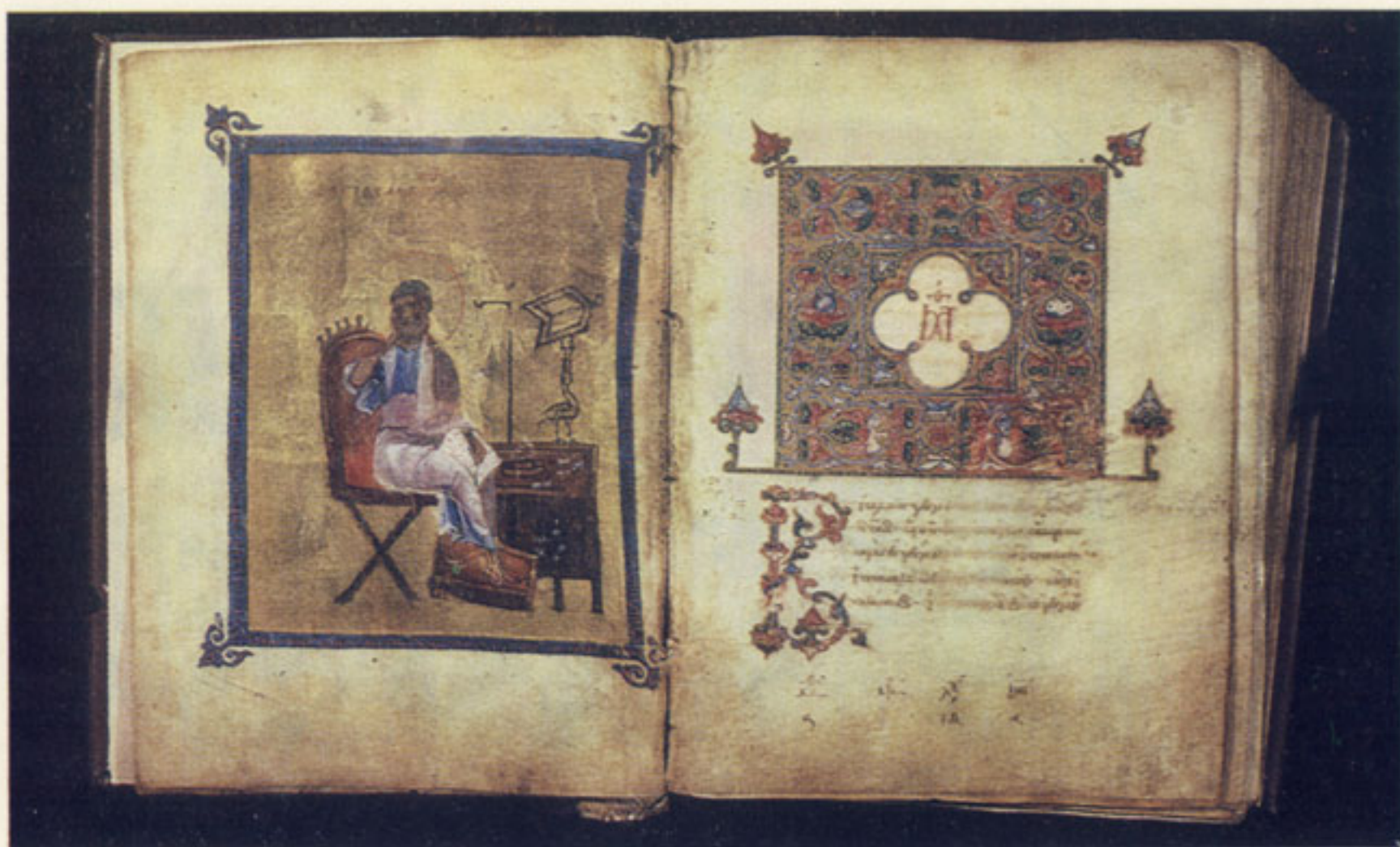
119. Евангелист Матфей и лист с заставкой к Евангелию от Матфея. Евангелие. XI в. Гос. Публичная библиотека, греч. 801, л. 2 об. — 3. Фон миниатюры составлен из золотых листочков разных форм и размеров. Текст на листе с заставкой написан золотыми чернилами