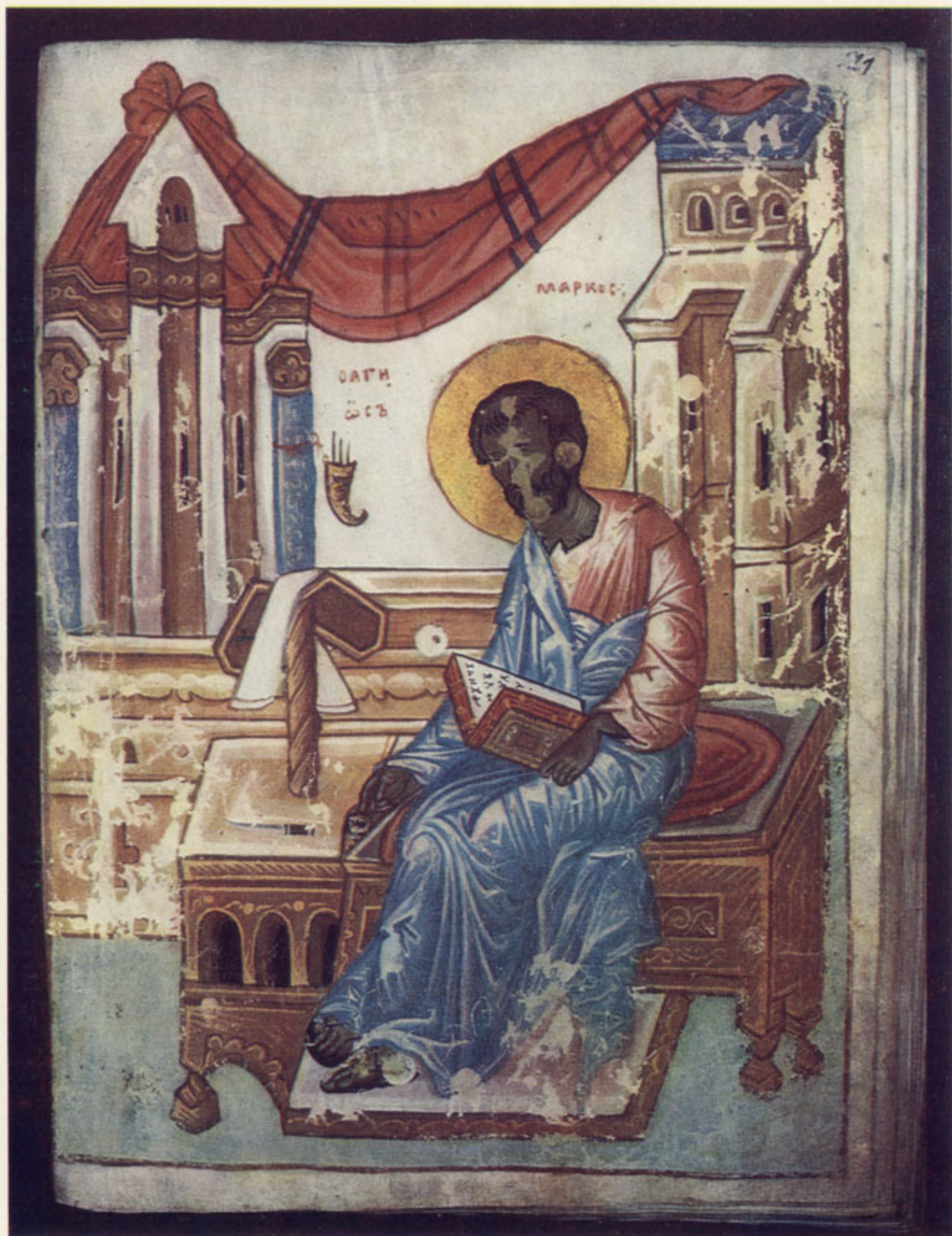
122. Евангелист Марк. Евангелие. XIV в. Гос. Исторический музей, Хлуд. 30, л. 129. Осыпи пастоозного красочного слоя; осыпавшиеся участки круглой формы получились от восковых натеков