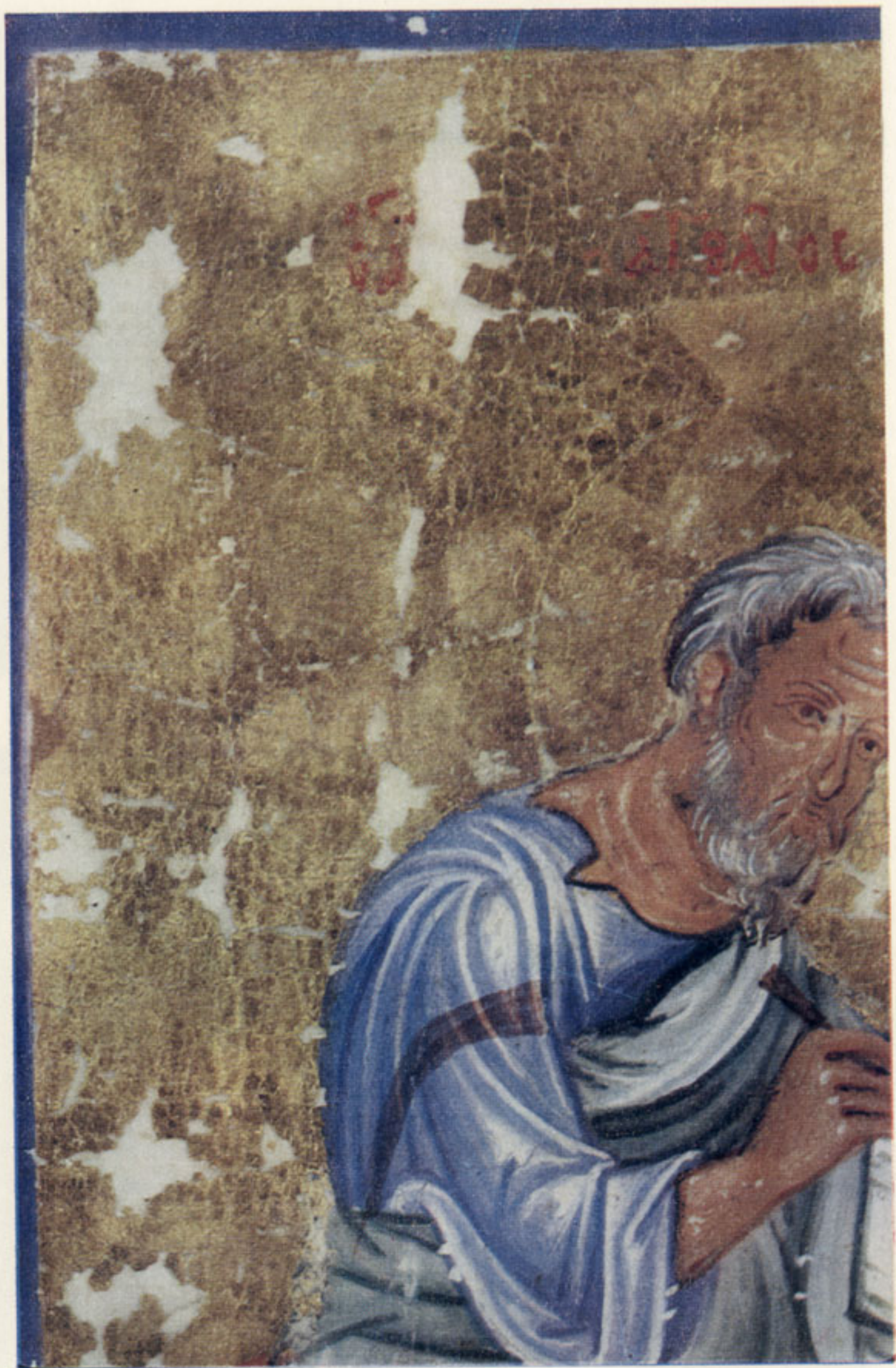
125—127. Евангелист Матфей. Евангелие. XI в. Гос. Публичная библиотека, греч. 67, л. 21 об. Общий вид миниатюры после реставрации;

фрагмент миниатюры до реставрации. Шелушение золотого фона; тот же фрагмент после реставрации