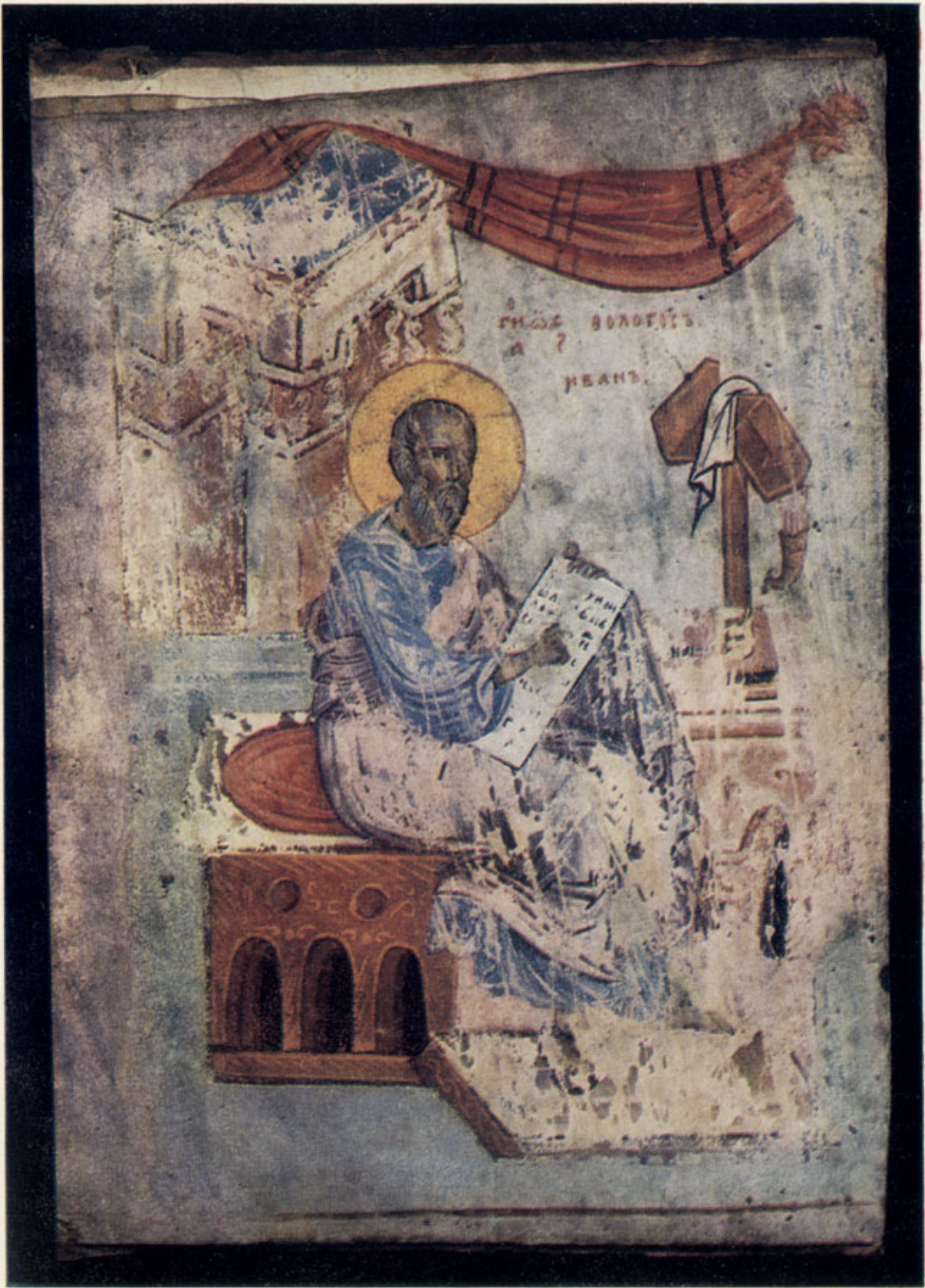
121. Евангелист Иоанн. Евангелие. XIV в. Гос. Исторический музей, Хлуд. 30, л. I об. Краски типа гуа- ши, смешанные с белилами, нало- жены пастоным слоем, легко осыпаются с пергамента