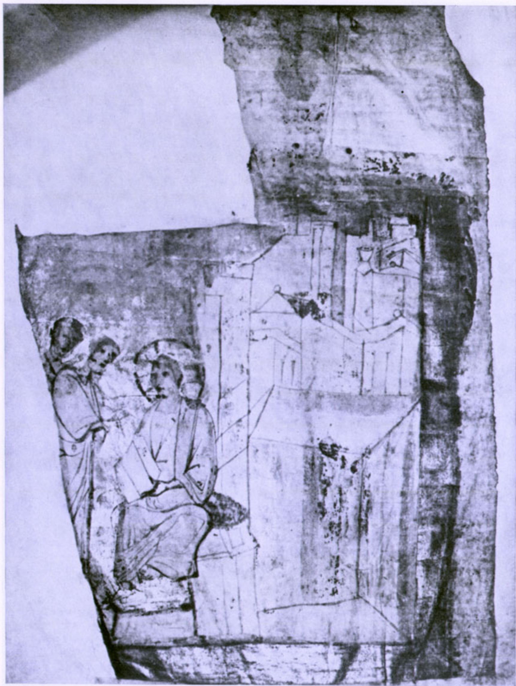
117. Христос и два апостола. Трапезундское евангелие. X в. Гос. Публичная библиотека, греч. 21, л. 11 об. Полностью осыпавшийся красочный слой. Доклейки листа, сделанные новым пергаменом в XIX в.