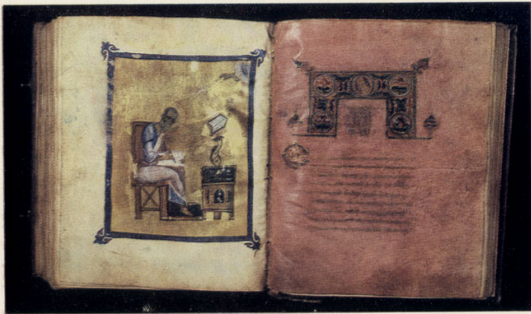
120. Евангелист Иоанн и лист с заставкой к Евангелию от Иоанна. Евангелие. XI в. Гос. Публичная библиотека, греч. 801, л. 200 об. — 201. Фон миниатюры составлен из отдельных мелких золотых листочков. Текст написан на пергамене, окрашенном в пурпур, золотыми чернилами