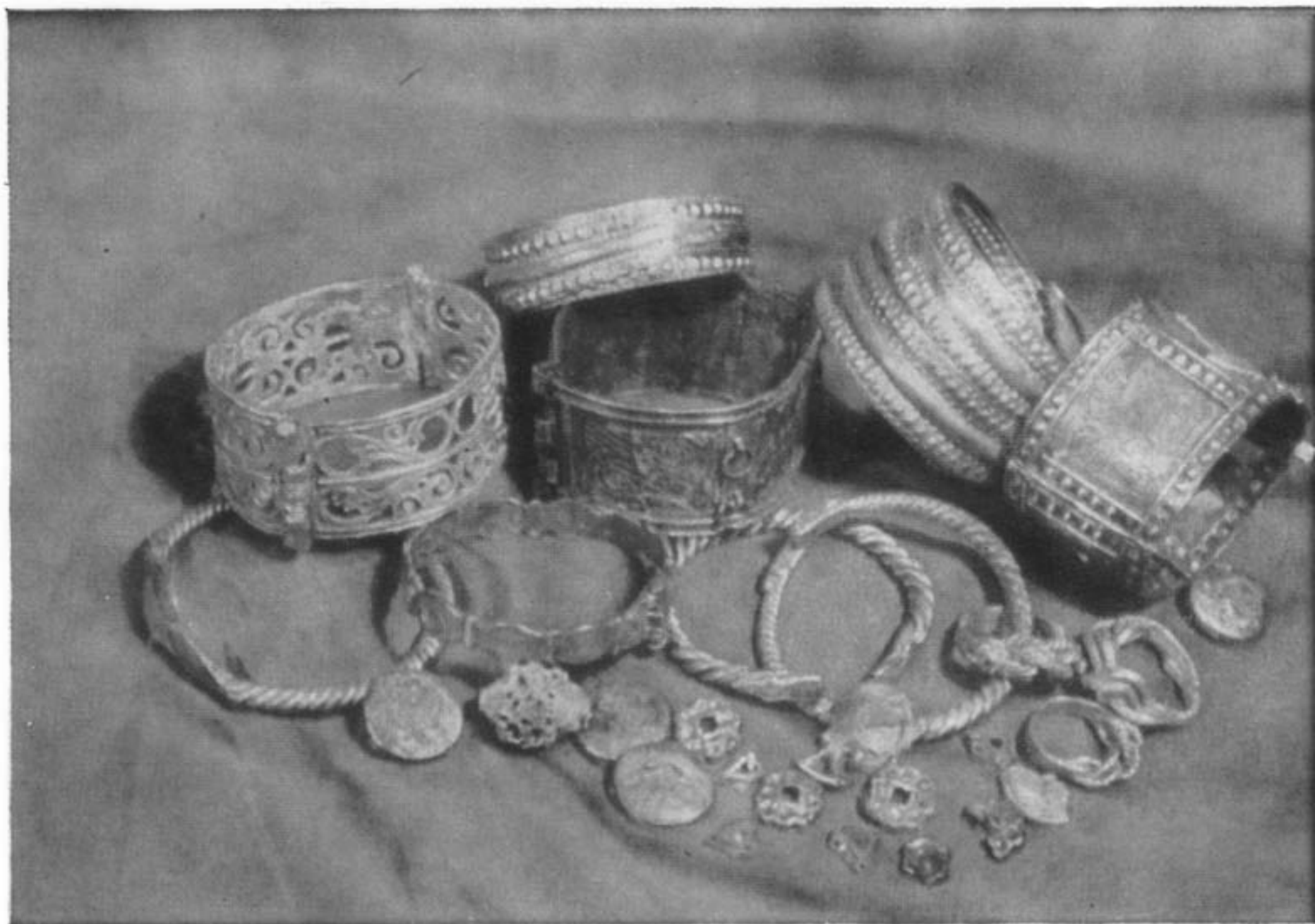
Золотые и серебряные вещи из тайника Любечского замка. XIII в.