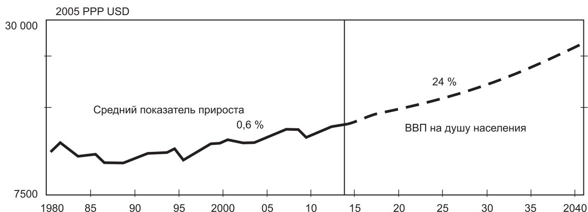
Рис. 2. Реформы способствуют экономическому росту