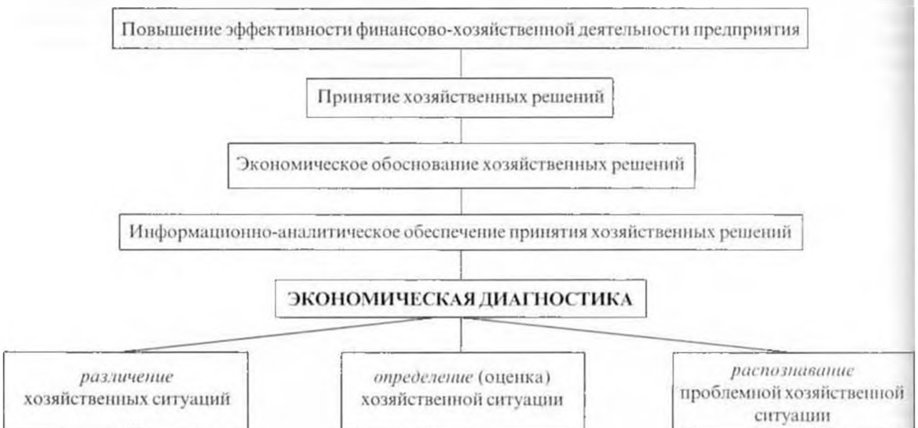
Рис. 1 Место и роль диагностики в повышении эффективности управления

Место диагностики в управлении характеризует иерархия функций информационно-аналитического обеспечения хозяйственных решений, представленных на рисунке 1.