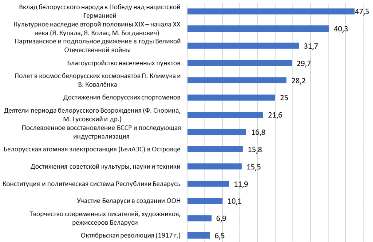
Рис. 1. Исследование «Восприятие исторического прошлого населением Беларуси в контексте формирования национально-государственной идентичности», ГНУ «Институт социологии НАН Беларуси» (2022 год)

Что из перечисленного можно назвать предметом национальной гордости? (в % от числа опрошенных)