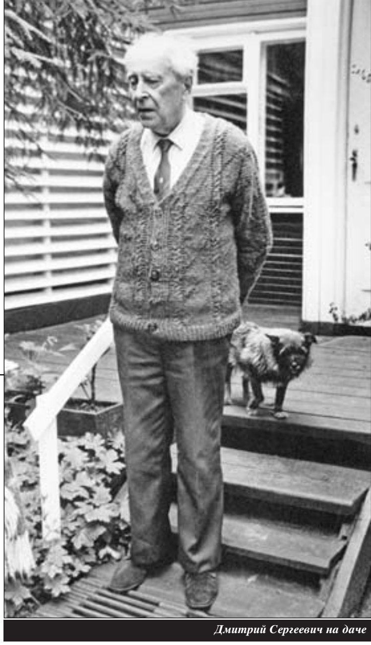
Дмитрий Сергеевич на даче

В выступлениях Д.С. Лихачёва настойчиво звучит мысль о том, что сопровождающий развитие личности прочный гражданский мир возможен только на основе культуры. Мир должен стать культуроцентричным. Вне