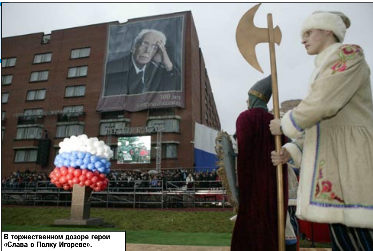
В торжественном дозоре герои «Слава о Полку Игореве».