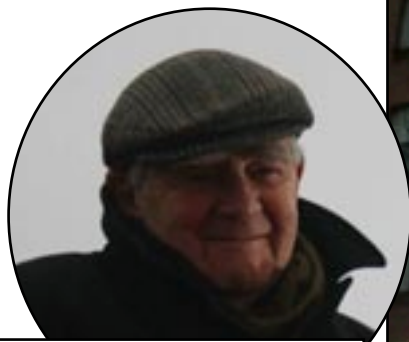
Даниил Гранин: «Таких личностей, как Лихачев жизнь рождает редко».

Не так давно Гранин с друзьями ездил на Соловки, чтобы найти другой памятник Дмитрию Сергеевичу - обычный камень в лесу. Много лет назад, сослан-