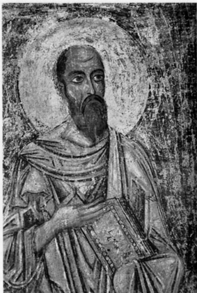
Апостол Павел. Фреска Софийского собора в Киеве. XI в.

литературным языком, принятым у болгар. И это делает несомненным громадное значение Болгарии в принятии христианства. Тем более что Болгария стояла на пути “из Варяг в Греки”, значение которого в принятии многонациональной религии подчеркивалось нами выше.