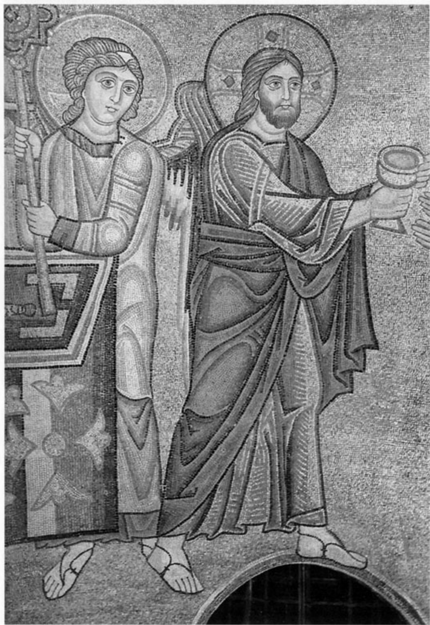
Евхаристия. Фрагмент мозаики из разрушенного Михайловского Златоверхого монастыря в Киеве. 1108–1113. Музей Киевского Софийского собора