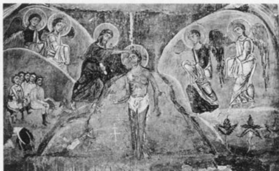
Крещение Господне. Фреска церкви Спаса Преображения на Нередице. 1199

вернуться к язычеству. Более того, Владимир по-своему понял христианство, даже отказывался казнить разбойников, заявляя: “...боюсь греха”.