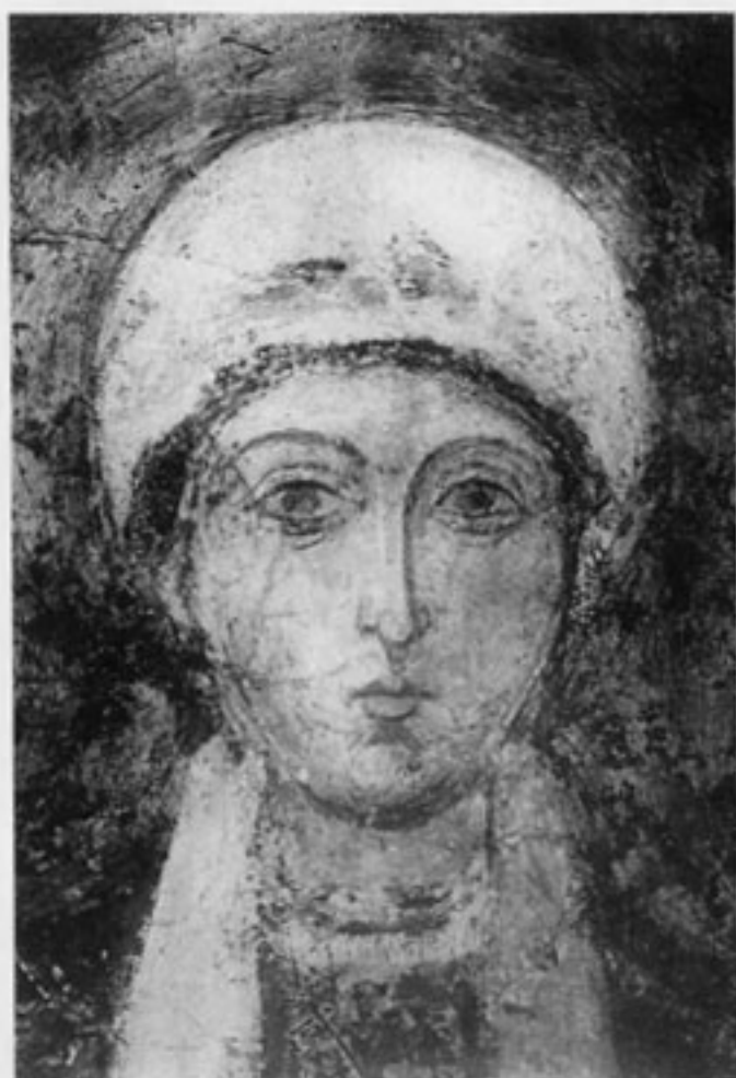
Елизавета, старшая дочь Ярослава Мудрого. Фреска Софийского собора в Киеве. XI в.

Христианизация Руси и родство правящего рода с византийским двором ввели Русь в семью европейских народов на совершенно равных основаниях. Сын Владимира Святославича Святополк женился на дочери польского короля Болеслава Храброго. Дочь Владимира Мария Доброгнева была выдана за польского короля. Ярослав Мудрый был женат на дочери шведского короля Олафа Ингигерде, его сын Изяслав – на Гертруде,