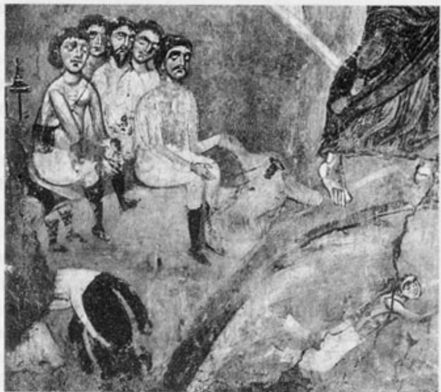
Крещение Господне. Фрагмент фрески церкви Спаса Преображения на Нередице. 1199

даже к врагу – все это оставалось и после принятия христианства и наложило особый отпечаток на рассказы о христианских подвижниках. В Изборнике 1076 года – книге, специально написанной для князя, который мог ее брать с собой в походы для нравоучительного чтения (об этом я пишу в особой работе), – есть такие строки: “...красота воину оружие и кораблю ветрила (паруса), тако и праведнику почитание книжное”. Праведник сравнивается с воином! Независимо от