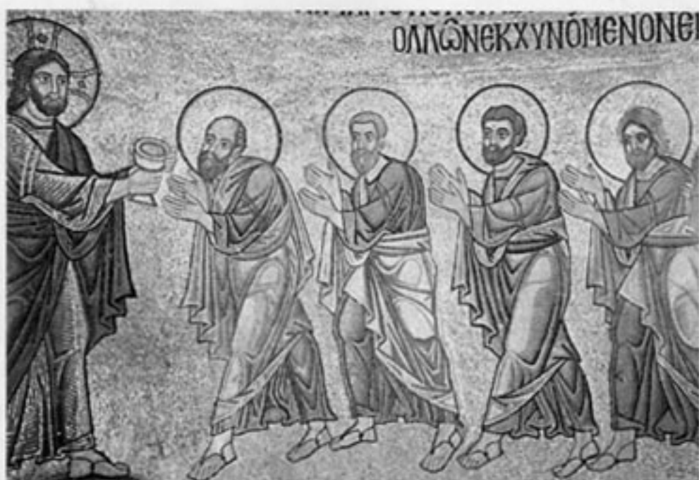
Причащение апостолов. Фрагмент мозаики Михайловского Златоверхого монастыря в Киеве. 1108–1113. Музей Киевского Софийского собора

прикладному искусству и по интенсивности исторической мысли, выраженной в летописании и работе над переводными хрониками.