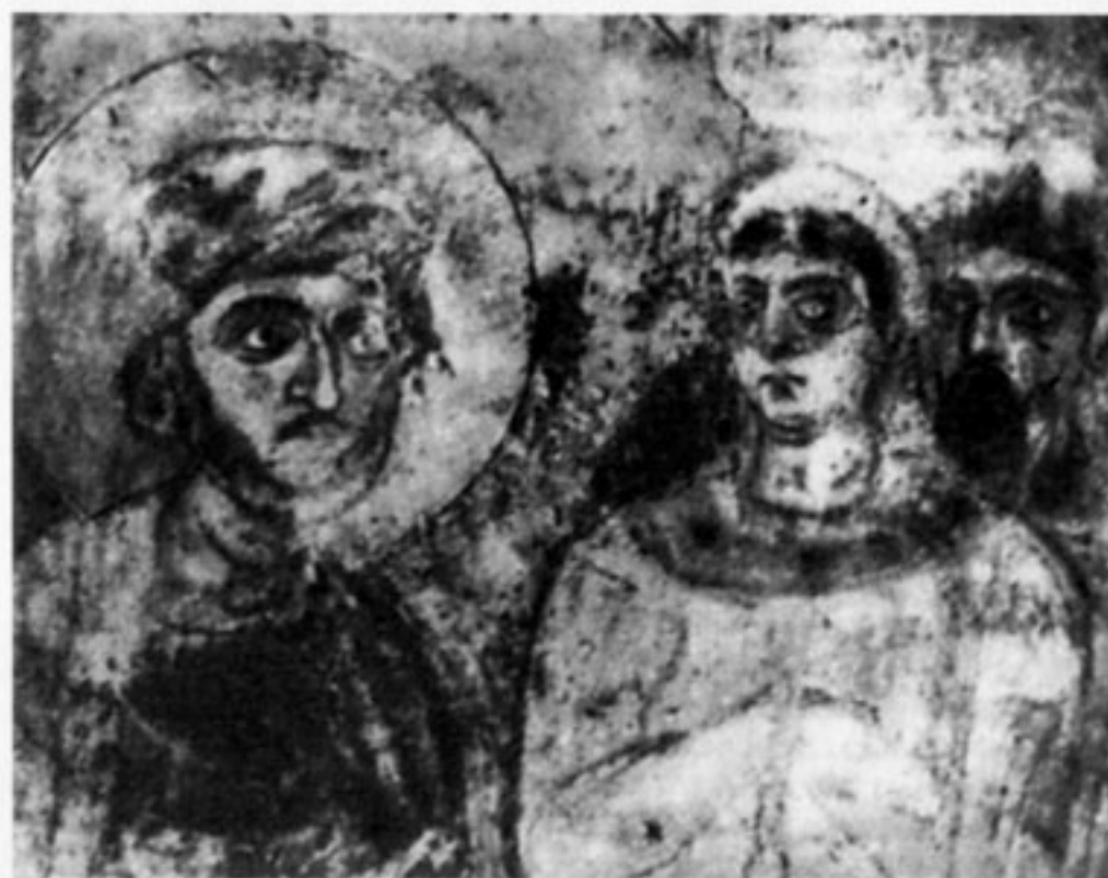
Княгиня Ольга и император Константин Багрянородный. Фреска Софийского собора в Киеве. XI в.

С распространением тюрко-хазарской орды от Урала и Каспия до Карпат и Крымского побережья возникла особая культурная ситуация. В Хазарском государстве были распространены не только ислам и иудаизм, но и христианство, особенно в связи с тем, что римские императоры Юстиниан II и Константин V были женаты на хазарских принцессах, а греческие строители воздвигали в Хазарии крепости. К тому же христиане из Грузии, спасаясь от мусульман, бежали на север, то есть в Хазарию. В Крыму и на Северном Кавказе в пределах Хазарии, естественно, растет число христианских епископий, особенно в середине VIII века. В это время в Хазарии существует восемь епископий. Возможно, что с распространением христианства в Хазарии и установлением дружеских византийско-хазарских отношений создается благоприятная обстановка для религиозных споров между тремя господствующими в Хазарии религиями: иудаизмом, исламом и христианством. Каждая из этих религий стремилась к духовному преобладанию, о чем говорят еврейско-хазарские и арабские источники. В частности, в середине IX века, как свидетельствует «Паннонское житие» Кирилла-Константина и Мефодия – просветителей славянства, – хазары приглашали из Византии богословов для религиозных споров с иудеями и мусульманами. Тем самым подтверждается возможность описанного русским летописцем выбора веры Владимиром – путем опросов и споров.