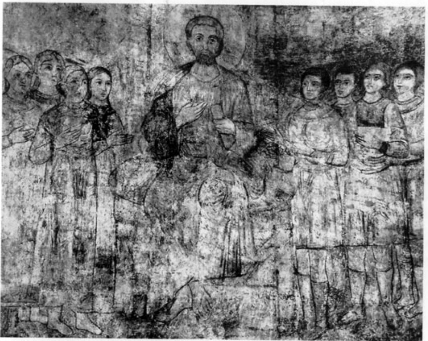
Проповедь апостола Петра. Фреска Софийского собора в Киеве. XI в.

дата чем-либо возвысит русскую культуру. Основное, что сделано восточным славянством для мировой культуры, сделано за последнее тысячелетие. Остальное – лишь предполагаемые ценности.