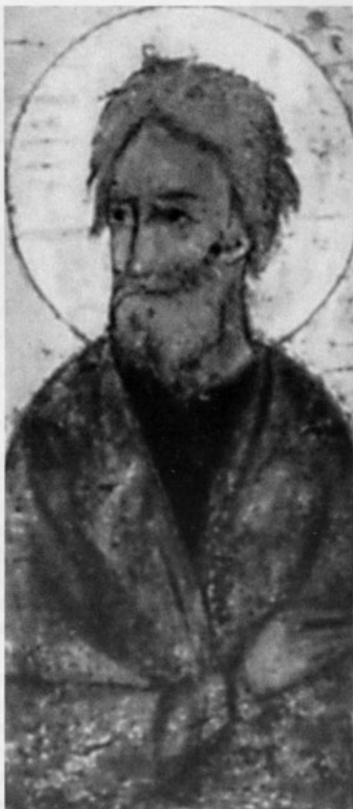
Апостол Андрей. Фрагмент иконы "Спаса Поясного" из Ростова. XIV в. Государственная Третьяковская галерея

также мученически погибший. Христианство в Крыму, нуждавшееся в епископе, достоверно зафиксировано уже в III веке.