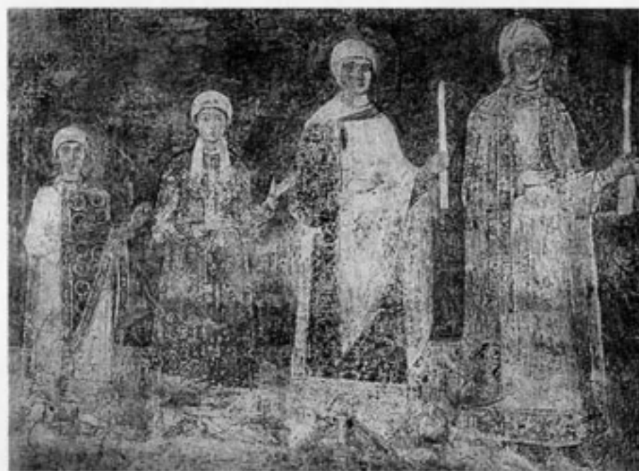
Семья Ярослава Мудрого. Фреска Софийского собора в Киеве. XI в.

написанном для своего сына – будущего императора Романа II (отца императора Василия II), – запретил своим потомкам вступать в брак с представителями варварских народов, ссылаясь на равноапостольного императора Константина I Великого, приказавшего начертать в алтаре св. Софии Константинопольской запрет ромеям родниться с чужими – особенно с некрещеными.