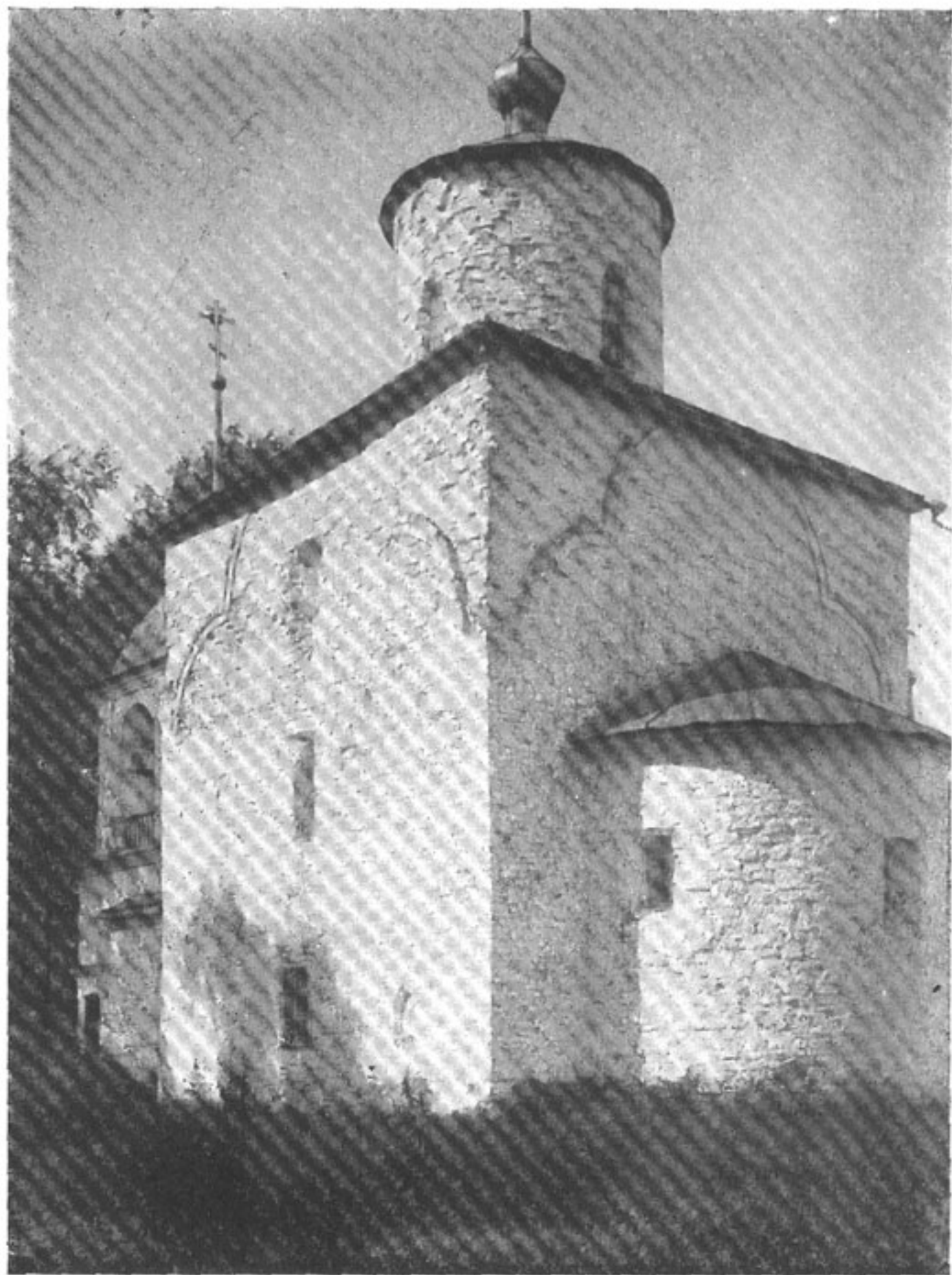
16. Церковь Успения в селе Волоотово близ Новгорода. 1352 г.