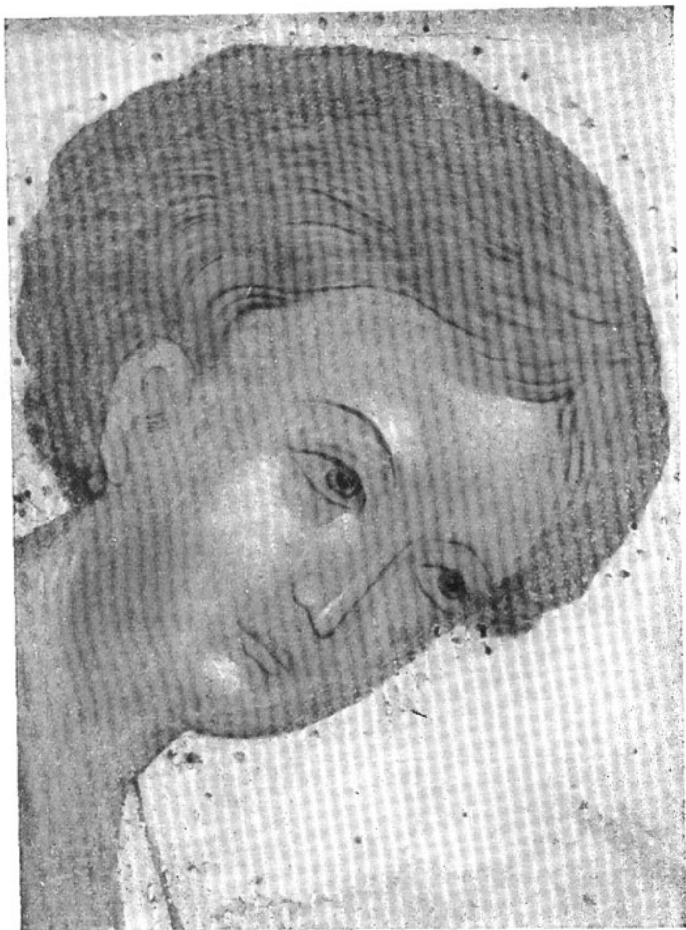
15. Дмитрий Солунский. Деталь иконы из Троицкого собора Троице-Сергиевой лавры. 20-е годы XV в.