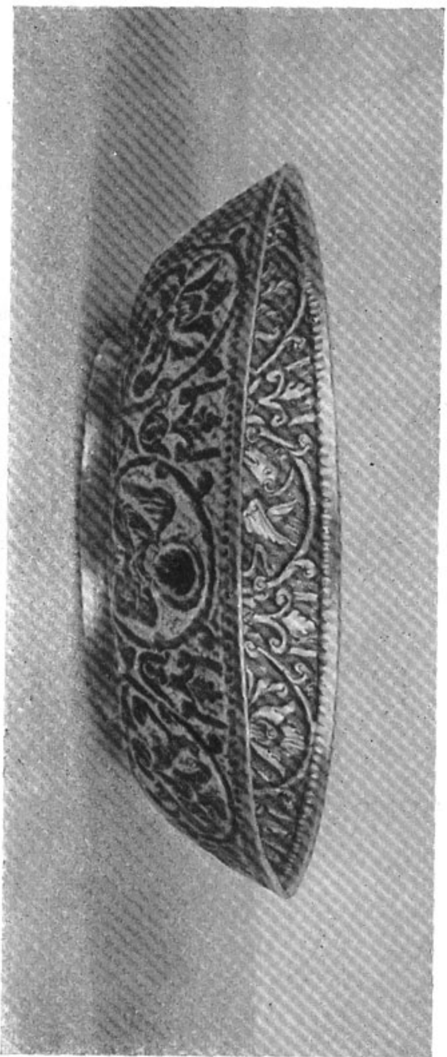
12. Микудинская чаша XV в. князя Юрия Даниловича. Государственный Исторический музей.