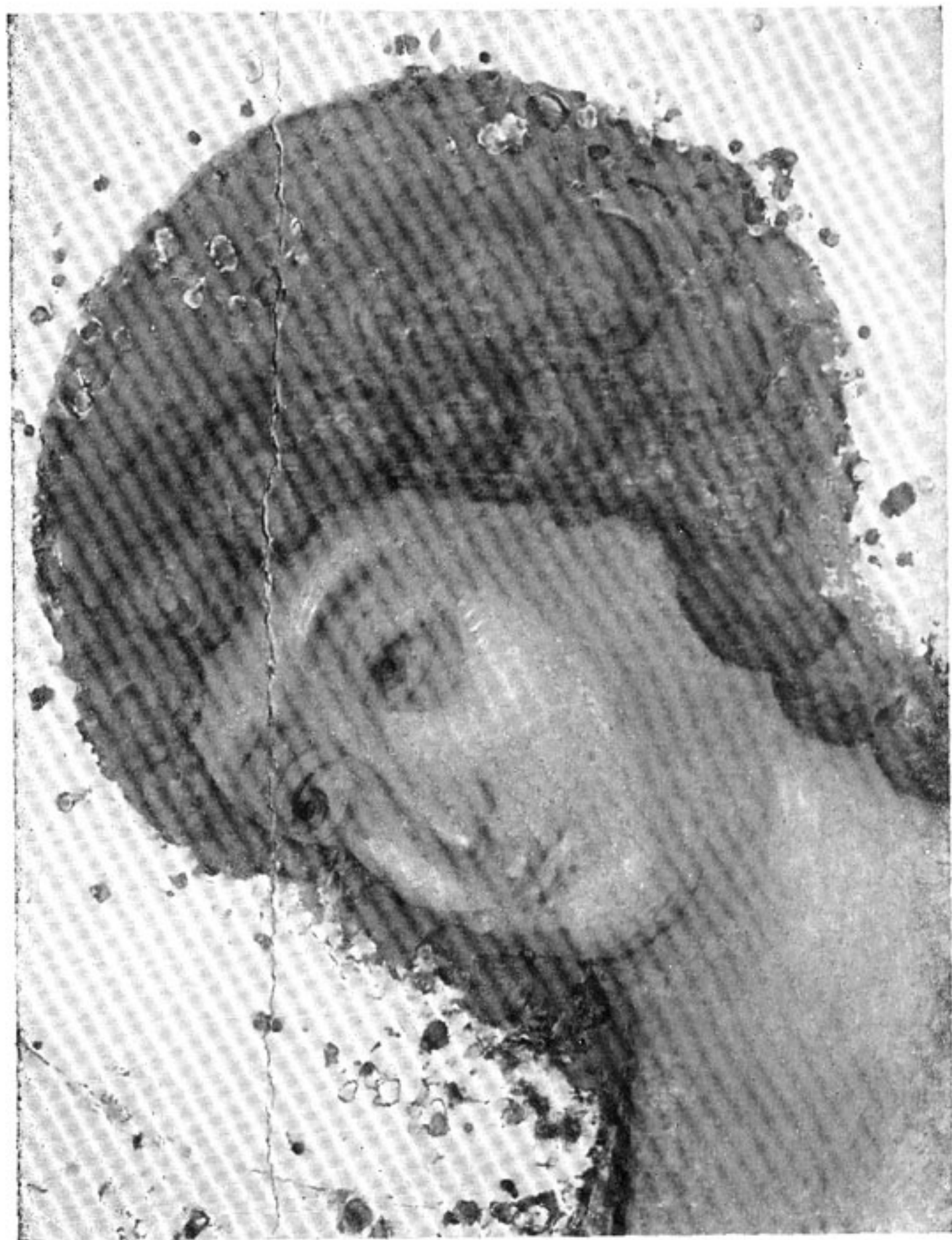
14. Голова ангела. Деталь иконы «Троица» Андрея Рублева. Начало XV в.