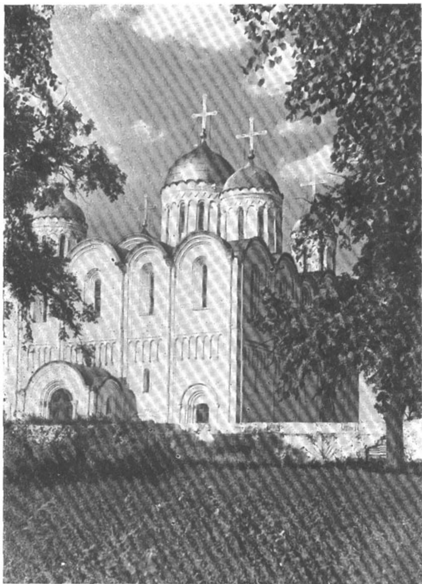
9. Успенский собор во Владимире. 1158—1189 гг.