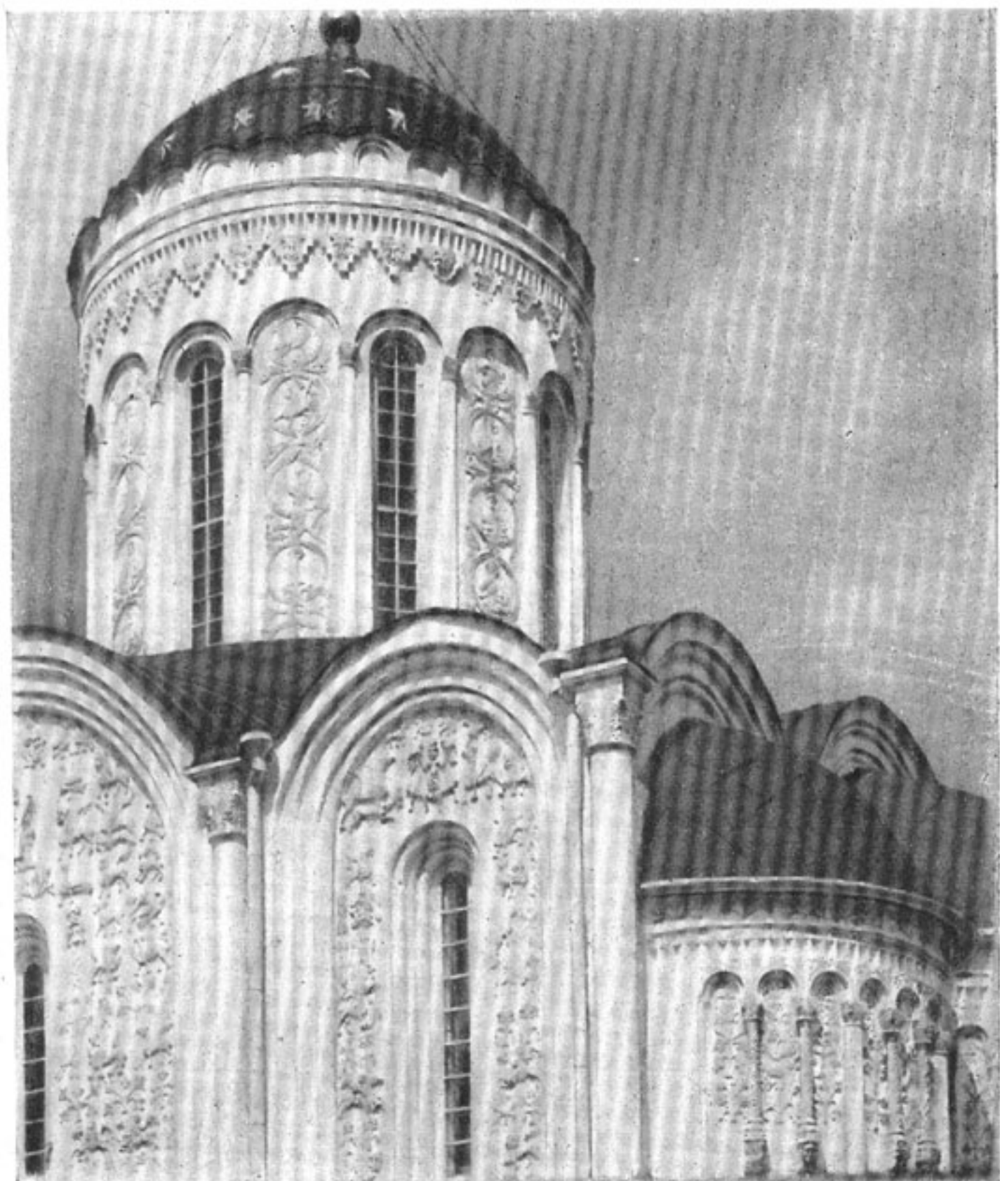
11. Каменные украшения Дмитриевского собора во Владимире. 1193—1197 гг. Деталь.