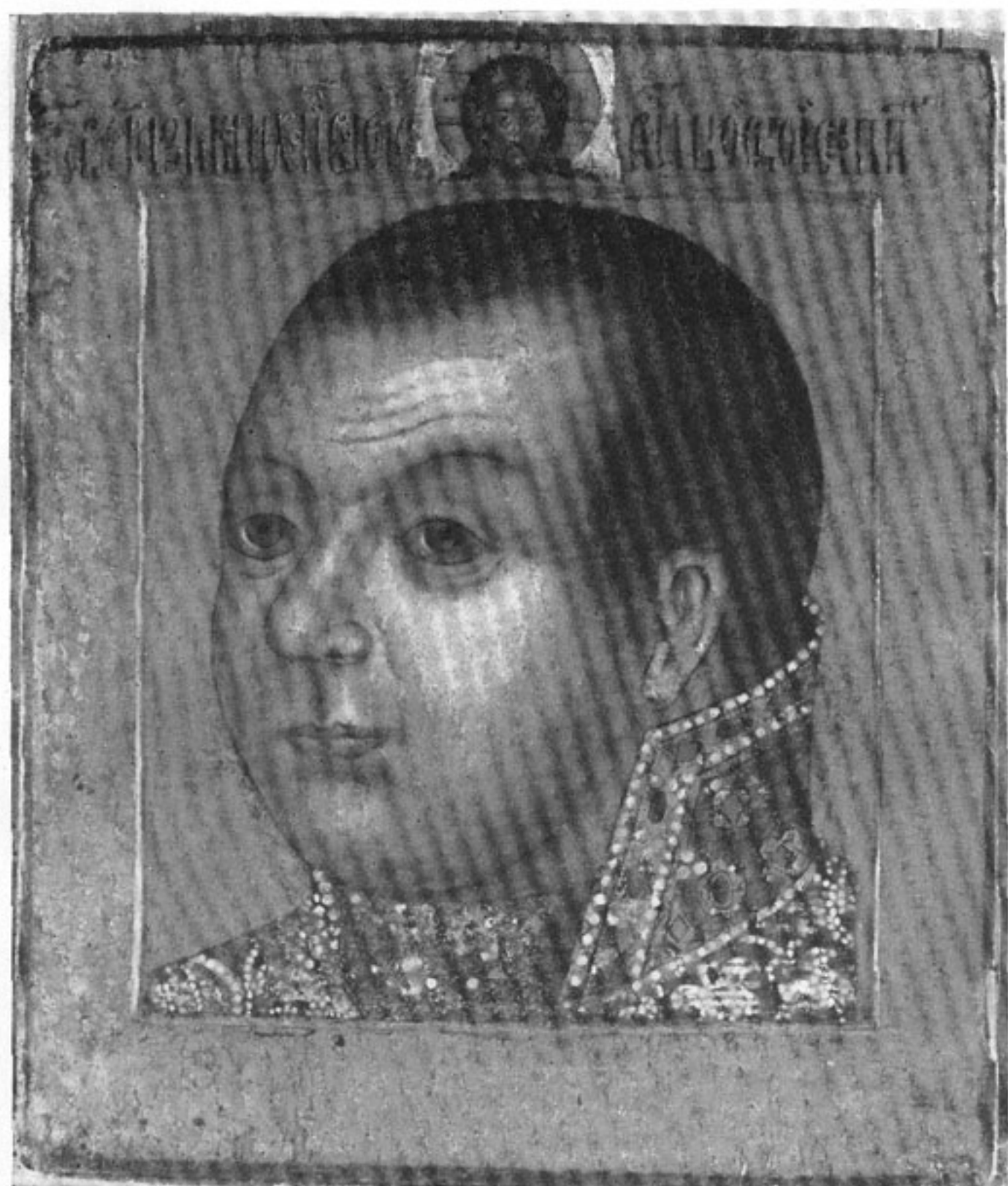
19. Князь Михаил Скопин-Шуйский. Парсуна. Первая половина XVII в.