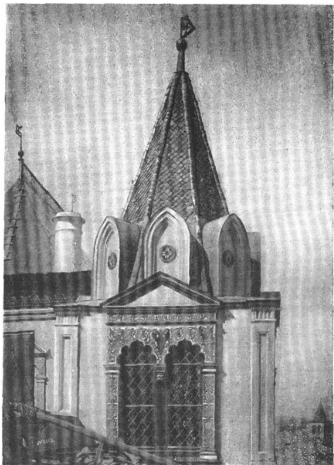
18. Деталь Теремного дворца в Московском Кремле. 1635—1636 гг.