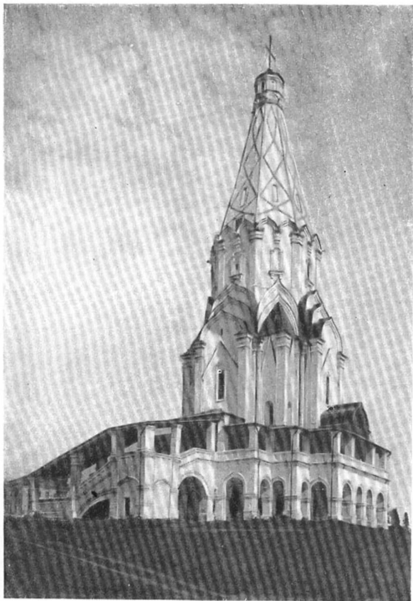
17. Церковь Вознесения в селе Коломенском под Москвой. 1532 г.