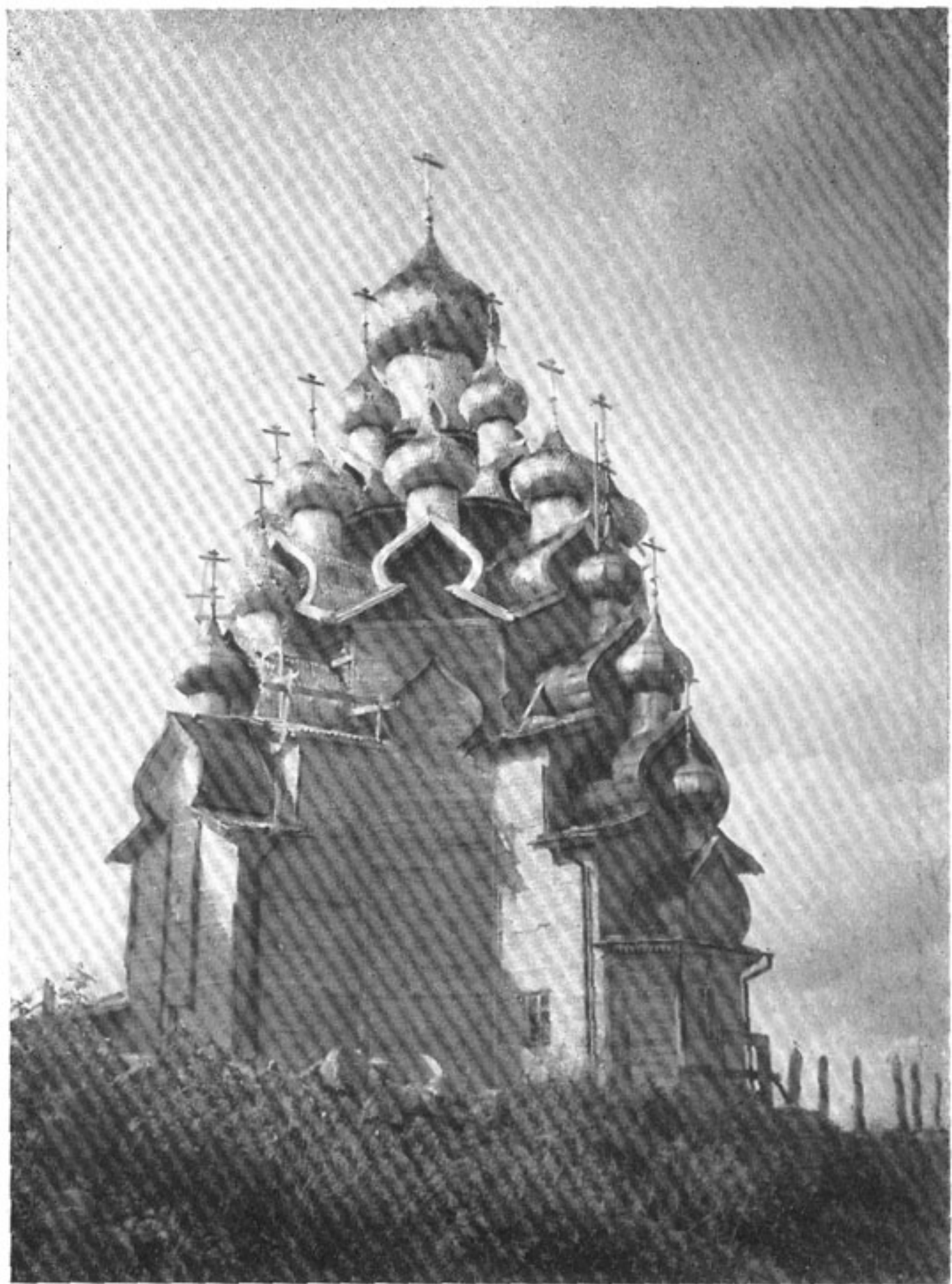
22. Церковь Преображения 1714 г. в Кижах.