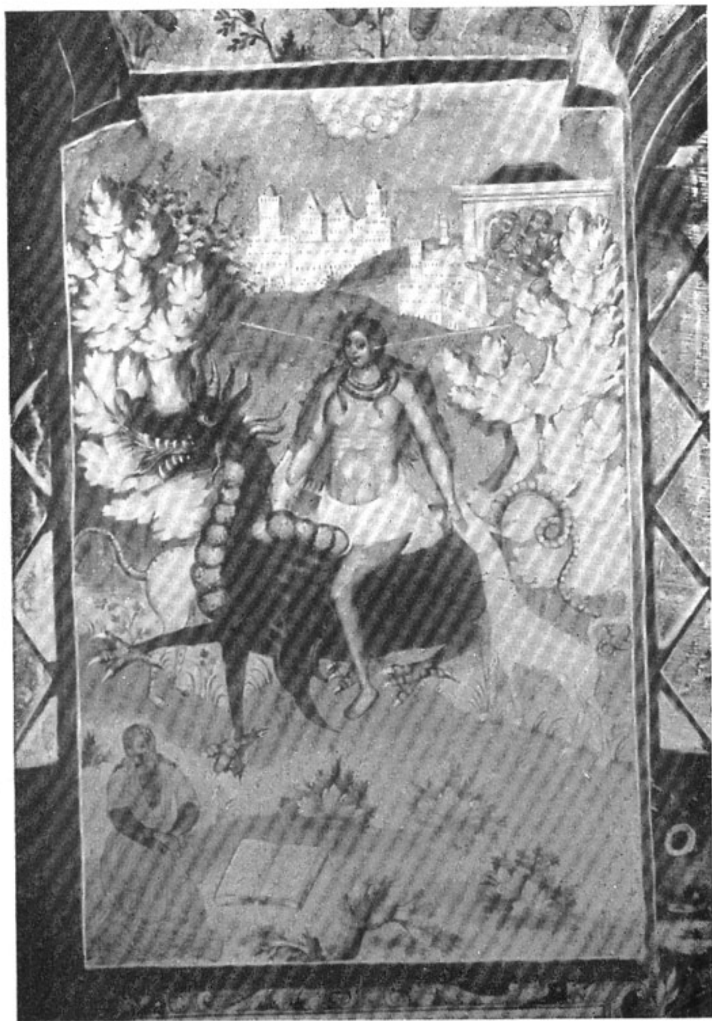
21. Деталь фрески 1694—1695 гг. «Казнь жены, грех свой не исповедавшей» церкви Иоанна Предтечи в Толчкове (Ярославль).