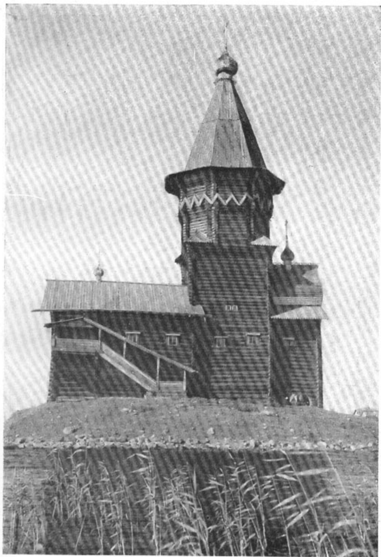
23. Церковь в Кондопоге 1774 г.