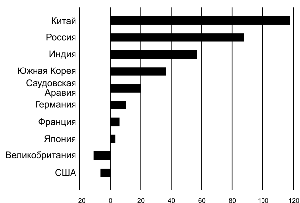
Рис. 1. Динамика оборонных расходов основных военных держав (2007–2016), %.

Таким образом, военные расходы Китая все еще гораздо меньше американских, но необходимо подчеркнуть: США, несмотря на возрастающие в последнее время издержки, тратят меньше, чем десять лет назад, а Китай — почти на 120 % больше. Небольшим утешением служит то, что другие страны с самым большим в мире военным бюджетом повысили свои расходы на много меньше.