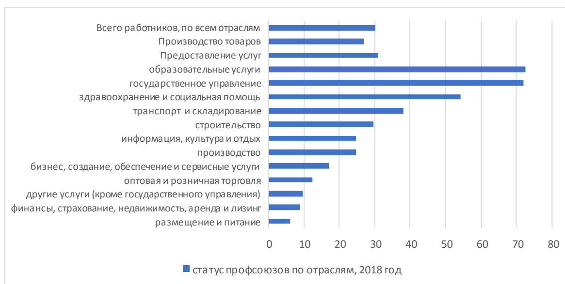
Рисунок 3 – Объединение в профсоюзы по отраслям (проценты), 2018 г.