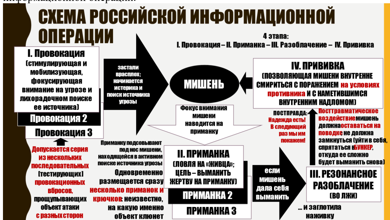
Рис. 10. Схема российской информационной операции.

Схема российской операции информационной войны, удовлетворяющая этим требованиям, представлена на рис. 10. Структурно она состоит из четырех этапов, включающих в себя: провокацию (1); приманку (2); разоблачение (3); прививку (4). Технологически в данной операции сочетается несколько приемов: рефлексивное управление (путем провоцирования противника на совершение немедленных ответных действий); «ловля на приманку»; публичное разоблачение «клюнувших на приманку» и, наконец, «прививка», позволяющая «жертве» внутренне смириться с поражением на условиях организаторов информационной операции.