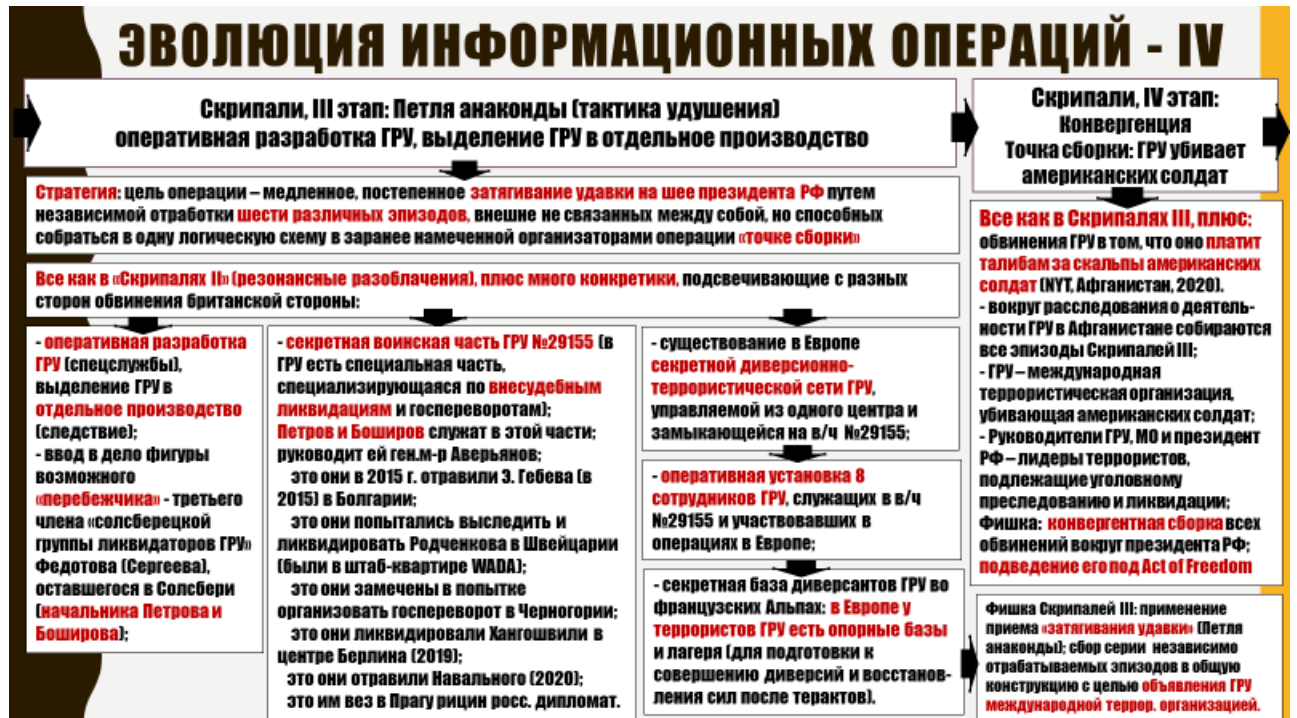
Рис. 4. Эволюция информационных операций. «Скрипале III-IV».