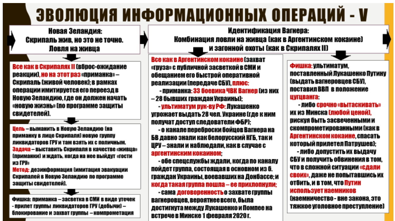
Рис. 5. Эволюция информационных операций. «Скрипали-V» - «Идентификация Вагнера».