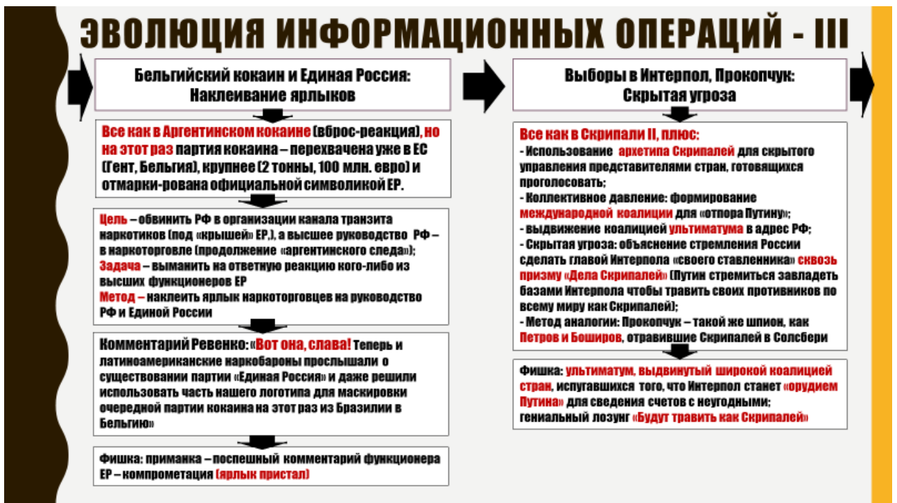
Рис. 3. Эволюция информационных операций. «Бельгийский кокаин» - «Выборы в Интерпол 2018».