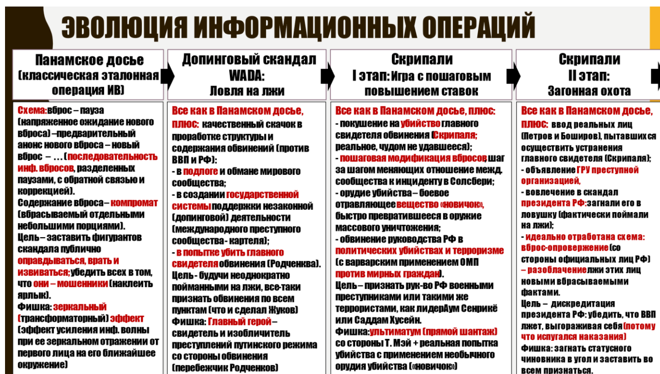
Рис.1. Эволюция информационных операций. «Панамское досье» - «Скрипали-II».

Дальнейшая эволюция форм и методов организации и проведения информационных операций связана с последовательной модификацией исходной схемы путем добавления новых приемов и уловок, способных «зацепить» жертву и вынудить ее совершить необдуманные действия, ведущие к ее дискредитации. Каждая новая операция добавляет в исходную схему что-то новое (новые технологические решения), оставляя при этом неизменной ее базовую часть, по-прежнему представляющую собой последовательность информационных вбросов, разделенных тактическими паузами («периодами тишины»).