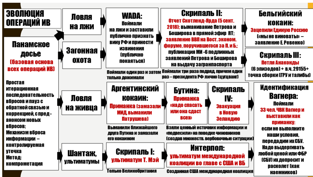
Рис. 8. Классификация информационных операций по используемым методам и уловкам.

«Ловля на приманку» реализовывалась сразу по двум направлениям: