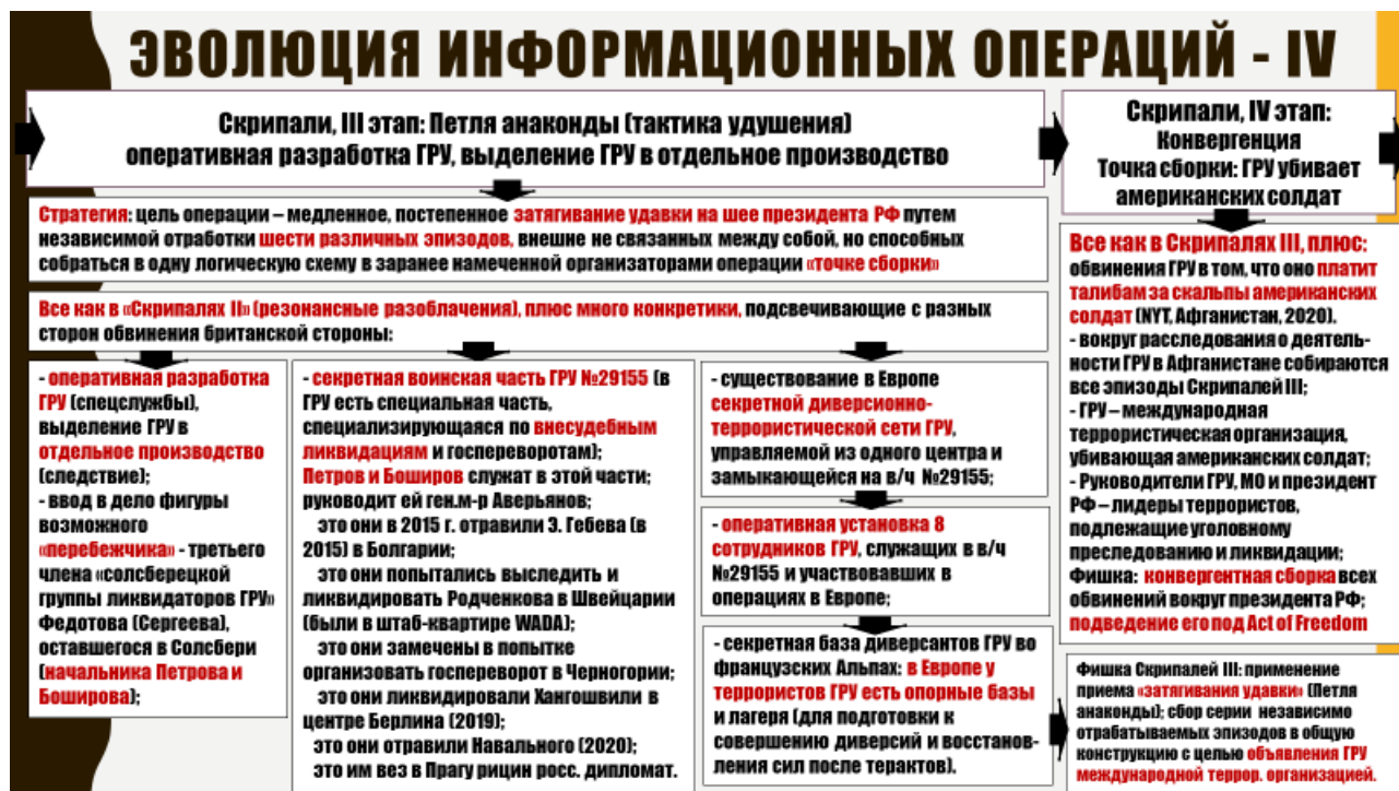
Рис. 4. Эволюция информационных операций. «Скрипали III–IV»