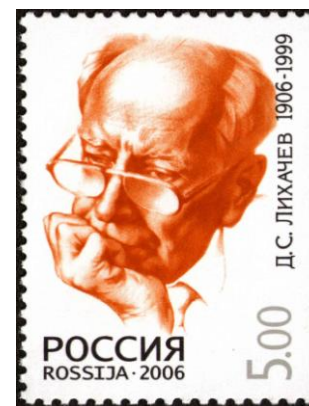
Почтовая марка, 2006