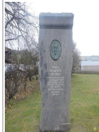
Мемориал Д.С. Лихачёву