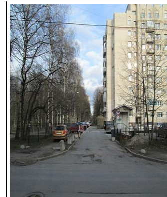
Аллея им. Д.С. Лихачёва, г. Санкт- Петербург