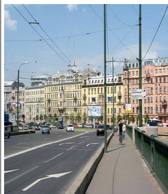
Площадь им. Д.С. Лихачёва, г. Санкт-Петербург