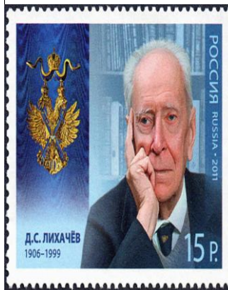
Почтовая марка, 2011