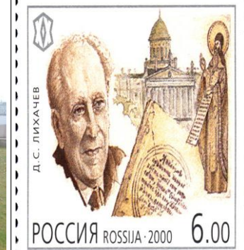
Почтовая марка, 2000