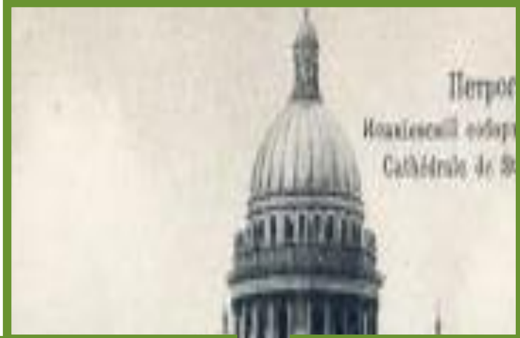
Петрос Новакленскі катэдр Cathédrale de St